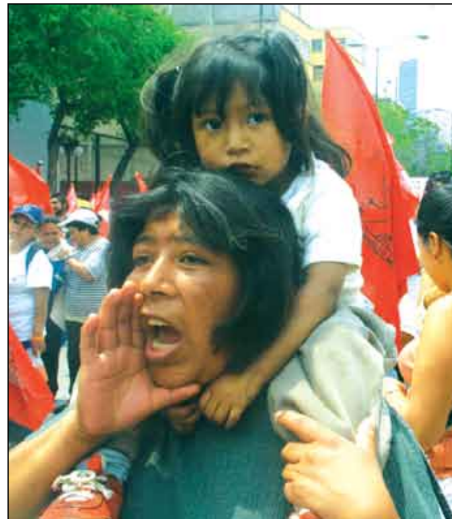
Antorcha. Víctima de acusaciones.

ses, a humildes michoacanos sin que sus reclamos le causen ni frío ni calor; por qué Zeferino Torreblanca, gobernador de Guerrero, niega toda discusión con los pobres de La Montaña y responde con una campaña mediática que acusa a sus líderes de corruptos sin ninguna prueba, y, finalmente, por qué el presidente panista de Toluca niega el cambio de uso del suelo a humildes colonos que sólo buscan dónde construir sus modestas viviendas. Es que todos ellos decidieron “desde el principio” que no negociarán con “organizaciones corporativas”, que no responderán a “demandas corporativas” y que el presupuesto público será sólo para sus incondicionales. Ésa es la ley y, como suele decir ese antiguo y sabio legislador llamado vulgo: “bajo advertencia no hay engaño”. b