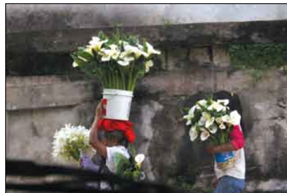
Pames, ignorados por las autoridades.