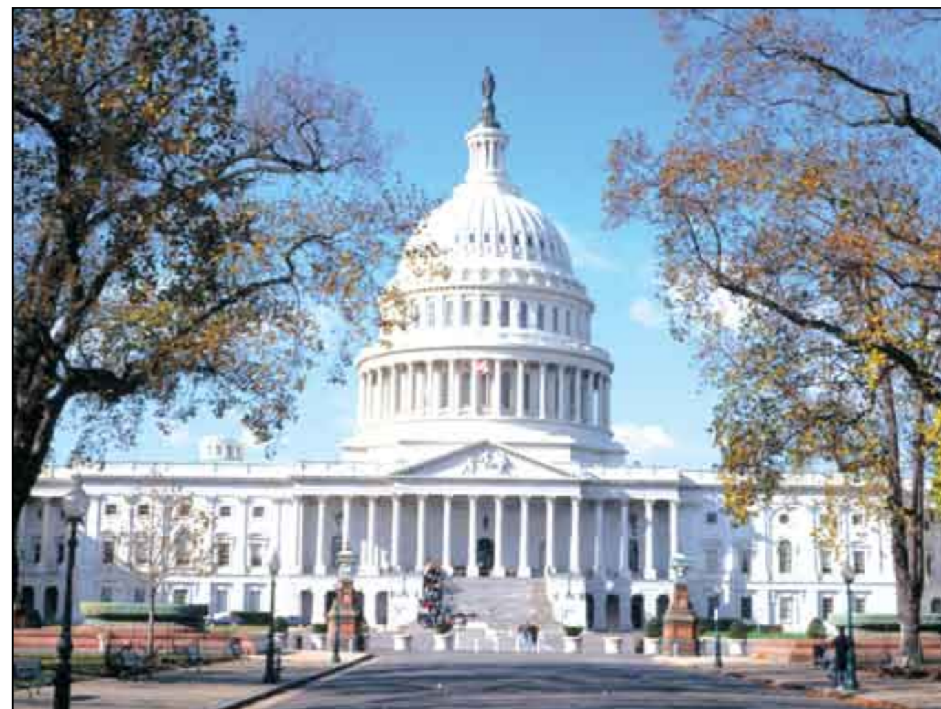
Gobierno norteamericano. A nombre de la "democracia"...

Los comandantes de la derecha mundial nos están demostrando con sus hechos que su sistema económico y el político que le corresponde, no marchan hacia la libertad del individuo, sino hacia su sujeción