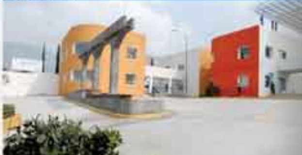
Construcción del Macrocentro Comunitario Angélica Aragón