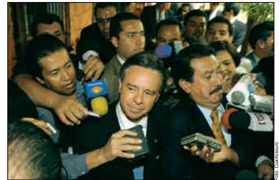
Medina Mora. En una encrucijada.

En los hechos, fue hasta que el gobierno de México solicitó, el viernes 13 de julio, la detención con fines de extradición de Zhenli Ye Gon; que su caso tuvo la rele-