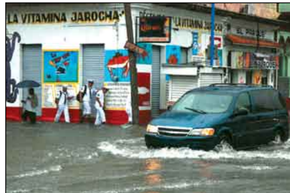
Inundaciones. Graves consecuencias.

Sin embargo, un reporte del CSVA refiere que la población en riesgo es mayor que la reconocida