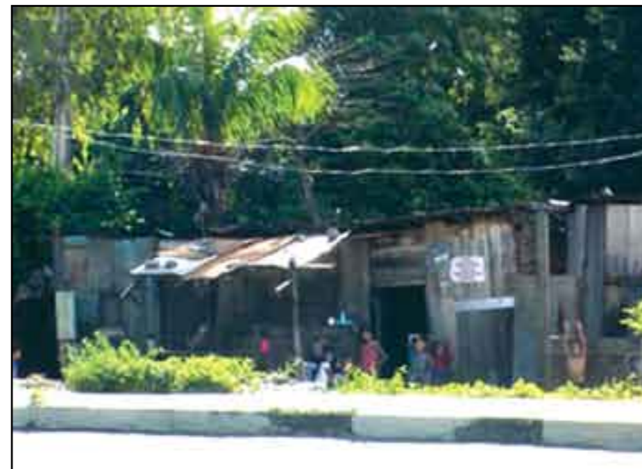
Más gasto en el estudio que en la aplicación.