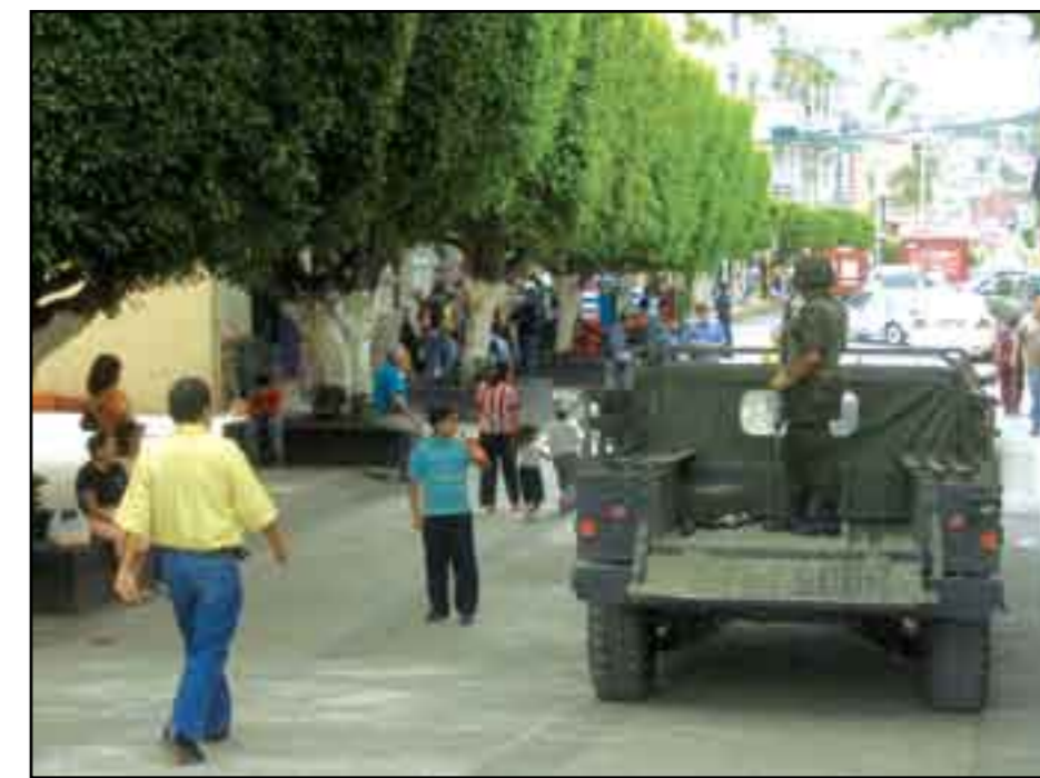
Uso indebido del ejército