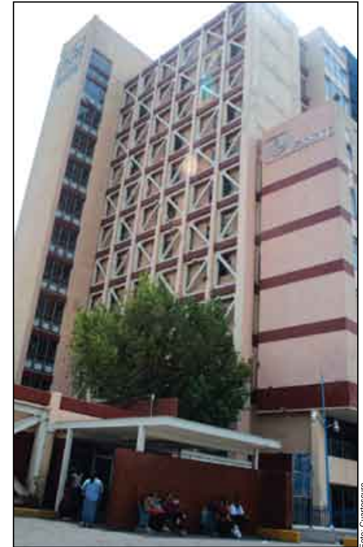
Atención médica. Pésima para los pobres.

Así pues, no creo errar al decir que el abandono de