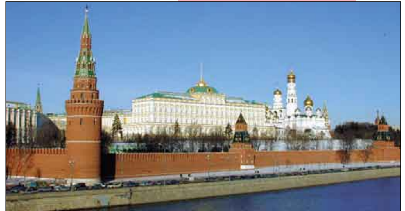
Rusia. Reactivando su economía.

Los temores de intelectuales y gobiernos occidentales confirman el hecho de que, efectivamente, Rusia ha venido fortaleciéndose recientemente, sobre todo en su economía. El Producto Interno Bruto, que se desplomara a durante la década de los 90 a partir del derrumbe de la URSS en 1991, según la ONU, viene creciendo a partir de 1999, y en 2002 recuperó su nivel de 1990. Desde entonces, crece de manera sostenida a un promedio de 6.5 por ciento anual, lo que hace de Rusia ya la