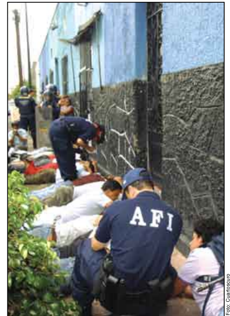
La solución no es responder a la violencia con violencia.

En consonancia con esto, no tenemos duda de que, aun quienes protestan por caminos distintos a los nuestros, tienen una causa justa que perseguir en el fondo; que no son simples delincuentes ni deben ser tratados como tales; que no se debe actuar en su contra asumiendo que toda la culpa es de ellos y que el gobierno y sus simpatizantes están exentos de toda responsabilidad. En mi modesta opinión, los muy preocupantes sabotajes a Pemex son una buena oportunidad para que el presidente Calderón muestre verdadera estatura de estadista: que aplique con rigor, pero con justicia, la ley a los aspectos punibles de tan lamentables hechos, pero que reconozca al mismo tiempo lo que haya de cierto y de justiciero en sus reclamos y tome las medidas necesarias para