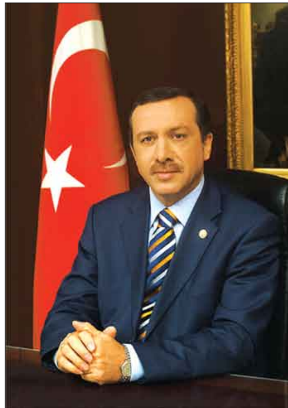
Recep Tayyip. Aliado del imperialismo.

Las enormes manifestaciones callejeras que tuvieron lugar durante abril y mayo en Turquía, la sorda lucha de clases que se esconde tras ellas, es consecuencia de que los sectores ligados al Estado propietario y al laicismo, entre ellos sectores importantes del Ejército, temen que el Primer Ministro actual, Recep Tayyip Erdogan, lleve adelante su política de fortalecimiento del sector privado, aumente el poder de los religiosos