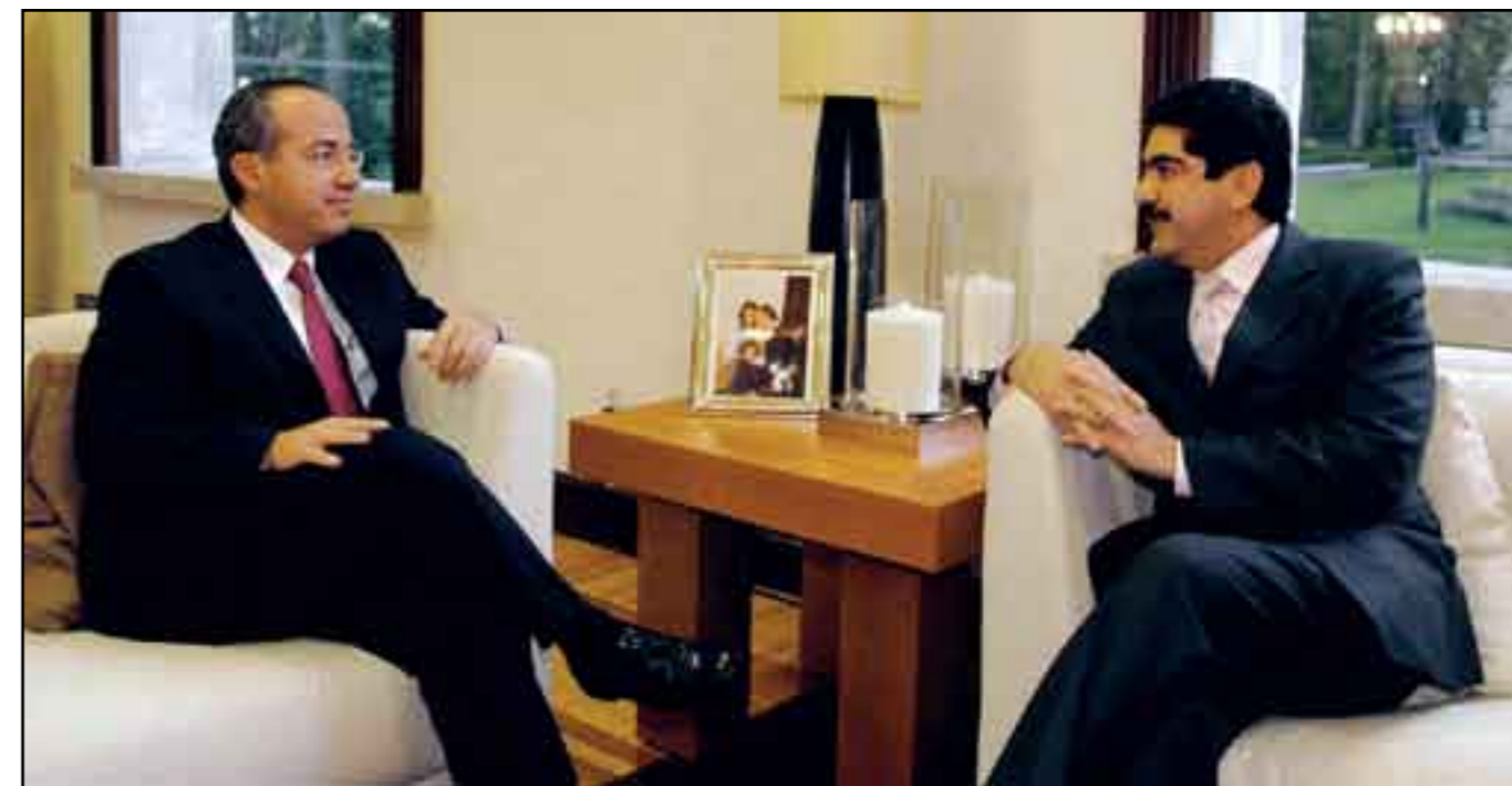
Calderón y Espino. La lucha por el poder.

Cuando trabajó en Pemex, en agosto de 2003, Nava fue acusado de tráfico de influencias a favor de su suegro, pues desde el Banco Nacional de Obras y Servicios Públicos (Banobras), entonces dirigido por Calderón -cargo que también ocupó brevemente luego de dejar la coordinación de los panistas en la LVIII Legislatura y antes de su nombramiento como secretario de Energía- presuntamente se apoyó financieramente de manera