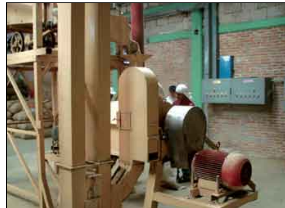
Poco productivos a altos costos.