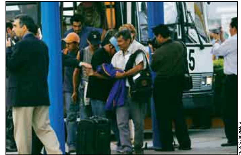
Inmigrantes. Fuerza de trabajo de reserva.

Estados Unidos, con todo su poderío, depende de la clase obrera y ya tiene problemas de mano de obra que se vuelven más agudos en ciertos sectores de la economía, en ciertos niveles de calificación y en ciertas