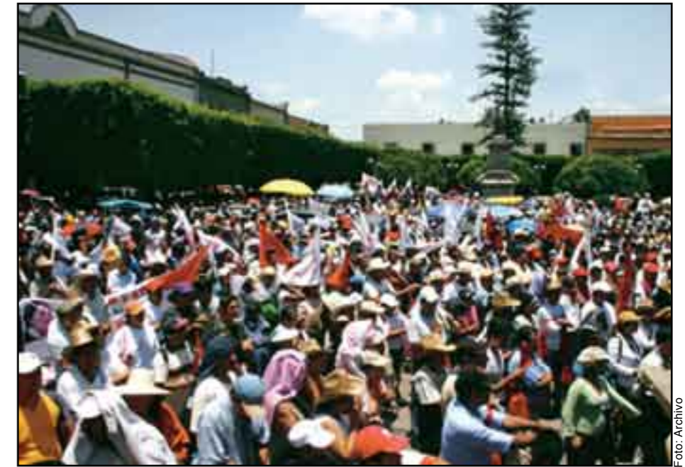
Gobernantes contra la gente que lucha.

Portal y portal.com.- "Será negativa la respuesta a la petición del fraccionamiento antorchista, adelanta edil" (el Presidente Municipal panista de Toluca). Sigue la nota: el décimo quinto regidor del ayuntamiento "indicó que los documentos que ha presentado el grupo... son insuficientes para integrar un documento que avale una respuesta favorable". Falso. "El grupo" ha presentado documentos y argumentos de sobra para justificar su petición; se trata de un acto más de represión política de un gobierno panista en contra de Antorcha Campesina.