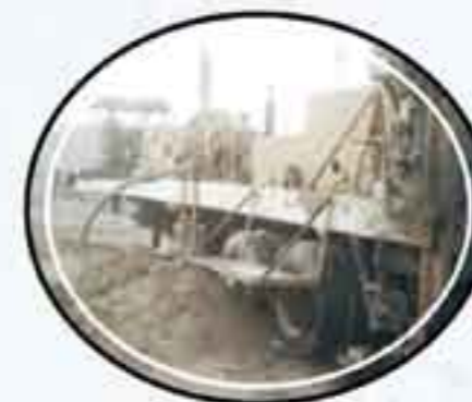
Pozo Santa María

Inversión: 1 millón 570 mil pesos Beneficiados: 20 mil habitantes