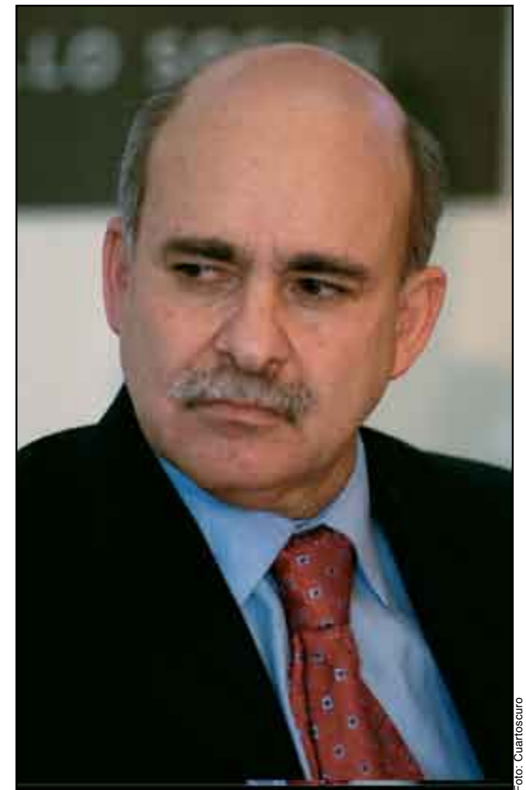
Secretario de Economía. Incapaz de ofrecer una solución al desempleo.

El valor de todo esto es que el mismo gobierno,