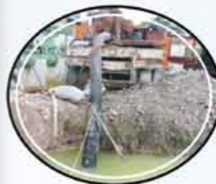
Pozo San Lorenzo

Inversión: 3 millones 220 mil pesos Beneficiados: 6 mil habitantes.