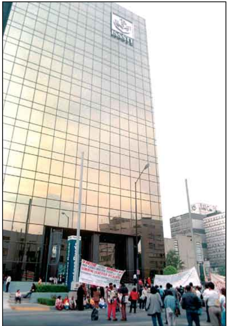
Las protestas no paran.

Finalmente, no puede negarse la necesidad, válida para todas las instituciones, de garantizar