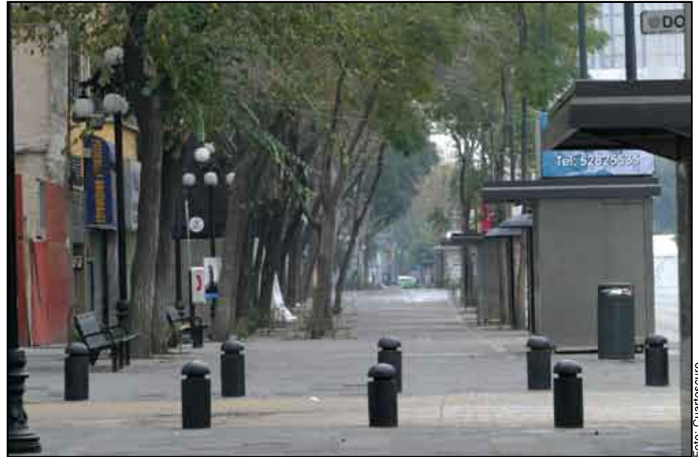
Calles. Libres de ambulantes.