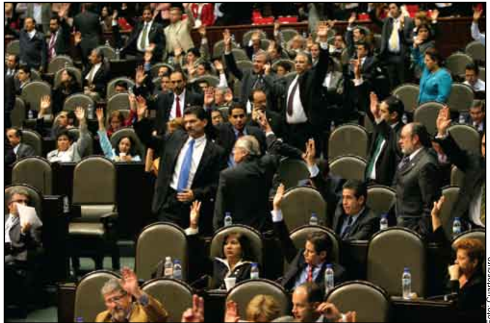
Legisladores. Con prisa.

Sin embargo, para evitar que un sindicato, persona o partido político se “apoderen” del Pensionisste, en la Cámara