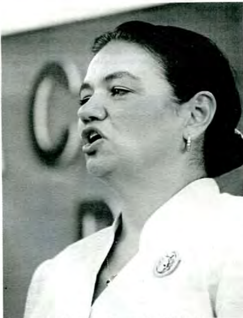
DULCE MARÍA SAURI, PRESIDENTA DEL CEN DEL PRI

El hecho es que con últimas elecciones, el PRI cierra un largo ciclo de siete décadas en el poder, y su futuro, a definirse en los meses subsecuentes, es hoy la mayor interrogante política del país. Roto el sistema de partido de Estado. Cortado el enfermizo cordón umbilical con la presidencia liberada su contradicción fundamental entre un cuerpo político gestado en el nacionalismo social pero con cabeza