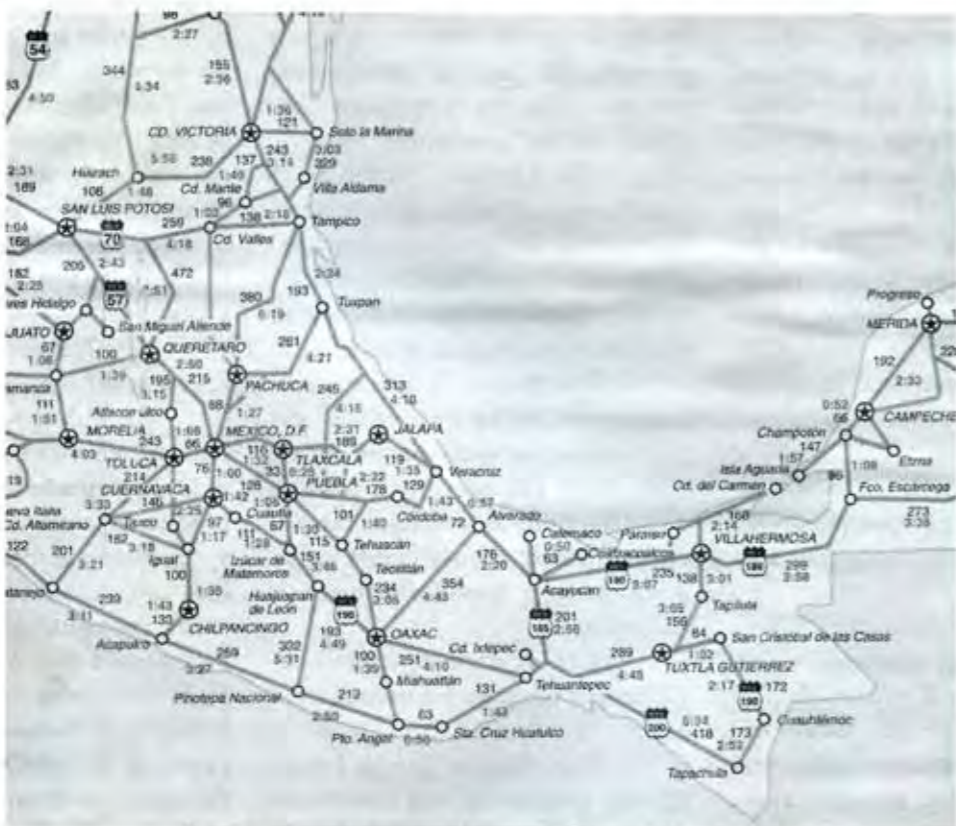
RUTA DE EVACUACIÓN DE INDOCUMENTADOS CHIAPAS-QUERÉTARO

...es demasiado que hasta a los extranjeros les pidan "mordida".