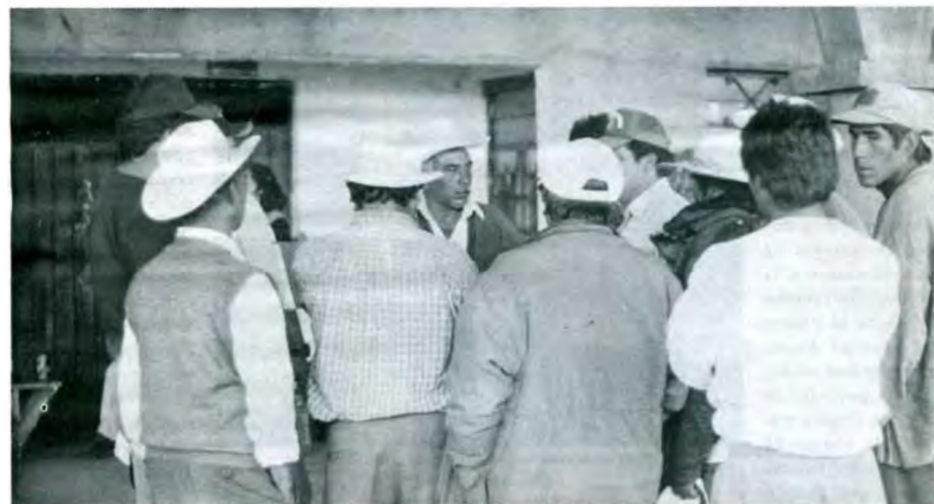
LOS POLLEROS COBRAN DE 2 MIL A 4 MIL DÓLARES A CADA INDOCUMENTADO POR LLEVARLOS A LA FRONTERA NORTE

“Los concentran en Puebla y de ahí los empiezan a mandar. Unos se van por Hidalgo, y debo señalar que en un tiempo mandaban grupos de hasta 30 personas en un solo envío que han tenido que reducir a tres o cinco por la vigilancia estricta que hay. Salen pues de Puebla, llegan a Tlaxcala, pasan por Calpulalpan y llegan a Sahagún”, Federico Pérez Luna, director de la Policía Ministerial del Estado de Hidalgo.