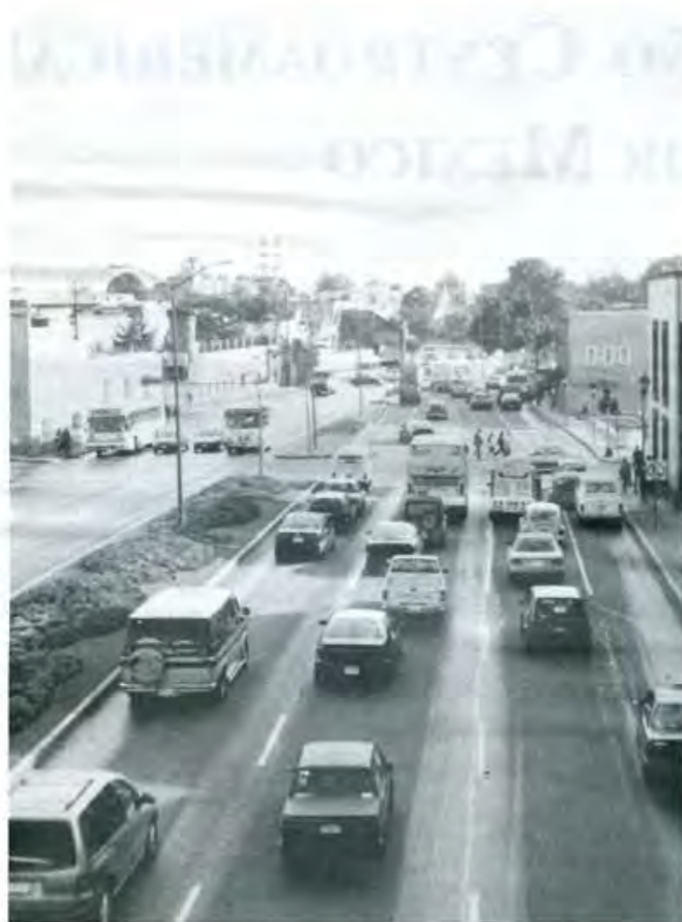
DECENAS DE INDOCUMENTADOS LLEGAN DIARIAMENTE A PUEBLA SIN SER DETENIDOS

En la Central de Autobuses de Puebla compran boleto con dirección a Pachuca o el Distrito Federal. Los que deciden ir por Pachuca compran su boleto en la línea México-Textcoco con destino a la capital hidalguense. Los que pasan los retenes policiacos y se encuentran en Pachuca se dirigen a Querétaro de donde toman