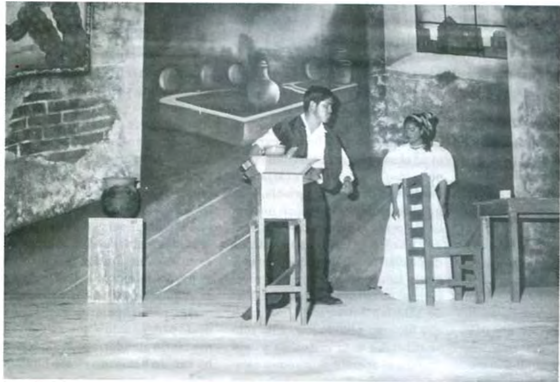
EL DIVO DE PUEBLA Director de Teatro

falarios y movimientos acorde al personaje que representaba dio origen a una de las profesiones más extraordinarias que hasta la fecha se práctica: la actuación.