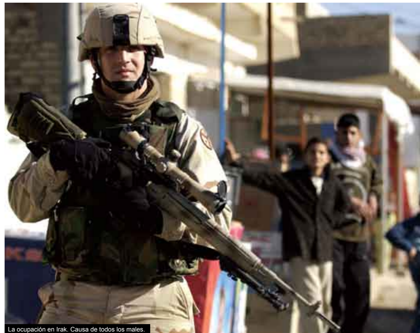
La ocupación en Irak. Causa de todos los males.

Ocupación que, no debe olvidarse, es un gran negocio. Ya se ha documentado mucho, pero ahora encontré un reportaje en el diario New York Times, cuyas partes principales conviene que se conozcan y difundan. En el estilo