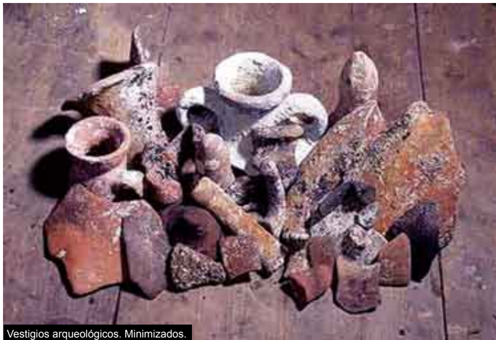
Vestigios arqueológicos. Minimizados.

gente que vivía en ese barrio tenía relación con gente de ese estado.