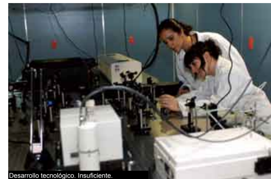
Desarrollo tecnológico. Insuficiente.

Asimismo, se ha establecido que la disparidad en el acceso a las tecnologías de la comunicación y la información, que se conoce como “brecha digital”, es uno de los más importantes obstáculos, ya que sólo 11 por ciento de los