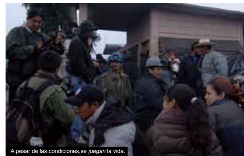
A pesar de las condiciones, se juegan la vida.

Pero hay más piezas en este cerco terrible que atrapa a los obreros. La otra es el sindicato, en este caso el de Trabajadores Mineros, Metalúrgicos y Similares, mismo que después de la desgracia se apresura a lavar su imagen, quejándose de una situación que ha ayudado a preservar durante