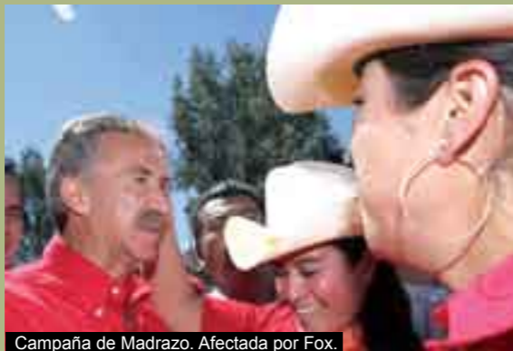
Campaña de Madrazo. Afectada por Fox.

Más carne pa’ los leones. La exigencia de los medios de comunicación más influyentes para arribar a un México moderno no deja de ser una petición de dientes pa’ fuera... o pa’ dentro, según la óptica. Pugnan por el avance... sin tocar sus intereses. Para ellos el respeto no es signo de nada. Porque si se tratara de ser justos, los medios (fundamentalmente los electrónicos) tendrían que someterse a las reglas elementales de respeto. Para el caso: la desgracia de los mineros que perecieron en el derrumbe de una mina en Coahuila se dio apenas en el marco perfecto que los noticieros de televisión y radio requieren para explotar el morbo de la audiencia que es conducida perversamente a conductas oprobiosas ante el drama ajeno. Aplicar la ley no es para ellos. Están sueltos. La peor desgracia para ellos es que en este país no ocurra nada “digno” de explotar para aumentar su rating, antes que el compromiso de informar. Es imperativo legislar sobre el asunto. Pero el primer temeroso es el Estado que debe cohabitar con el monstruo que ha creado. b