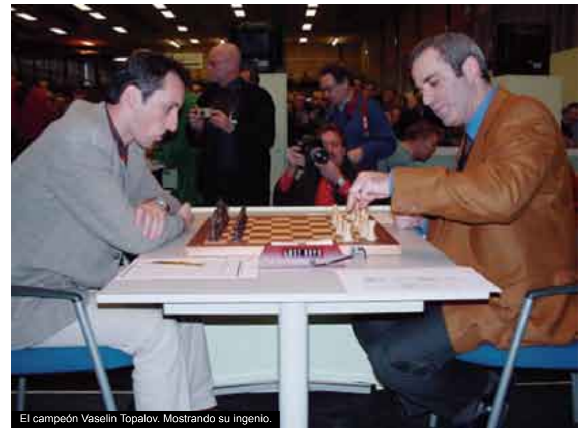
El campeón Veselin Topalov. Mostrando su ingenio.

No siempre se tienen grandes figuras del deporte internacional en México. La visita de Topalov equivale a las que han hecho personalidades como el ya mencionado Kasparov y en otros deportes a las de Pelé, Maradona, Magic Johnson y otros iconos de las distintas personalidades. b