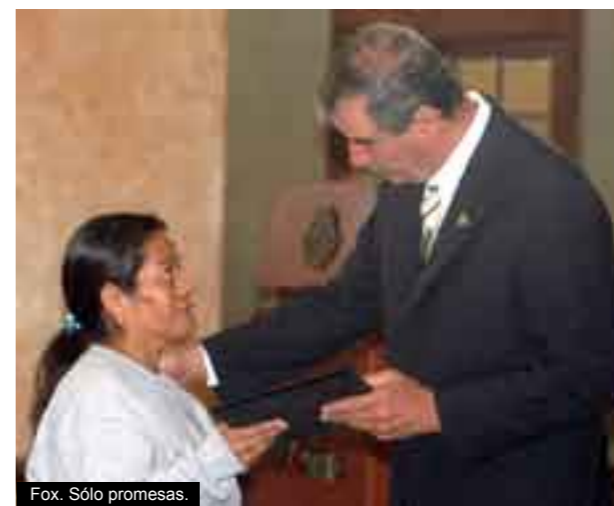
Fox. Sólo promesas.

Vicente Fox y el PAN no le cumplieron al pueblo de México y el cambio prometido nunca llegó. En las próximas elecciones meditemos nuestro voto pensando en la frase del gran científico alemán Albert Einstein “Locura: Seguir haciendo lo mismo y esperar resultados diferentes.” b