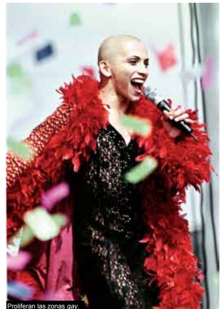
Proliferan las zonas gay.

Por ello, esta agrupación desarrolla el programa “Máscaras y Realidades” para promover el uso de preservativo, entre homosexuales, bisexuales, lesbianas, transexuales y sexoservidores que acuden a este sitio, ya que Neza es el municipio con más casos de sida en el estado, con más de dos mil portadores. b