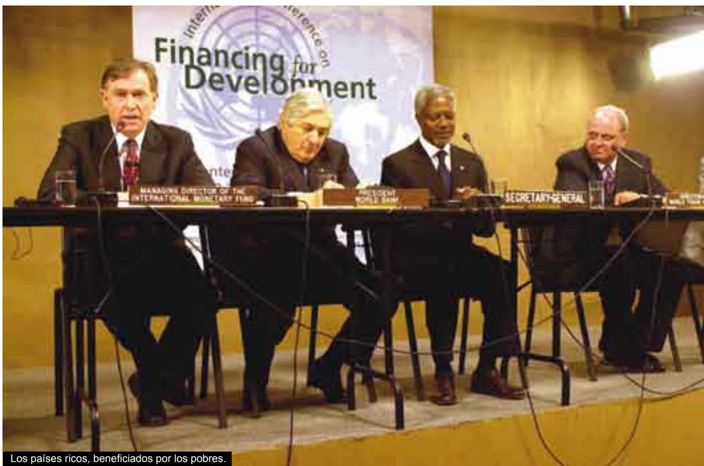
Los países ricos, beneficiados por los pobres.

vía 56 mil millones de dólares como utilidades o pago de intereses, no obstante que día a día se nos habla de pretendidos apoyos otorgados para paliar la horrible pobreza en que se debate la inmensa mayoría de su población.