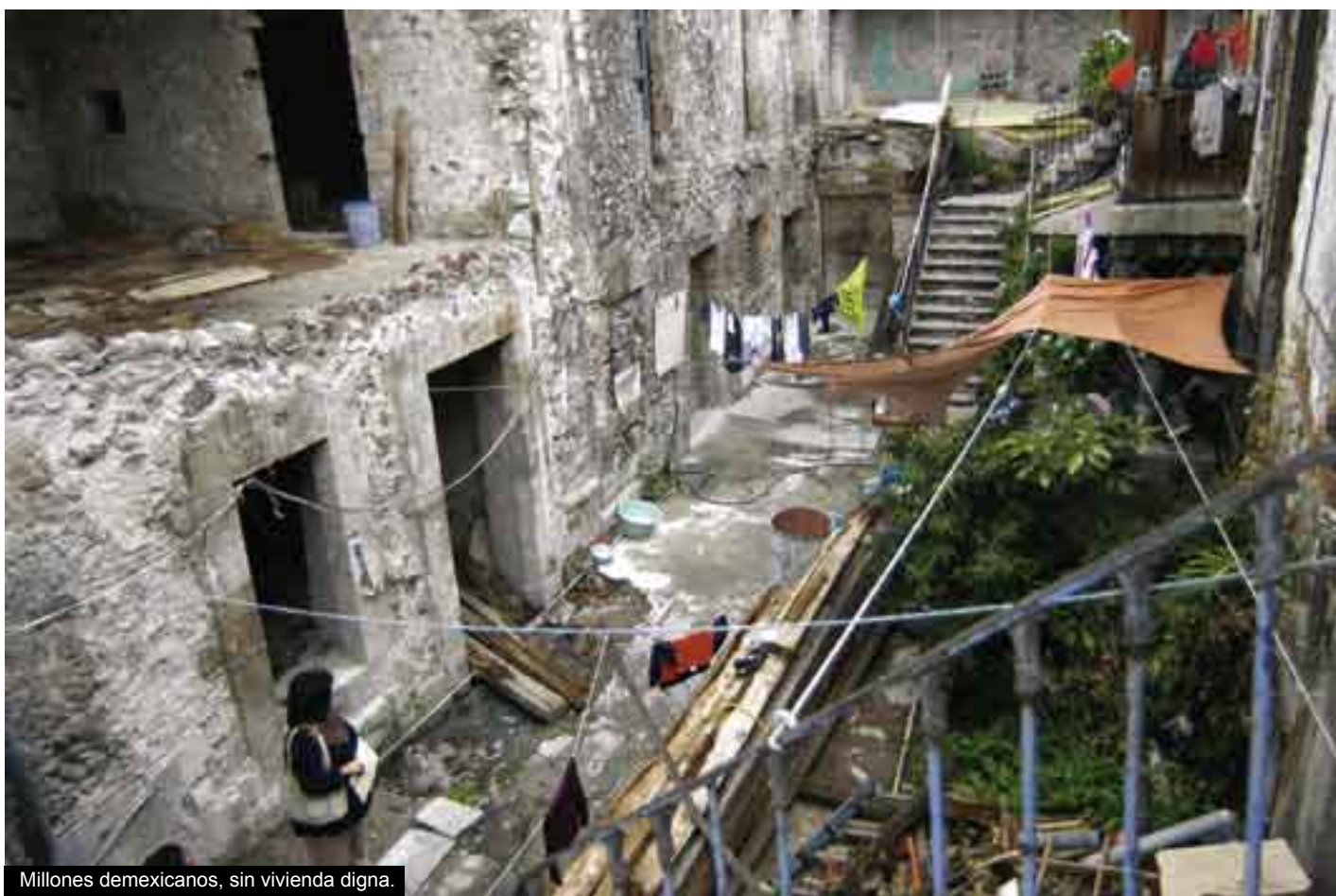
Millones demexicanos, sin vivienda digna.

industriales y organismo públicos se han diseñado muebles y paquetes dirigidos a personas con escasos recursos, que adquirieron, o están por hacerlo, una casa de este segmento”, pero, dichos muebles, son “de dimensiones reducidas”, justo para que quepan en la “pocilga”.