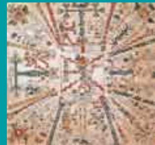
Representación del universo mesoamericano. Códice Fejérváry-Mayer