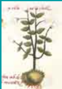
Yolloxóchitl o flor del corazón

La inclusión de la flor en la vida tanto mágica como cotidiana del hombre prehispánico fue tal que se mandaba a construir increíbles y majestuosos jardines con la mayor cantidad de flores y árboles que sería difícil imaginar sino fuera por los testimonios y códices encontrados como el Códice Matritense, que nos detalla la magnificencia del jardín del señor de Itztpalapa, Cuitlahuac II, el cual maravillo a los conquistadores por su gran variedad de clases de árboles así como de flores de diferentes regiones en donde se podían encontrar un Cochitzzápotl o zapote blanco que era de uso medicinal, un Yauhtli o pericón de uso ritual hasta un Tlalayotli o calabaza de la tierra de hojas comestibles y raíz medicinal. Las fiestas y rituales no eran ajenos para las flores, su función era importante e imprescindible, solían aparecer como actrices principales de estas festividades o como elemento mágico-religioso en estas. Una festividad en donde se sabe hacían su aparición las flores era la de Tzoztontli, dedicada a Coatlicue en donde lo curioso era que las flores que se ofrecían en su templo eran las primeras que nacían en ese año y nadie osaba a olerlas hasta que se ofrecieran a la mencionada diosa. Otra fiesta en donde lucían las coloridas flores era en la de tlaxochimaco, dedicada a Huitzilopochtli, en donde se le ofrecían diferentes clases de flores en forma de ramo y de collares.