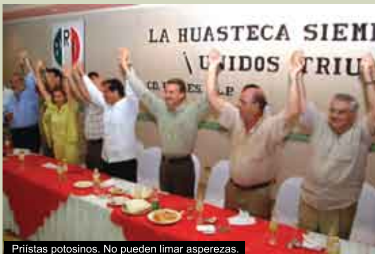
Priístas potosinos. No pueden limar asperezas.

También dijo que la dirigencia estatal asumió la responsabilidad de reconstruir al priísmo, logrando una “gran participación en la Huasteca, en la zona Media y en el Altiplano”, no en ésta capital que se sigue considerando bastión del PAN.