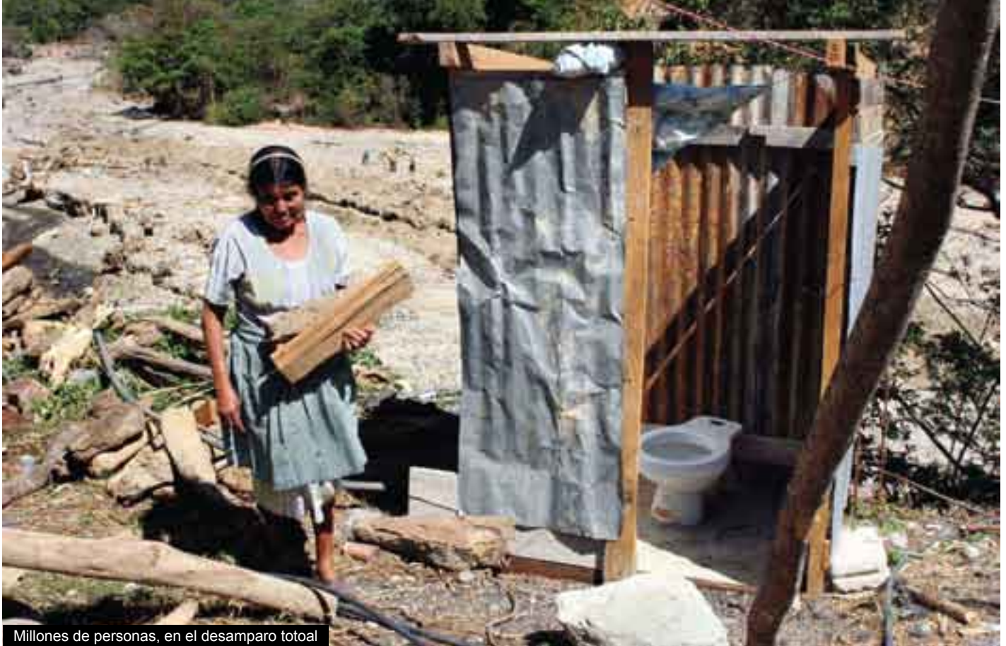
Millones de personas, en el desamparo total

tido en los becerros de oro que todo mundo adora, se está desperdiciando escandalosamente a las únicas fuentes de riqueza hasta ahora conocidas: la naturaleza y el hombre. Y conste que no considero aquí las mermas, como la destrucción definitiva del agua y el aire, del planeta mismo, que en los procesos productivos sí se llevan a cabo.