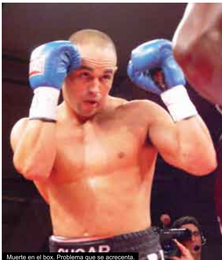
Muerte en el box. Problema que se acrecenta.

tales decesos, pues no todos los casos son iguales, tampoco la consistencia de cada peleador, ni la rapidez de como se trate el caso.