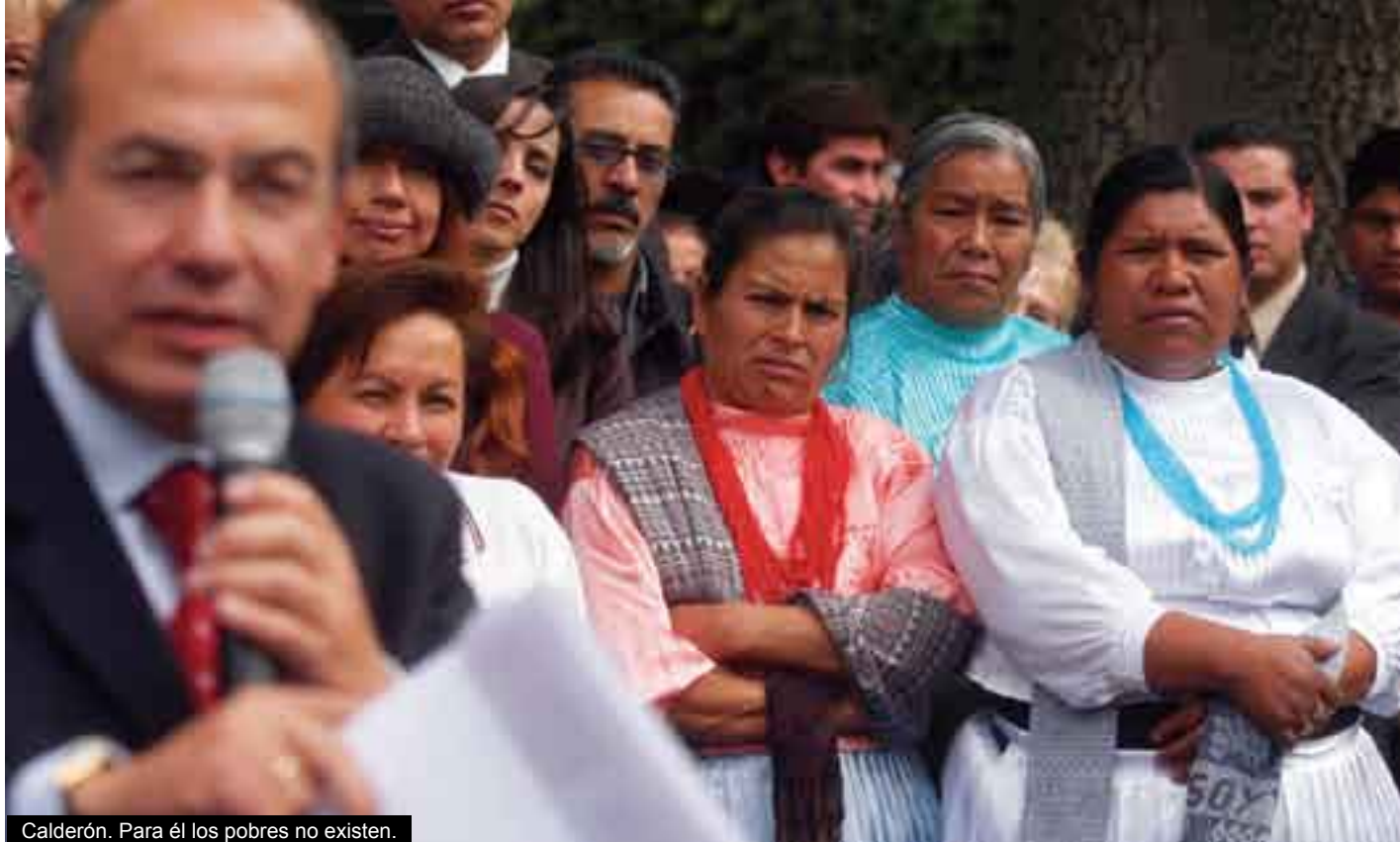
Calderón. Para él los pobres no existen.

la sociedad y que, por eso, el no acostumbra dividir a los mexicanos en ricos y pobres. Claramente se vio que esa fue su respuesta a la solicitud de los antorchistas.