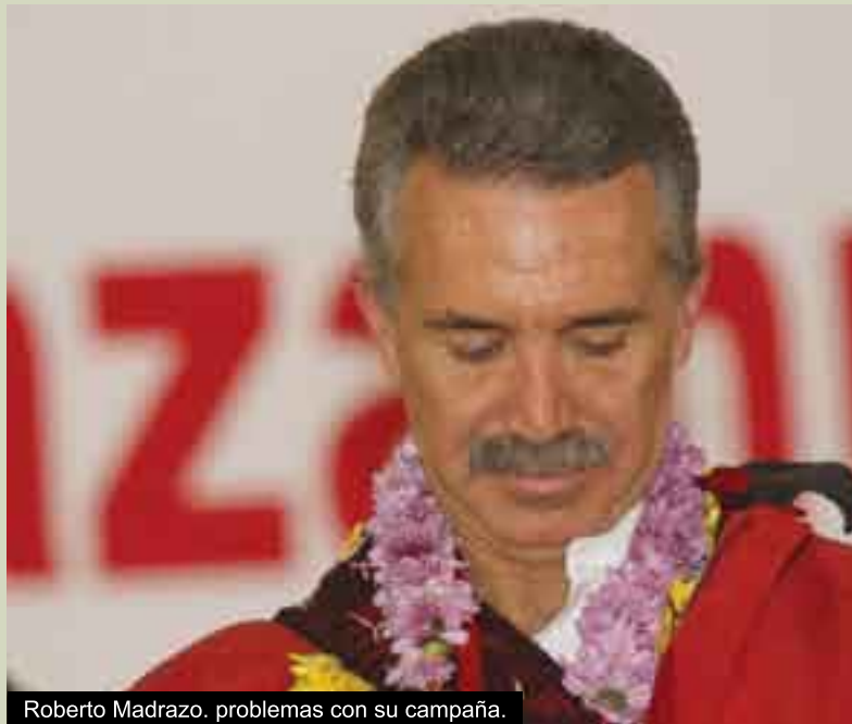
Roberto Madrazo. problemas con su campaña.

Especulan que Carlos Salinas esta “incomodo”, que la