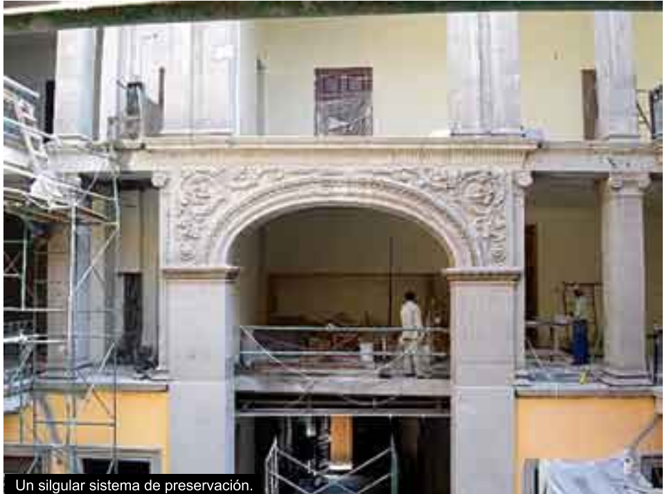
Un singular sistema de preservación.

La Casa del Marqués del Apartado ocupa una superficie de tres mil metros cuadrados y un área construida de 4,191 metros cuadrados; cuenta con dos niveles y más de 60 es-