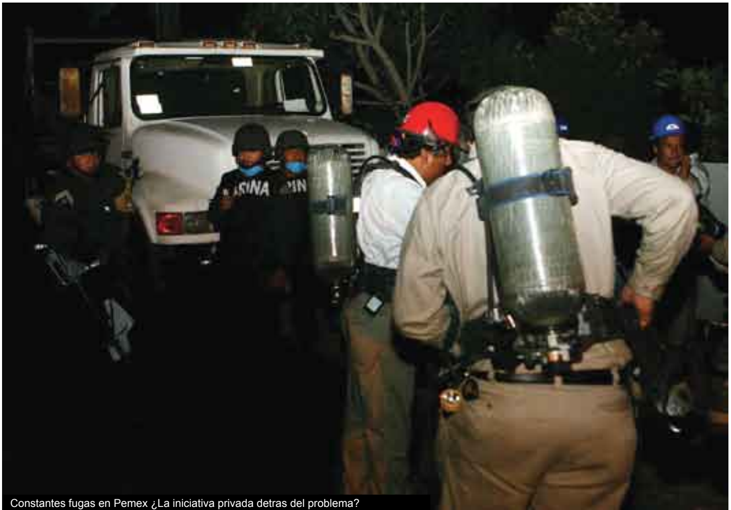
Constantes fugas en Pemex ¿La iniciativa privada detras del problema?