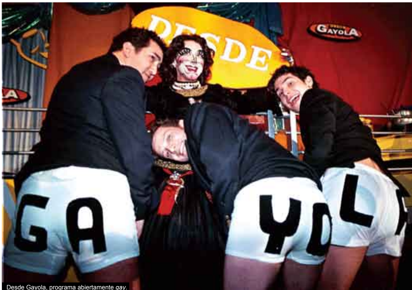
Desde Gayola, programa abiertamente gay.

Para algunos que contamos con la posibilidad de acceder a la televisión por contrato nos consta que han cundido infinidad de programas en los cuales aquellas cosas que antaño parecían “tabúes” son actualmente parte de la cultura mo-