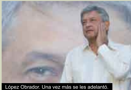
López Obrador. Una vez más se les adelantó.

En fin, apenas empieza esta guerra y ya habrá mucho que comentar. Por lo pronto, la primera batalla fue para Andrés Manuel López Obrador. A ver cómo terminan las siguientes. b