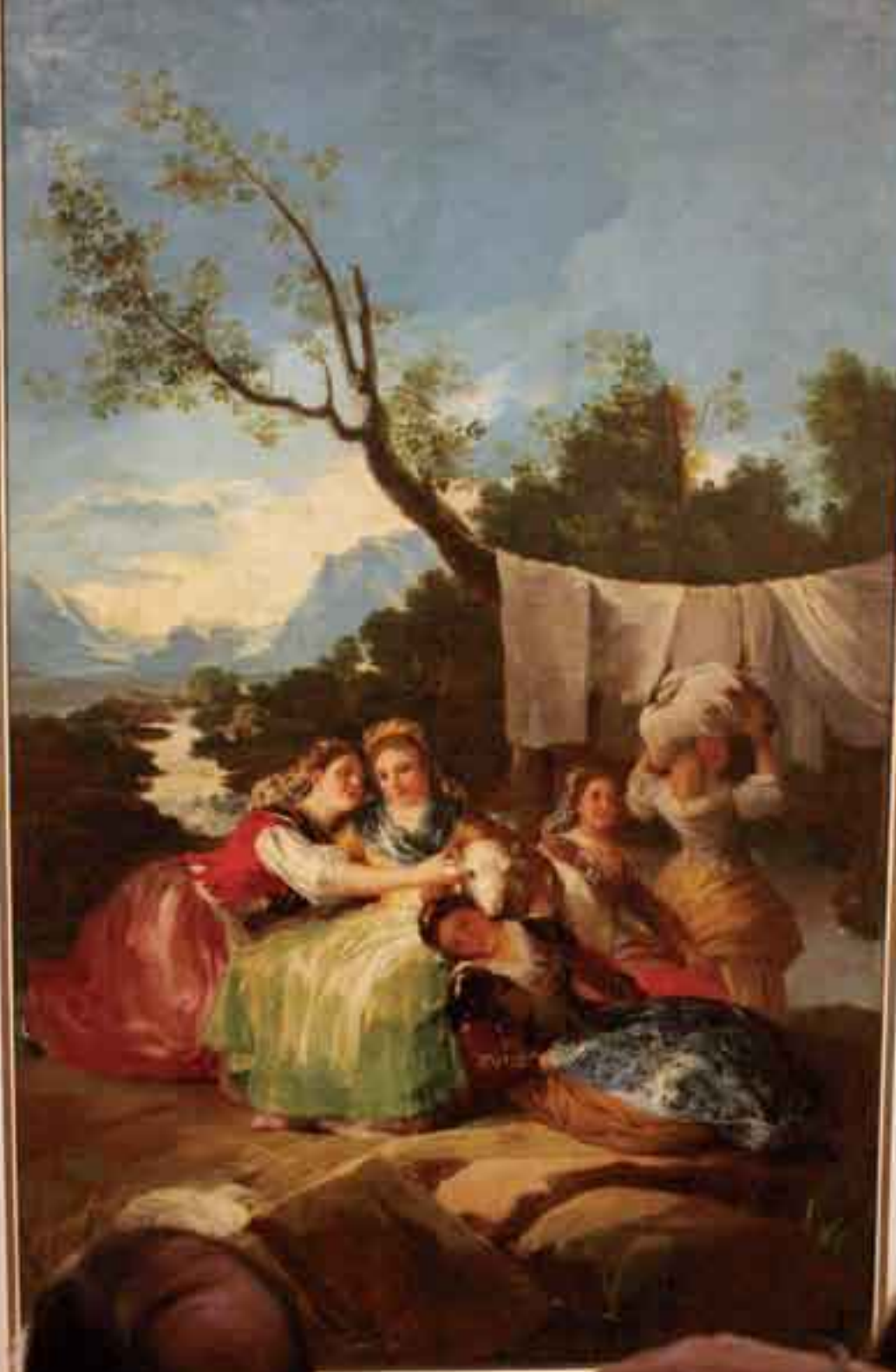
Il dipinto raffigura una scena di violenza domestica. Una donna in un abito verde è tenuta in braccio da un gruppo di persone. In primo piano, un uomo con un abito a strisce blu e bianche guarda verso il gruppo. Lo sfondo mostra un paesaggio con un fiume, alberi e montagne sotto un cielo nuvoloso.