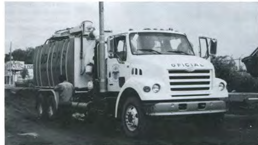
A LOS TRES DÍAS DE HABER TOMADO POSESIÓN DEL PODER MUNICIPAL, EL NUEVO AYUNTAMIENTO CONSIGUIÓ TRES AQUATECH QUE INMEDIATAMENTE INICIARON LOS TRABAJOS DE DESASOLVE

En segundo lugar, a ninguno de los muertos le resultó positiva la prueba de Harrison, lo que demuestra palmariamente que éstos no dispararon arma de fuego y que, por lo tanto, fueron masacrados a mansalva y sin más motivo que el de haberse encontrado presentes en el lugar de los hechos.