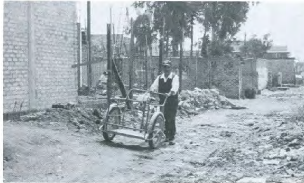
SE HAN ORGANIZADO JORNADAS DE LIMPIEZA DIARIAS, Y YA LE ESTÁN CAMBIANDO EL ROSTRO A CHIMALHUACÁN

armada, como un grupo de choque. Por tal motivo, puesto que las acusaciones que en ese sentido se le han hecho con anterioridad nunca han sido avaladas con pruebas fehacientes de ningún tipo, es decir, nunca han sido demostradas de modo irrefutable, es legítimo pensar, a la luz de los resultados actuales, que tales acusaciones anteriores son falsas, que se trató de imputaciones gratuitas que, como en el caso Chimalhuacán,