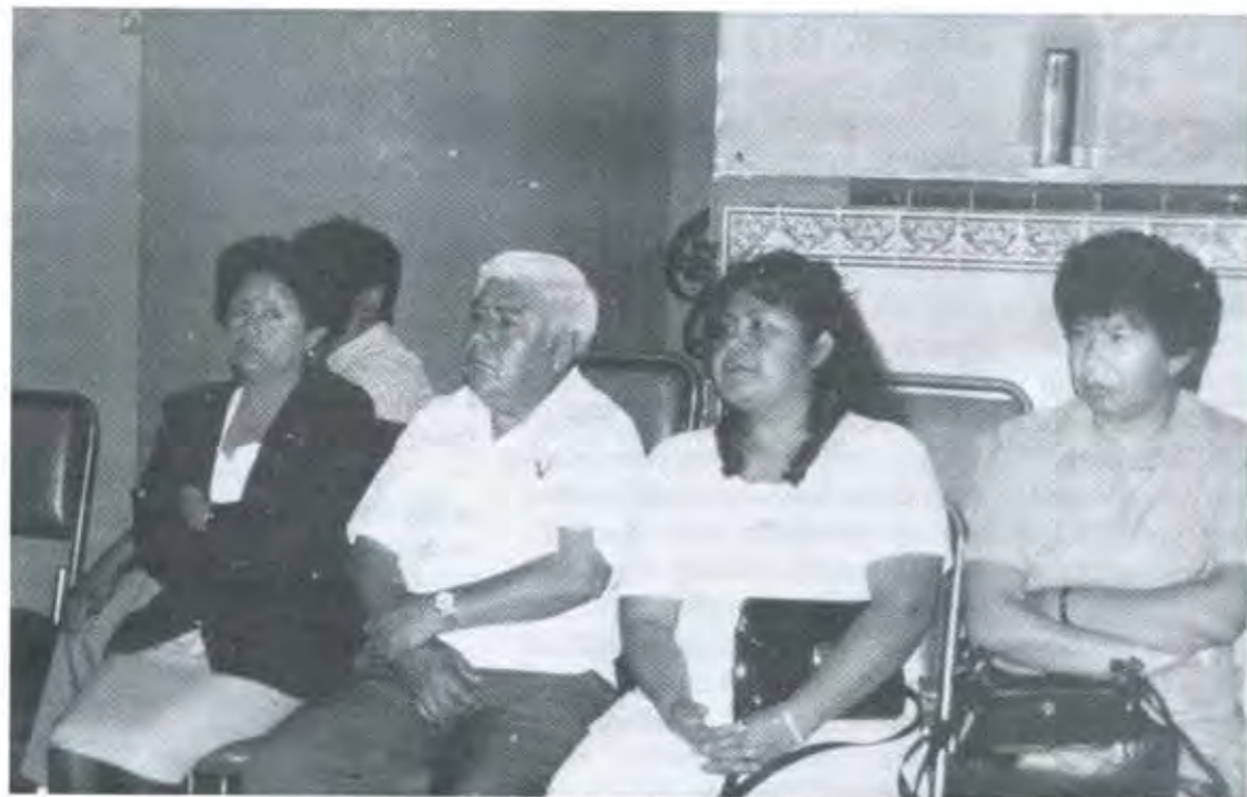
PERSONAL DISIDENTE DE LA TÉCNICA 3