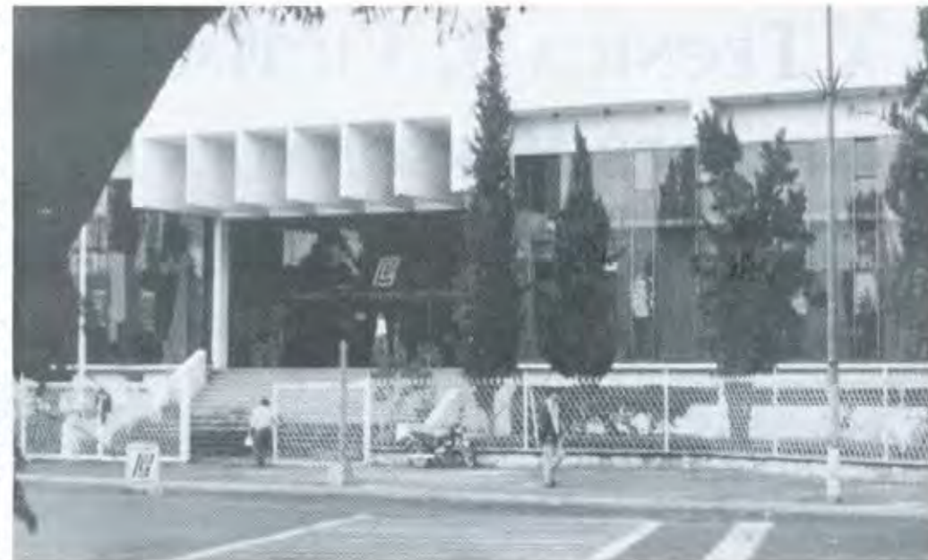
PROCURADURIA GENERAL DE JUSTICIA