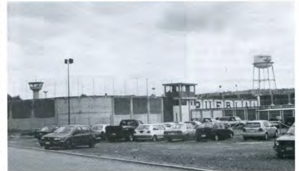
CENTRO DE READAPTACIÓN SOCIAL SAN MIGUEL