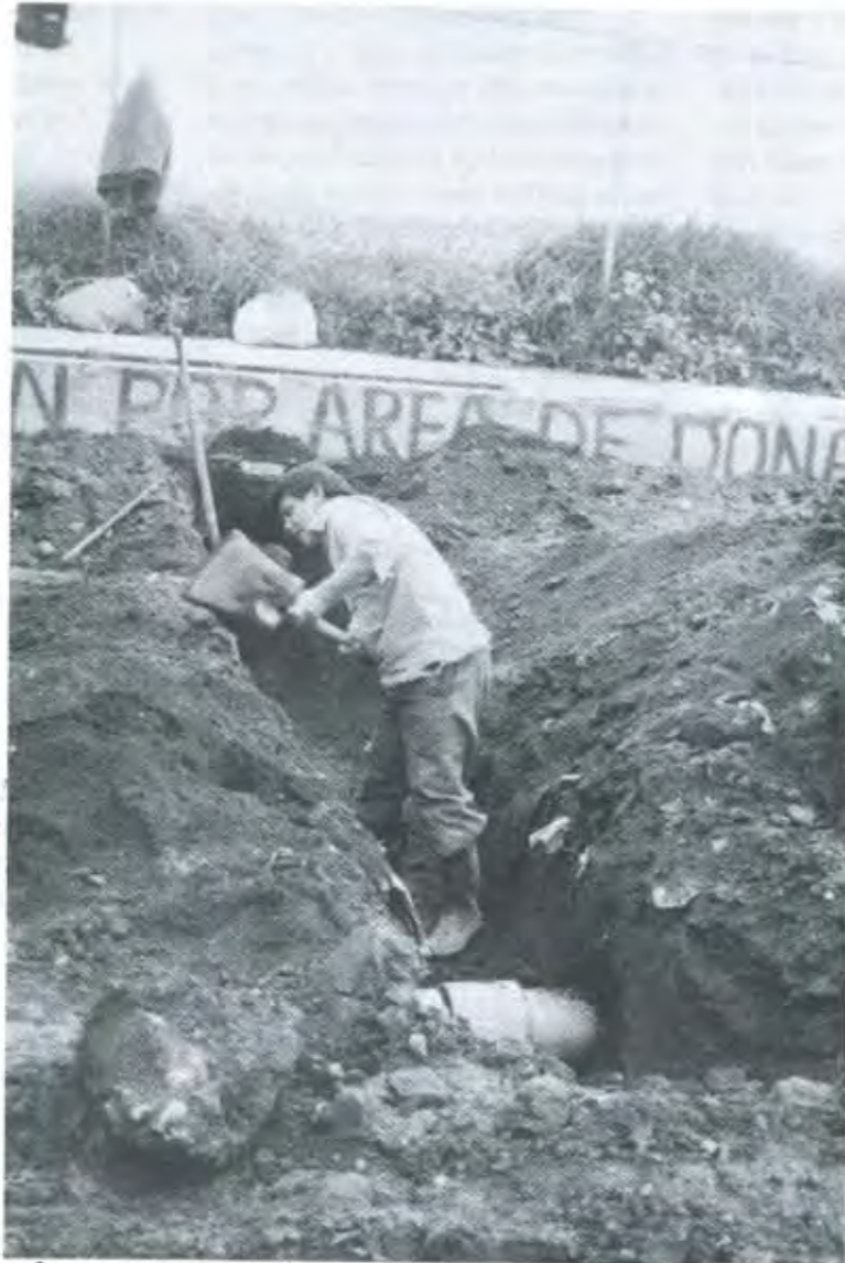
CHIMALHUACÁN COMIENZA A SER OTRO