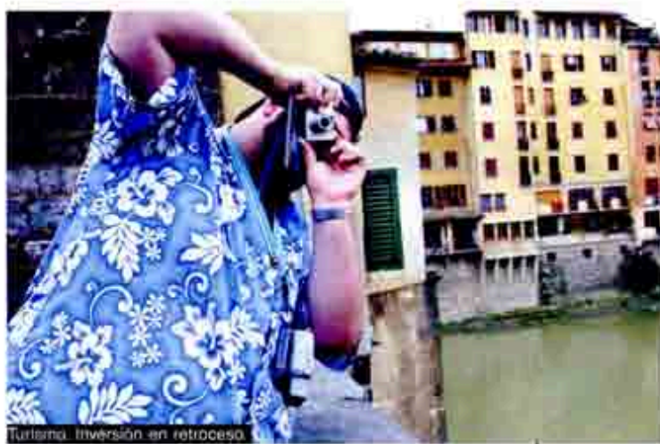
Turismo. Inversión en retroceso.

"Los resultados esperados para el cierre de este año son alentadores para todos. Las llegadas a hoteles de turistas nacionales estarán por arriba de los 50 millones; las inversiones serán altas, superando los 2 mil millones de dólares, predominando las de empresarios mexicanos; las divisas serán superiores a la meta que nos planteamos de 10 mil millones de dólares este año, gracias a que recibiremos más de 20 millones de turistas de todos los rincones del mundo", resume el gobierno federal.