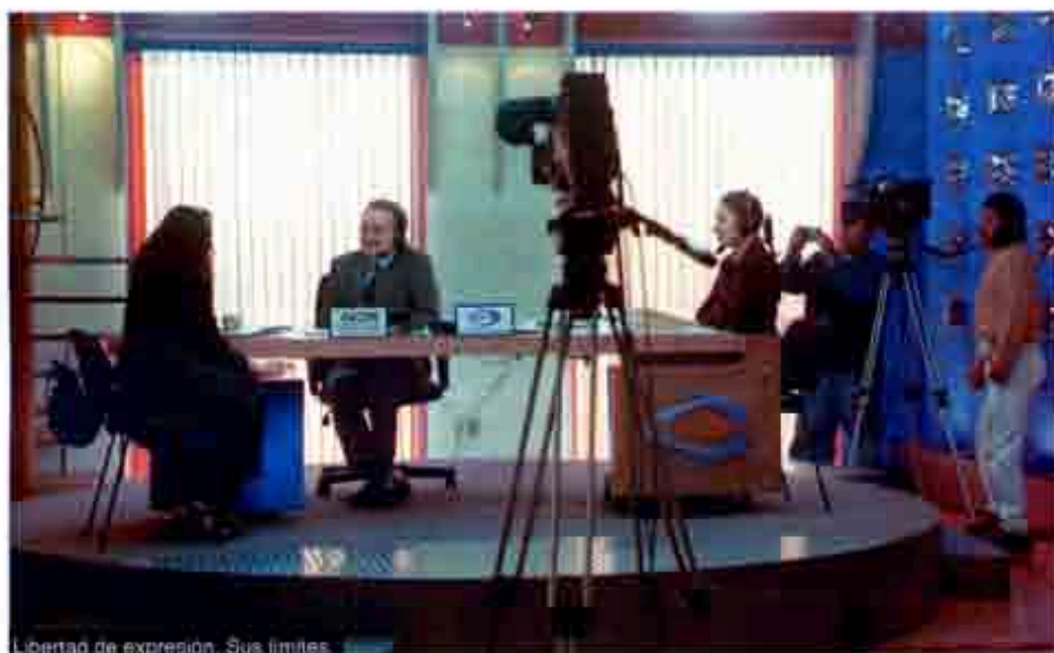
Libertad de expresión. Sus límites.