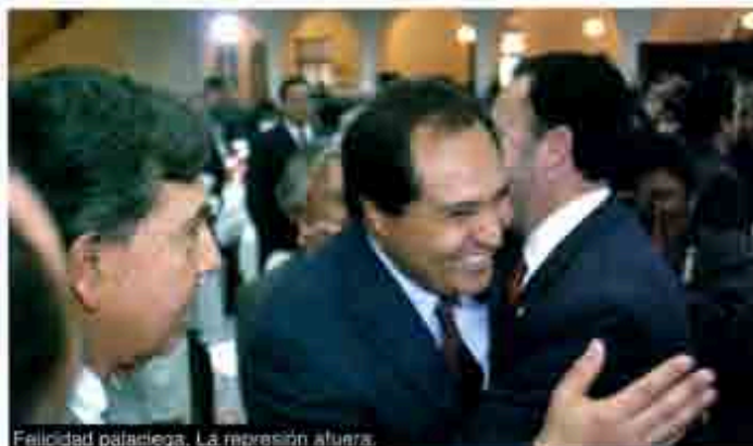
Felicidad pajalega. La represión afuera.

más sensibilidad, pero es al revés, a cada rato rompe las pláticas y sale con posturas arbitrarias que no son aceptables”, acotó.