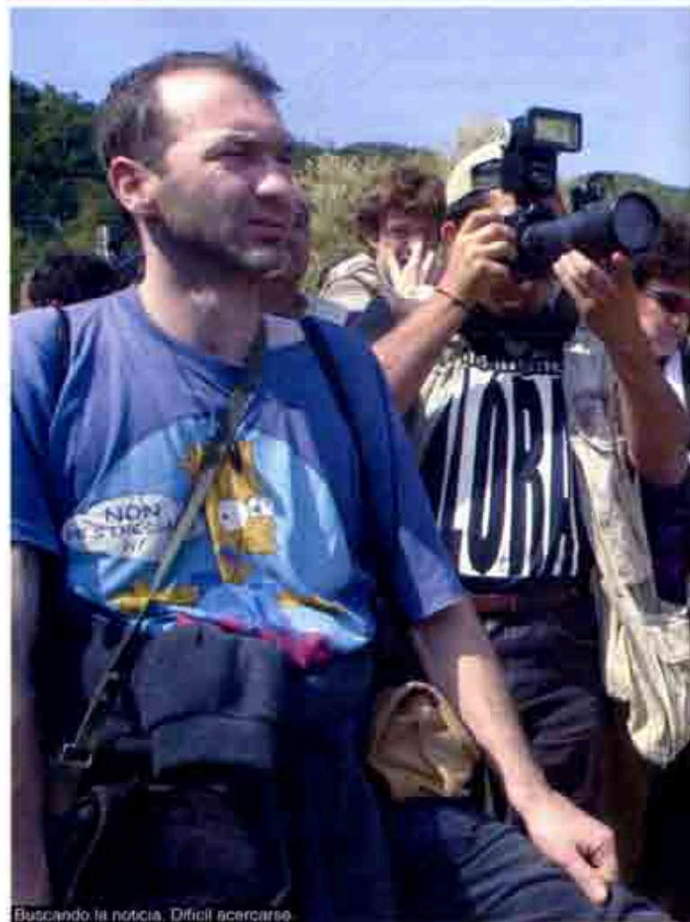
Buscando la noticia. Difícil acercarse.

- El reto principal de los medios de comunicación es brindar a la sociedad mayor y veraz información; la estructura actual de los mercados de medios de comunicación, que son distintos, obedece a diferentes razones históricas de las que han dado cuenta en el cuestionamiento. Ahora las cuestiones están cambiando