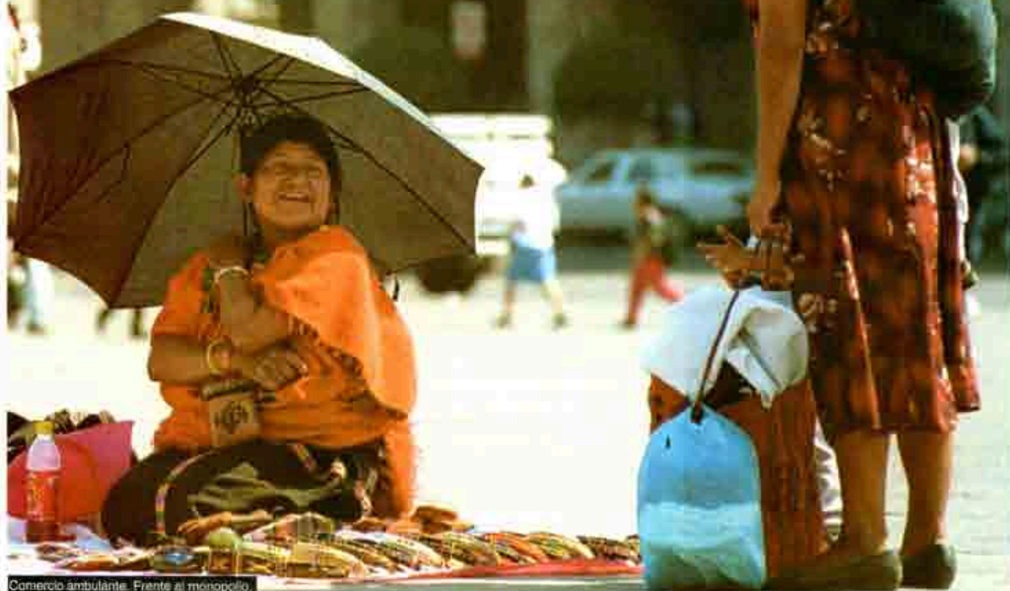
Comercio ambulante. Frente al monopolio.

La economía capitalista, al basarse en la anarquía en la producción, se condena a las crisis, pues los empresarios para vender el máximo posible producen mercancías en exceso, pero la demanda efectiva no crece junto con la oferta y llega un momento en que ésta es tanta que se satura el mercado, caen los precios, se detiene la producción, cierran las fábricas y se genera el desempleo, con lo que se completa un círculo vicioso, pues la desocupación reduce aún más la demanda. La solución clásica a esto ha sido destruir mercancías; por ejemplo, cuando el mercado internacional de café se satura y caen los precios, se destruyen millones de toneladas del grano para generar