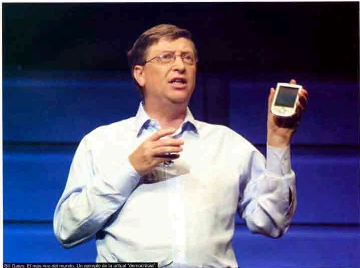
Bill Gates. El más rico del mundo. Un ejemplo de la actual "democracia".