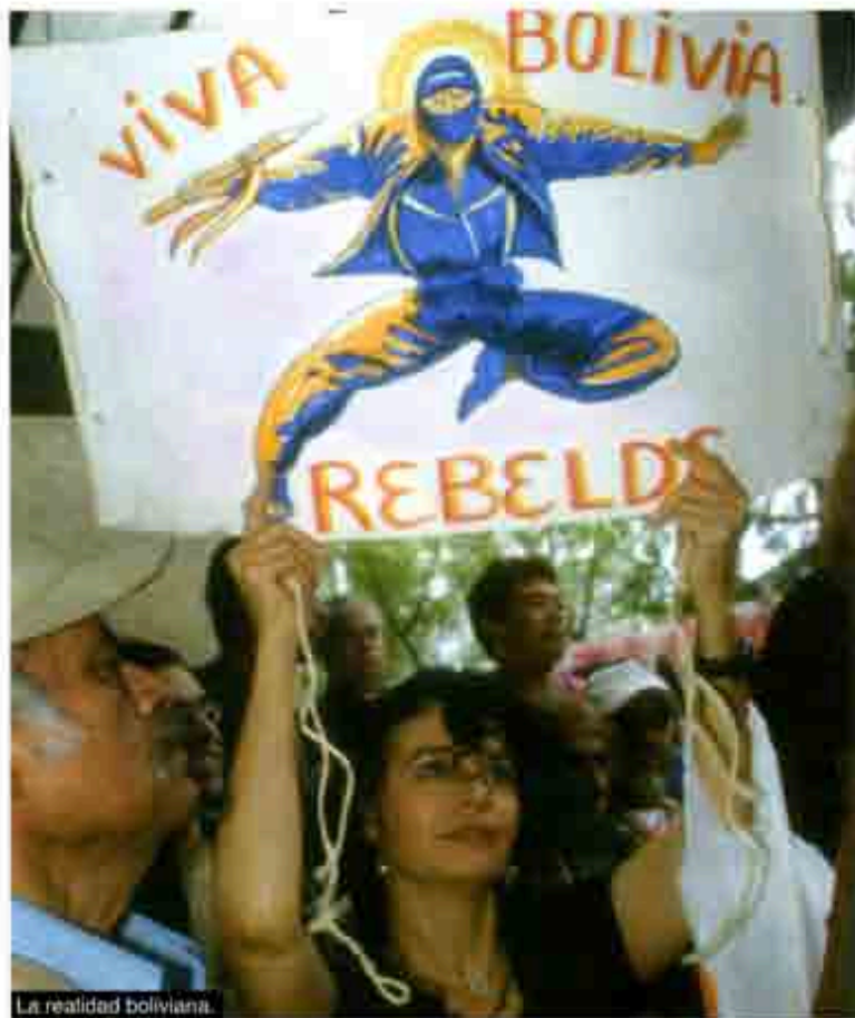
La realidad boliviana.

No se exagera mucho si se dice que en los últimos días, Bolivia ha estado paralizada. Paralizada en su vida normal, porque en lo que se refiere a la actividad política de las grandes masas empobrecidas han tenido inmensas movilizaciones que en nada se parecen a la paralización. Los más pobres de Bolivia, que son más de seis de los nueve millones de habitantes que tiene el país, han estado marchando, bloqueando carreteras y edificios públicos, exigiendo que se apruebe, finalmente, una ley que obligue a las poderosas empresas extranjeras que explotan su gas y su petróleo, a que paguen lo justo a la nación.