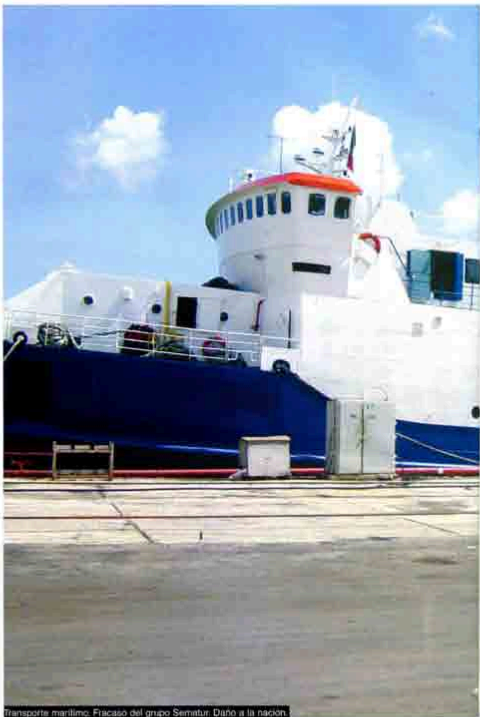
Transporte marítimo. Fracaso del grupo Sematur. Daño a la nación.

A partir de 1963 y hasta 1979, el Gobierno Federal administró la flota de cabotaje más impresionante del siglo