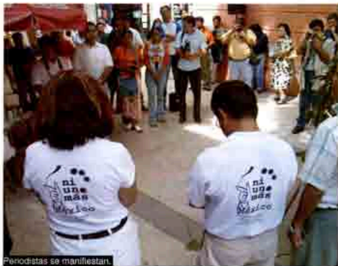
Periodistas se manifiestan.