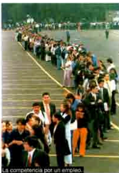
La competencia por un empleo.

Entre los factores que han permitido a los países avanzados manejar las crisis, está, en primer lugar, la evolución de la estructura productiva y de mercado, que