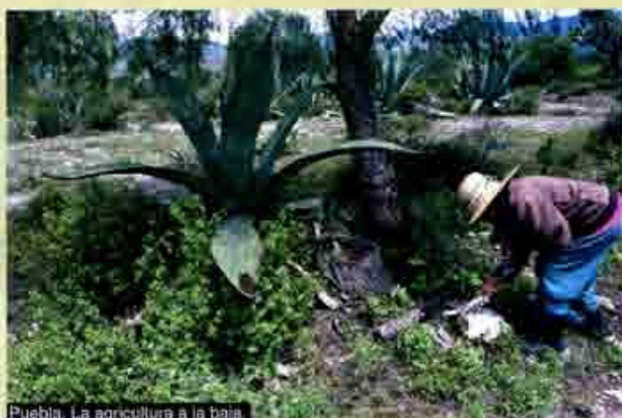
Puebla. La agricultura a la baja.

6) Mantener el acompañamiento profesional a la población