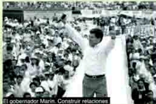
El gobernador Marín. Construir relaciones

Pero, demandó también, que haya objetividad en las informaciones. Crítica basada en hechos y no en suposiciones o rumores y ofreció atender las críticas a su gobierno y a sus funcionarios, cuando éstas sean serias y de buena fe.