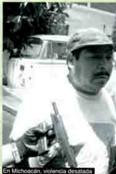
En Michoacán, violencia desatada