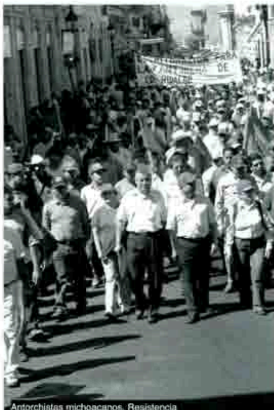
Antorchistas michoacanos. Resistencia

Paralelamente a esto, se ha gastado una millonada en una feroz guerra de desinformación, trastocando a su antojo los términos del conflicto, mintiendo descaradamente respecto a la actitud que han asumido las partes en el mismo y llenando de lodo y calumnias a los dirigentes locales y nacionales de Antorcha Campesina. La constante en dicha campaña ha sido la de afirmar que todos los problemas están resueltos, y que si los “antorchos” persisten en su movimiento, es porque sirven a ocultos y bastardos intereses políticos. De paso diremos, por eso, que tal afirmación es absolutamente falsa y sólo destinada a arrojar tierra a los ojos de la opinión pública. Nada, absolutamente nada, se ha