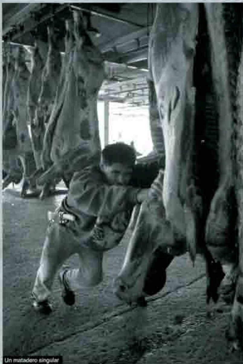
Un matadero singular

En torno a la ingesta de carne de caballo, existe una versión favorable por el aporte nutricional, principalmente de hierro, pero, por otro lado, se argumenta que la carne de caballo permite al desarrollo de la triquinosis en el consumidor.