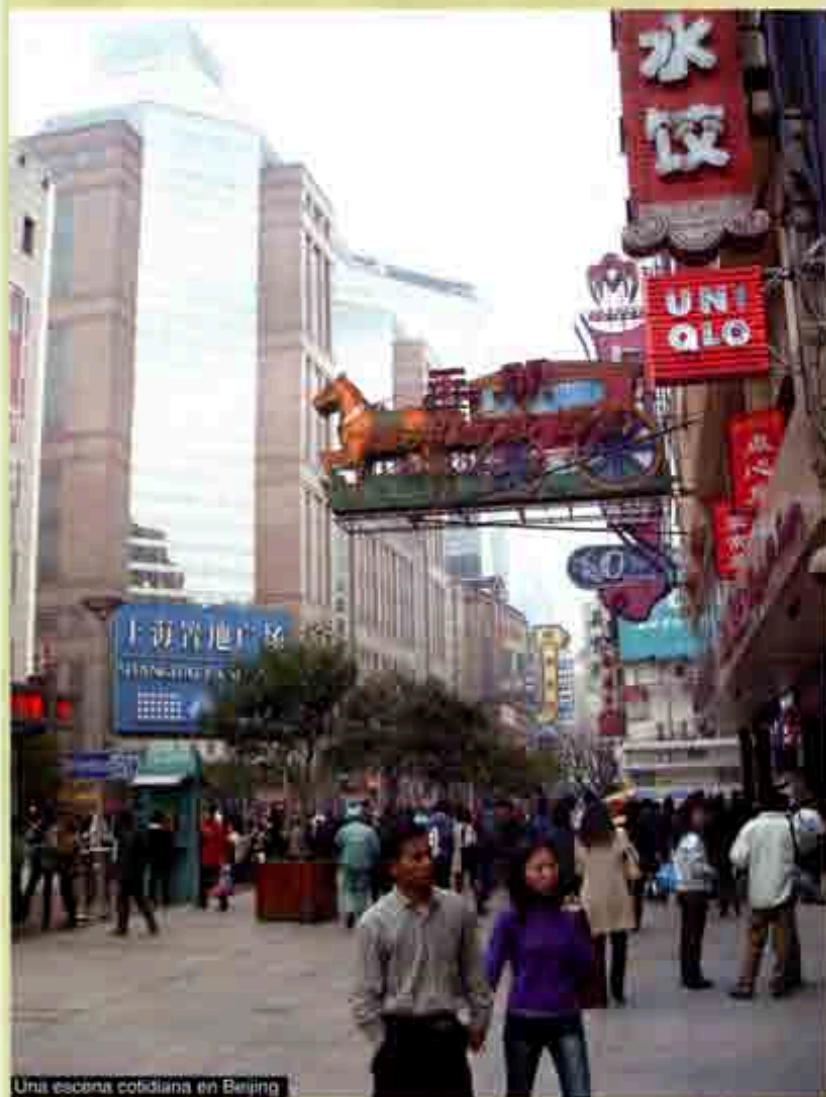
Una escena cotidiana en Beijing

E l formidable crecimiento de la economía china, que dura ya más de dos décadas, causa admiración entre analistas económicos, que destacan, sobre todo, el crecimiento en el PIB, su liderazgo en la atracción de inversión extranjera y su creciente presencia en los mercados internacionales. Muchos subrayan como factor clave en la