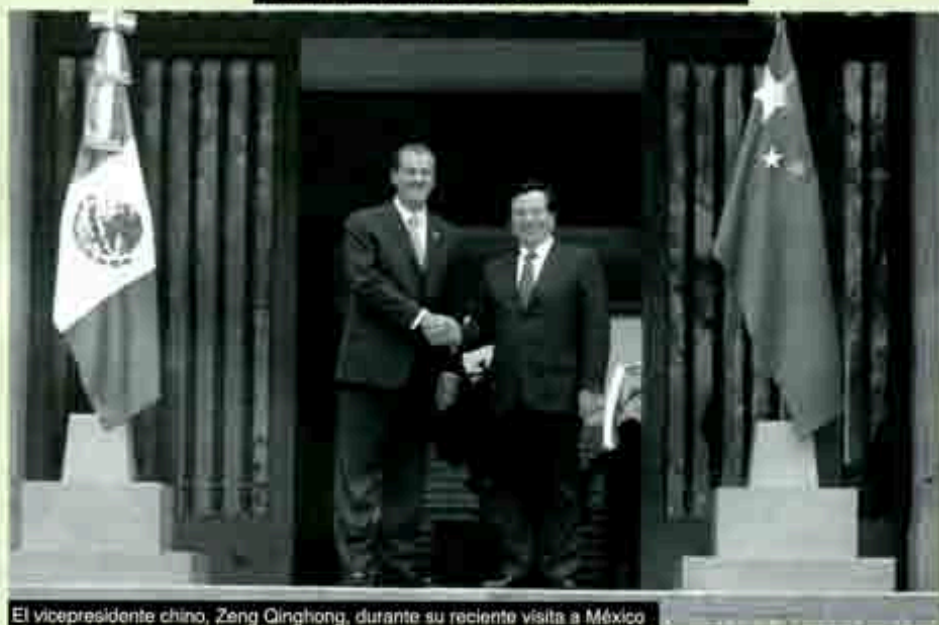
El vicepresidente chino, Zeng Qinghong, durante su reciente visita a México