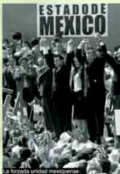
La forzada unidad mexiquense

Partido del Trabajo sí llegarán efectivamente a constituir una coalición, que bien podrá preocupar a panistas y priístas por igual, toda vez que se considera que esa coalición de las fuerzas de izquierda, impulsadas por el efecto LÓPEZ OBRADOR, seguramente será, en el Estado de México, el verdadero fiel de la balanza, que si bien difícilmente resultaría triunfadora, tendrá la característica de captar los numerosos votos de los inconformes y desilusionados de los dos partidos mayores y, además, muchos del sector femenino que ven en la llamada INNOMBRABLE (por aquello de que no se sabe cual es su nombre), YEIDCKOL POLEVNSKY. Esperemos. Esto apenas empieza. ☛