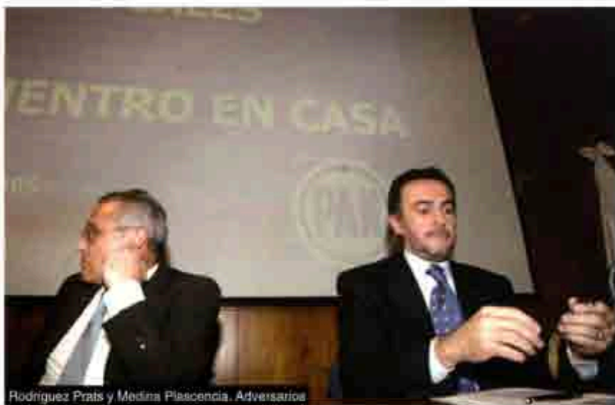
Rodríguez Prats y Medina Plascencia, Adversarios

Secretario de Gobernación, y quien cuenta, pese a todo, con el apoyo del presidente Vicente Fox en sus aspiraciones para el 2006.