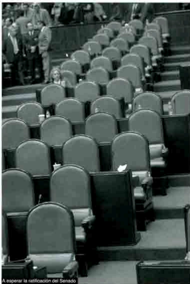
A esperar la ratificación del Senado

Otra aseveración es que, políticamente, la transición democrática mexicana -ahora llevada por el foxismo-, quedaría incompleta si los millones de ciudadanos mexicanos en el exterior no tienen voz en la elección de su país de origen; y, finalmente, no se identifican condiciones internacionales que puedan impedir el voto en el extranjero. B