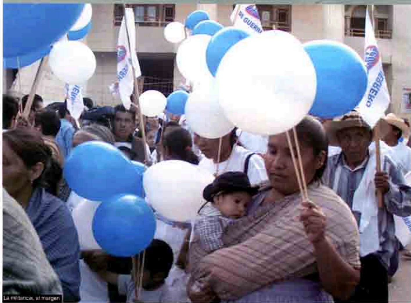
La militancia, al margen

Conforme se acerca la elección Presidencial del 2006, los partidos políticos enfrentan embestidas internas que llevan a la reconfiguración de sus estructuras de poder y Acción Nacional no es la excepción. La purga del contrincante y el posicionamiento de quien cuentan con "la bendición" Presidencial para ser el candidato oficial a la Primera Magistratura es lo que distingue en estos momentos al partido en el poder, el mismo que a escasos cinco años de estar en Los Pinos, muestra la rápida descomposición que significa tener el mando de una nación.