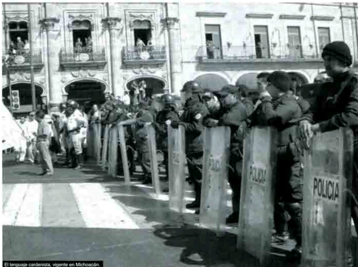
El lenguaje cardenista, vigente en Michoacán.

Más de un año lleva ya el conflicto entre el gobierno de Michoacán, que encabeza el perredista Lázaro Cárdenas Batel, y el Movimiento Antorchista de aquel estado que dirige el biólogo Jesús Valencia Mercado. Si se tiene en mente sólo la naturaleza de las demandas que los militantes del mencionado movimiento le tienen planteadas a la administración cardenista, la inusual prolongación de su movimiento parece, literalmente, un absurdo. En efecto ¿Qué piden los antorchistas a Cárdenas Batel? Lo de siempre, lo que piden a todos los gobernadores