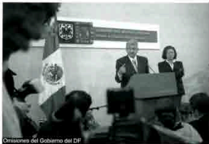
Omnisiones del Gobierno del DF

En cuanto a los locales comerciales, podemos decir que existen 800. Actualmente los administra una empresa denominada SARE. Las rentas pueden ir de 2 mil a 10 mil pesos, dependiendo del lugar y tamaño del establecimiento. Por ejemplo, un local de aproximadamente 2 x 8 metros en el Zócalo paga unos 10 mil pesos de renta mensual y un local de 1 x 2 metros, en la estación Gómez Farías, cobra