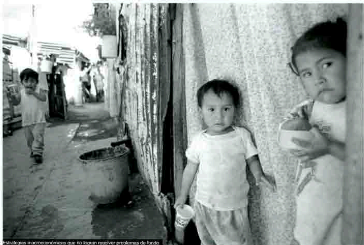
Estrategias macroeconómicas que no logran resolver problemas de fondo

E l Banco de México incrementó el “corto” monetario, en nueve ocasiones, el año que pasó, con el propósito -así se dijo- de controlar la inflación. Hacer uso, en tantas ocasiones, de una política antinflacionaria como ésta revela que se le considera eficaz y que, por tanto, los beneficios que se obtienen de ella sugieren ser superiores que los costos de su instrumentación. No obstante, los indicadores económicos y, sobre todo, el hecho de que la pobreza en México haya crecido, parecen desmentir que el “corto” ofrezca puras bondades. Por tal motivo, trataremos de explicar en qué consiste esta política monetaria, cuáles son sus consecuencias y cuáles sus resultados en México.