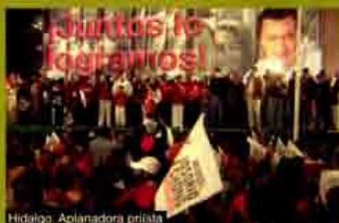
Hidalgo: Aplanadora priísta

Se llevó a cabo la 55 edición del Festival Internacional de Cine de Berlín y aunque se caracterizó por la escasa presencia del cine hispano, el cine en español no fue con las manos vacías, pues la película del mexicano Luis Mandoki, Voces Inocentes , ganó el Oso de Cristal como Mejor Película del Festival de Cine Infantil y Juvenil. Este galardón puede dar pie para que ese filme, el cual trata sobre la guerrilla de Salvador, sea proyectado en el continente europeo.