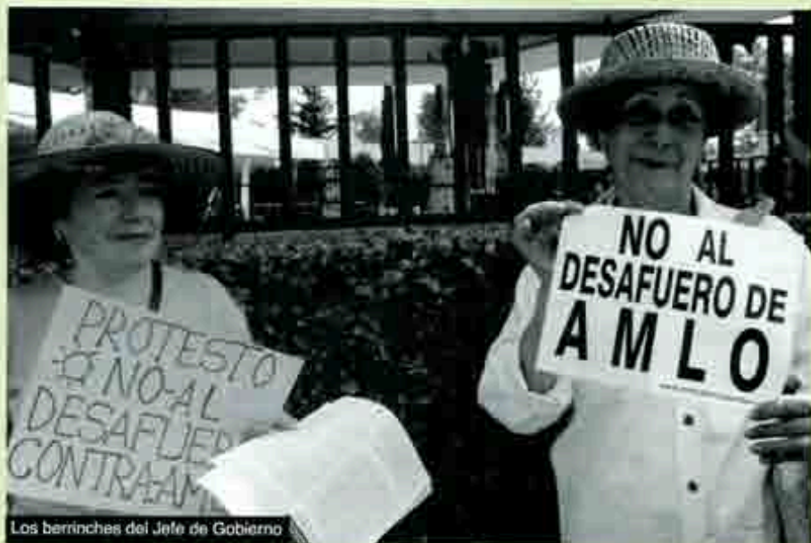
Los berrinches del Jefe de Gobierno

Aparte están las paradojas en la estrategia de defensa. Durante varios meses, López Obrador señaló que no se ampararía, que no buscaría la protección de la justicia y que retaba a sus adversarios a que procedieran en su contra para entonces hacer campaña desde prisión. Sin embargo, conforme los tiempos se acortaron y quedó claro que amagar con presentarse como mártir no sería suficiente para detener el proceso legal que se niega en su contra, Andrés Manuel