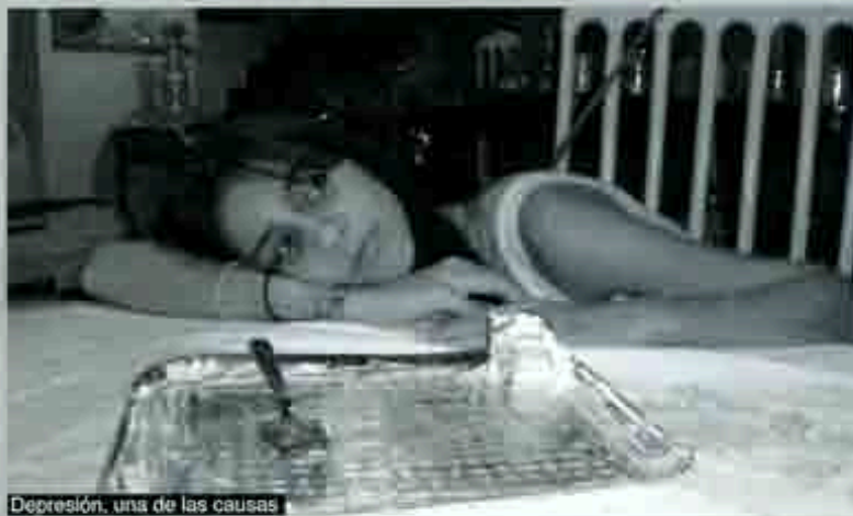
Depresión, una de las causas

que hayan cometido un acto de esta naturaleza.