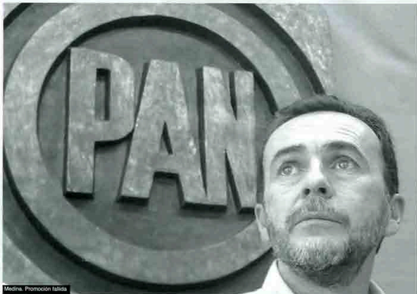
Medina. Promoción fallida

E n el momento más crítico de su historia como instituto político, por cuanto representa el cuestionado saldo que ha entregado, con Vicente Fox como Presidente de México, Acción Nacional enfrenta una suerte de definición en su nuevo liderazgo político con cuatro aspirantes que pretenden ser la cabeza del Comité Ejecutivo Nacional, mismos que recorren el país en búsqueda del apoyo de los 384 consejeros nacionales que, en definitiva, decidirán este cinco de marzo a aquel que, a su juicio, será el idóneo.