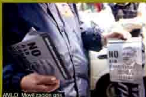
AMLO: Movilización gris