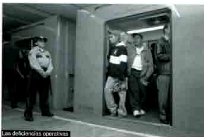
Las deficiencias operativas

Hay denuncias por parte del personal que labora en las áreas administrativas, de la desviación de recursos por 173 millones y 843 mil pesos en el 2003, dinero que se usó para la construcción de los segundos pisos que tanto ha publicitado la administración de López Obrador; culpan al GDF de la falta de recursos para el mantenimiento de las 11 líneas del Metro. Lo responsabilizan por los accidentes que puedan ocurrir por el pésimo estado de las instalaciones y