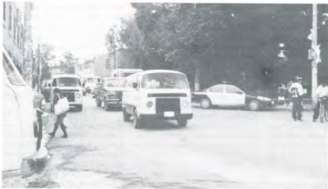
VOLVIÓ LA TRANQUILIDAD A CHIMALHUACÁN

compra-venta, y tuviéramos nuestro predial.