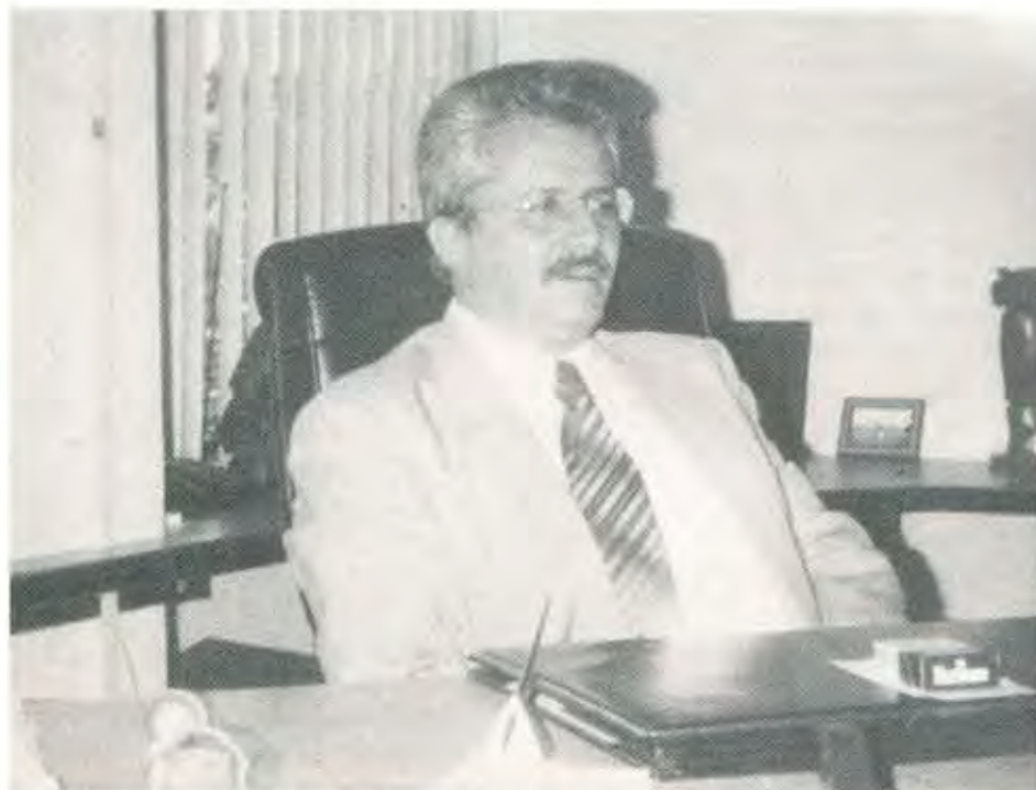
FRANCISCO JAVIER DE LA FUENTE LINARES, SUBSECRETARIO DE TRANSPORTE

P uebla, la cuarta ciudad de la República, ha experimentado en los últimos 20 años, un explosivo crecimiento demográfico y económico. Sin embargo, tiene en su sector transporte el más atrasado y caro del país. Los compromisos institucionales han quedado sólo en eso.