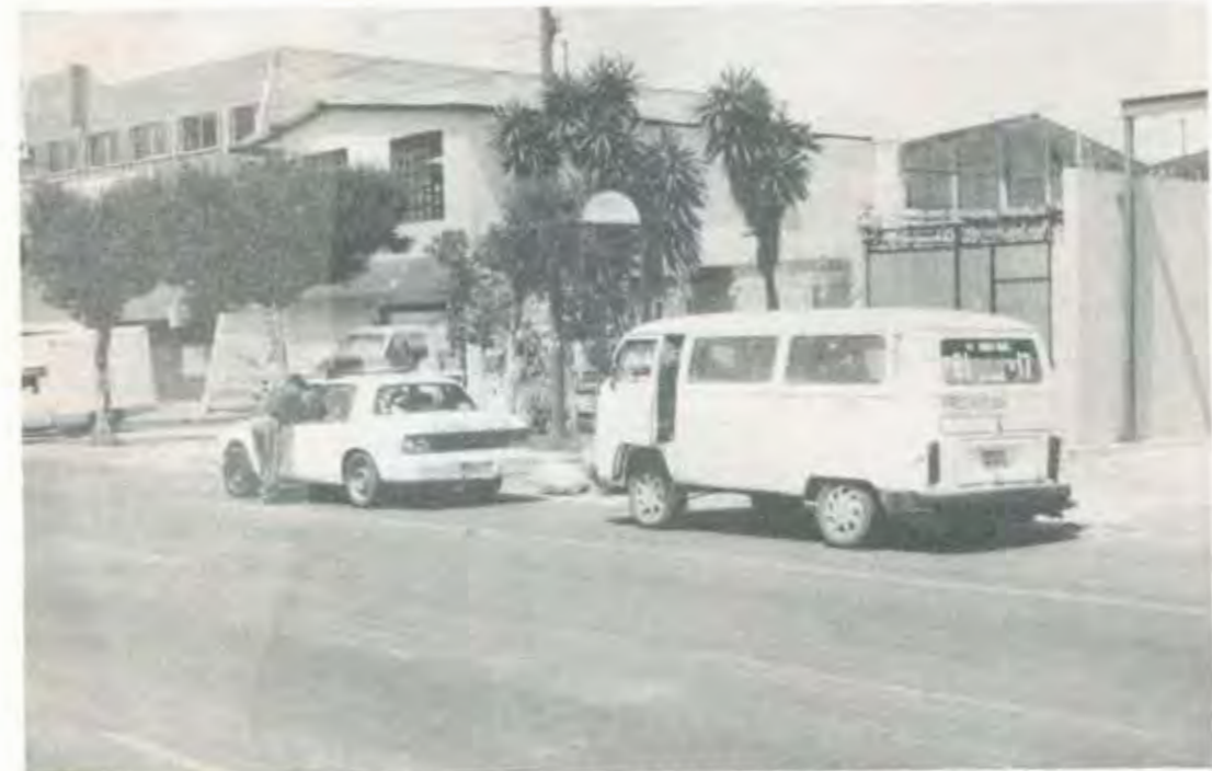
ELEMENTOS DEL VEHÍCULO A1-59 PERTENECIENTE A LA SCT HACIENDO USO DE LA CLÁSICA "MORDIDA"