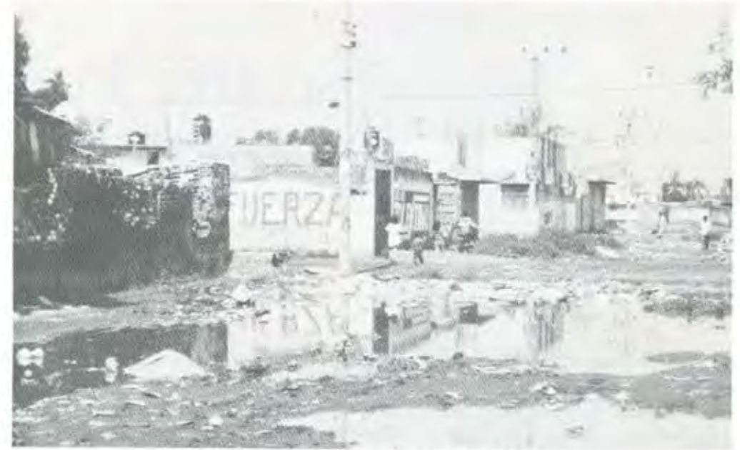
CON TOLENTINO, CHIMALHUACÁN VA A SER OTRO

También en el centro de Chimalhuacán había calma. Niños recién salidos de la escuela caminaban por las calles sin más preocupación que la de sus tareas escolares, los vendedores ambulantes ofrecían sus mercancías, a los policías asignados a la