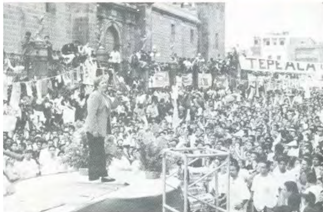
LA GENTE, CON JUSTA RAZÓN, YA NO ESTUVO DISPUESTA A PERDONAR AL PRI Y VOTÓ EN SU CONTRA

hacia los pobres y sus demandas más elementales, la corrupción que como un cáncer corroía y corroe a todo el cuerpo social, la utilización de las masas como carne de mitin y de urna sin ningún respeto ni provecho tangible para ellas, la mentira y el "manejo" como armas para burlar sus esperanzas de solución, la antidemocracia hacia el interior del partido que se traducía y se traduce en ninguna participación real de las bases en la toma de decisiones, en la total carencia de instancias en donde hacerse oír y quejar-