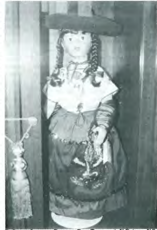
EL SECTOR INFORMAL REQUIERE POCOS TECNOLOGÍA Y CRÉDITO, Y SUS COSTOS FINANCIEROS SON REDUCIDOS

Finalmente en lo que se refiere a la naturaleza del sector, mucho se ha discutido sobre su relación con el formal. Hay quienes lo conciben como un apéndice o socio menor de este último, dados los servicios que le presta y su interdependencia; por ejemplo, abasteciendo a la industria de servicios e insumos reciclables baratos como vidrio, plástico, cartón y metales, ello mediante el empleo de fuerza laboral sin prestaciones, contratos formales ni protección sindical. El sector informal es visto como una prolongación de la empresa y cuyo propósito es la obtención de utilidades. Hay quienes en