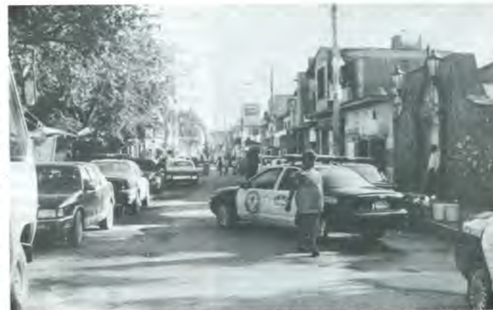
LOS LAMENTABLES ACONTECIMIENTOS DE CHIMALHUACÁN OCUPARON LAS PRIMERAS PLANAS Y LAS OCHO COLUMNAS DE LOS PERIÓDICOS

El sábado 19 de agosto, los diarios de importancia nacional le dedicaron las primeras planas y las ocho