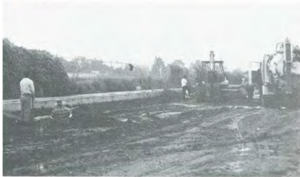
DE INMEDIATO REINICIARON LAS OBRAS