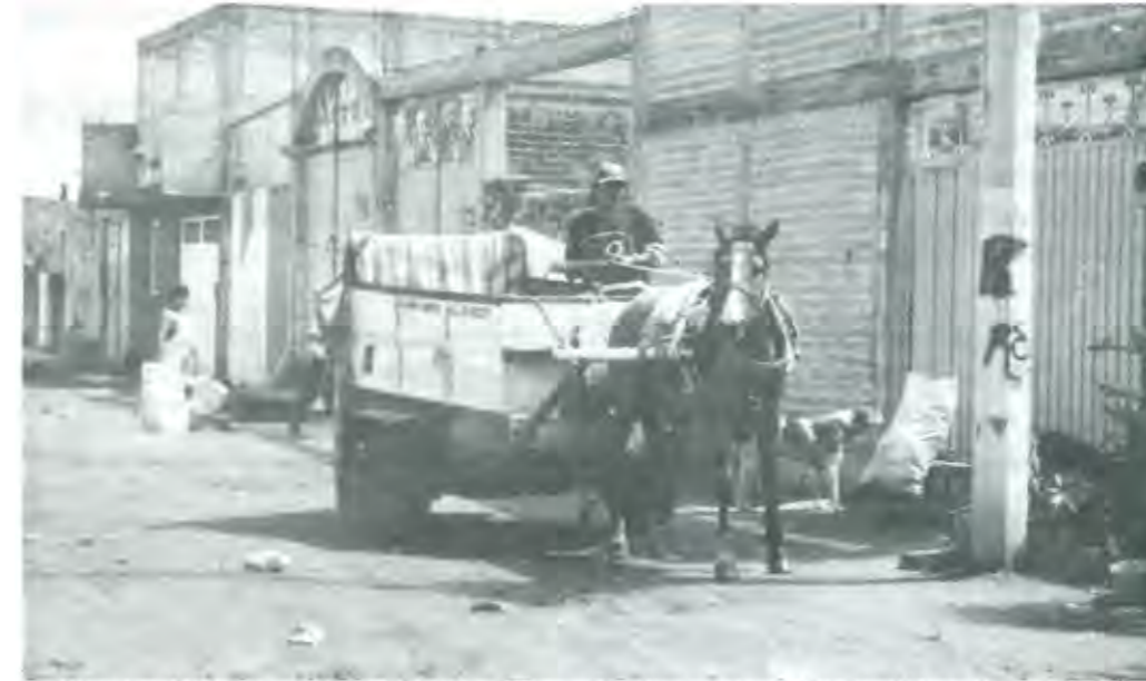
PASEANDO EN DIVOCLETA POR LAS CALLES ETÉREAS DE ESTA ANGÉLICA CIUDAD. ¡CHOC, CHOC, CHOC...!