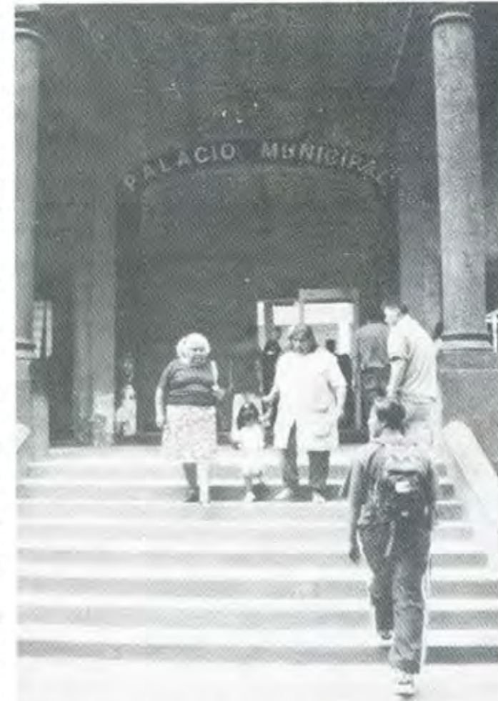
EN CHIMALHUACÁN NO HAY CLIMA DE INSEGURIDAD, Y EL AYUNTAMIENTO ESTÁ TRABAJANDO

Los señores que dicen que en Puebla puede pasar algo parecido a lo