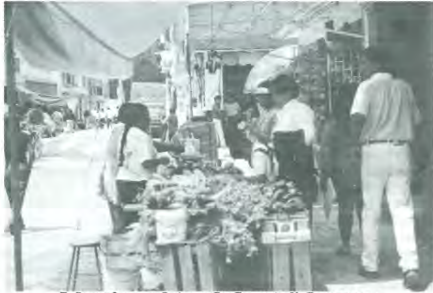
EL SECTOR INFORMAL SE ASOCIA CON ECONOMÍAS NO DESARROLLADAS

Recientemente se viene insistiendo en "formalizar" el sector informal, imponiéndole una carga fiscal. No creo que sea esto cosa de un simple decreto. Existen raíces estructurales profundas que no permiten una solución fácil. Pero veamos qué es el sector informal. Este comprende el conjunto de actividades no registradas en las cuentas del ingreso nacional y que no contribuyen con el fisco, un conglomerado heterogéneo que abarca, entre otros, desde verdaderos negocios, hasta simples "tendidos" de mercancías, a veces usadas, alimentos pobremente preparados, transporte irregular de pasajeros y recolección de basura. Algunos son casi empresas, otros lindan con la mendicidad o se relacionan con actividades delictivas. Se caracterizan por su pequeña escala y su propósito fundamental es generar empleo familiar, por lo que sólo limitadamente se contrata asalariados. Poseen una muy elemental organización y división del trabajo y no hay acceso a seguridad social. Como definición, INEGI usa el concepto de informalidad aprobado por la Organización Internacional del Trabajo (OIT), restringido a las actividades irregulares y que excluye las ilegales como piratería y narcotráfico; éstas se agrupan bajo el concepto de economía subterránea. En los países industrializados esta última denominación engloba a actividades ilegales e irregulares.