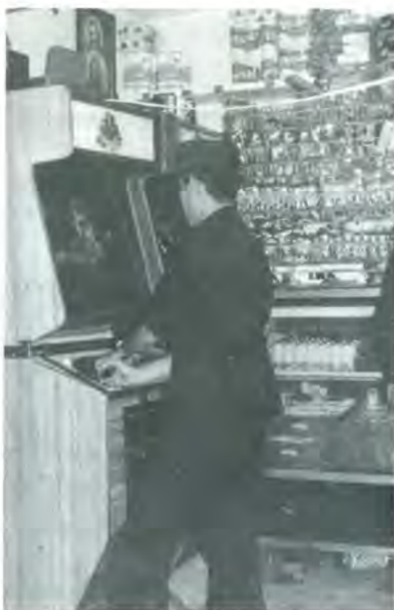
POCO A POCO, LA VIDA DE CHIMALHUACÁN VUELVE A LA NORMALIDAD. HASTA LOS POLICÍAS QUE RESGUARDAN LA PAZ PÚBLICA, SE DAN "TIEMPO LIBRE"

plantar, si se hace costumbre, a los tribunales creados ex profeso para impartir justicia. Sin embargo, se puede opinar y emitir juicios si se analizan con imparcialidad y objetividad los hechos que se nos presentan.