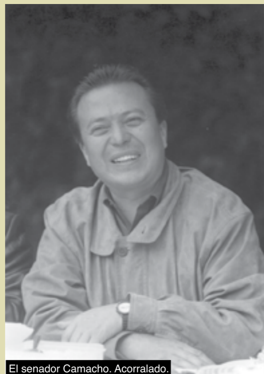
El senador Camacho. Acorralado.

Al cierre de esta edición, se preparaba la sesión en la Cámara alta para ventilar el asunto, y prometía ser aún más colorida y riesgosa que la de la Cámara de Diputados. Desde ya, los legisladores exigían una valla de la Policía Federal Preventiva (PFP), para evitar ser mazapanados por los manifestantes a su llegada a la vetusta casona de Xicoténcatl. ■