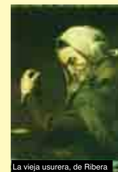
La vieja usurera, de Ribera

Así les he platicado algo que más adelante verán que será de suma utilidad, para aquel que quiere hacer arte y no sabe cómo empezar. ■