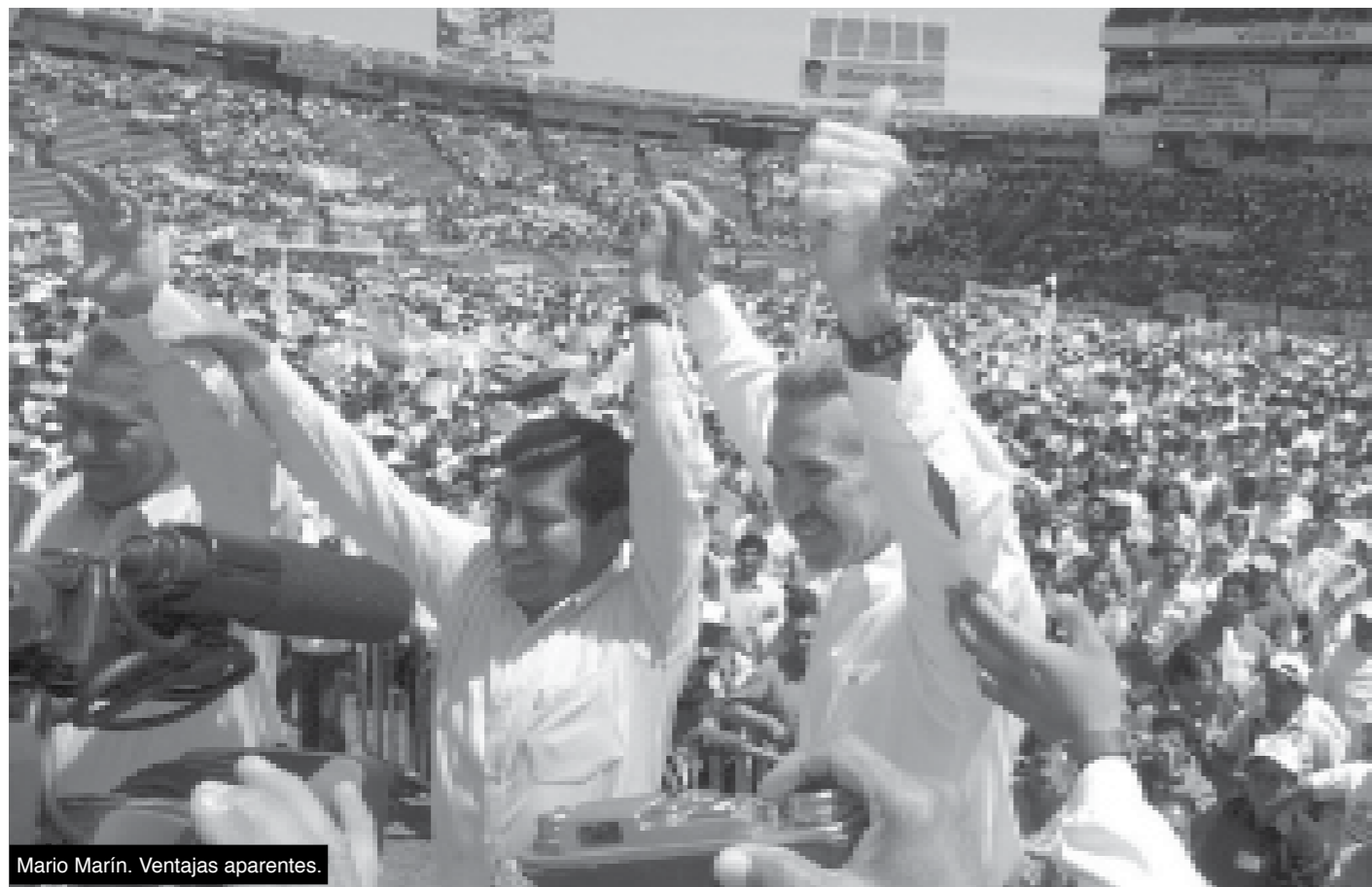
Mario Marín. Ventajas aparentes.

Las elecciones que se avecinan para Puebla significan, para la sociedad y el propio sistema de partidos, un reacomodo de las fuerzas que actualmente ejercen el poder en el estado: el Partido Acción Nacional, que gobierna la capital del estado -y a sus dos millones de habitantes- así como algunas de las ciudades más pobladas de la entidad, entre las que destacan Huauchinango, Atlixco y Acatlán de Osorio; y el Partido Revolucionario Institucional, cuya creciente tendencia permite suponer que las elecciones del próximo noviembre pudieran significar una franca recuperación del PRI, cuyo proyecto político está encabezado por