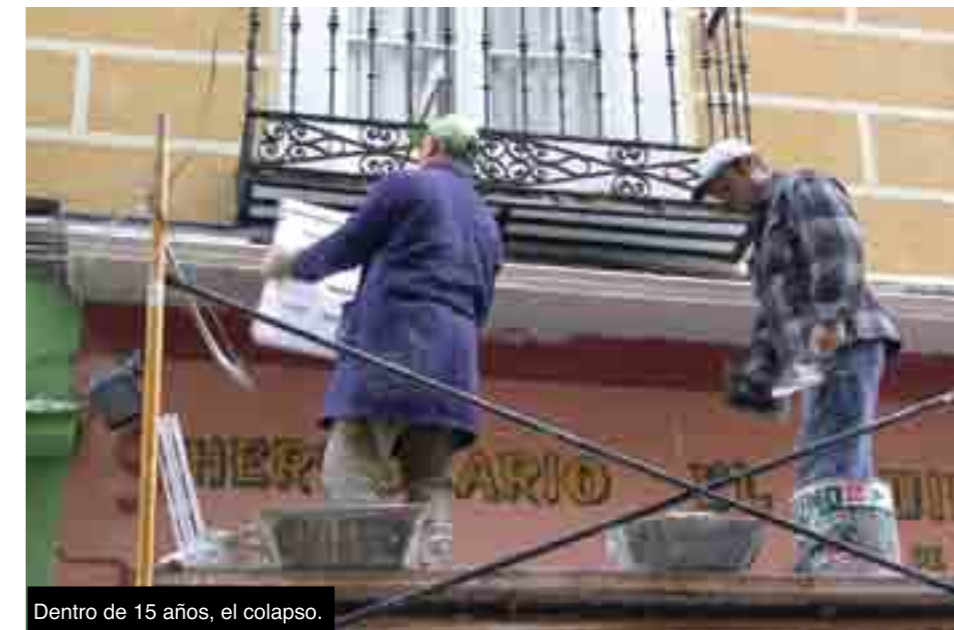
Dentro de 15 años, el colapso.

Las fracciones del PRD, PT y PCD, la minoría, votaron en contra, los que en voz de Pablo Gómez advirtieron con acudir a los tribunales del Poder Judicial por considerar inconstitucional las modificaciones a la Ley del Seguro Social.