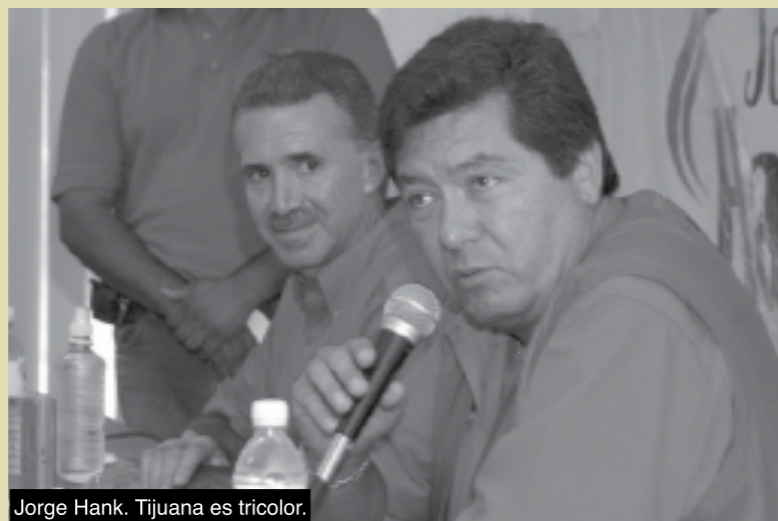
Jorge Hank. Tijuana es tricolor.

que Gabino Cué, el extraño híbrido que produjo la alianza PRD-PAN-Convergencia, comenzaba a desdibujarse. Los medios retomaron la más pintoresca de las anécdotas: en el