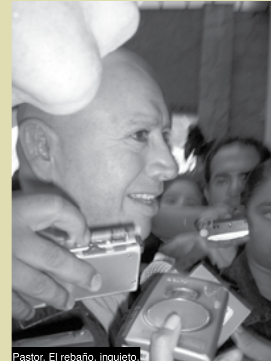
Pastor. El rebaño, inquieto.