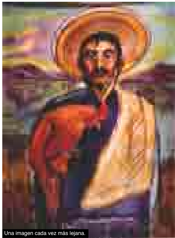
Una imagen cada vez más lejana.