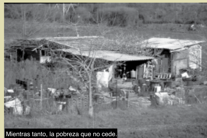
Mientras tanto, la pobreza que no cede.