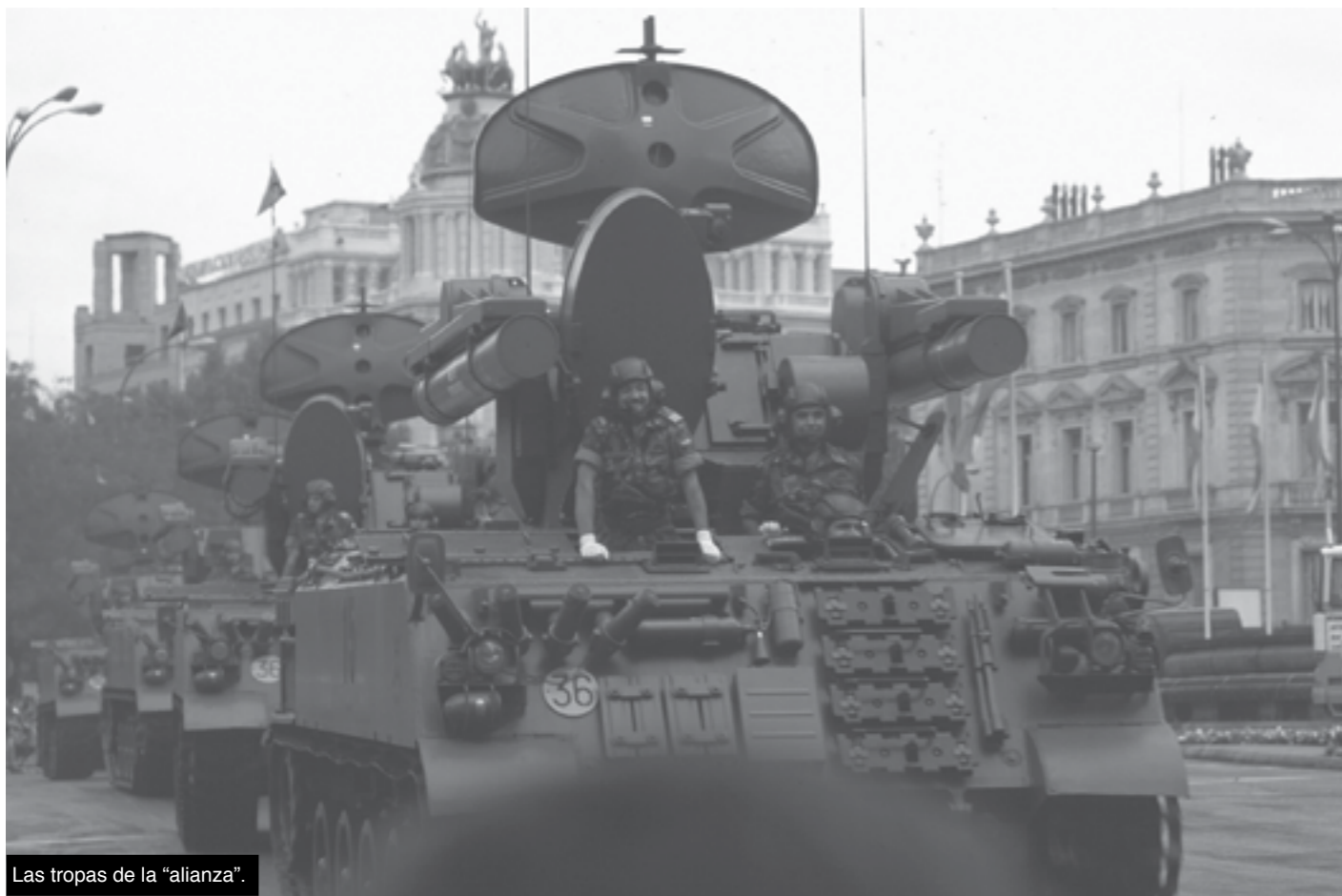
Las tropas de la "alianza".

Concluyó la Convención del Partido Demócrata en Boston y, como ya se esperaba, resultó electo candidato John Kerry; lo acompaña en la fórmula, el Senador por Carolina del Norte, John Edwards. ¿Qué en Estados Unidos -me pregunto- sólo se les ocurre ponerles a sus hijos "John"? En fin, los juanes resultaron electos e inmediatamente las encuestas "de salida" de la convención les otorgaban el triunfo sobre la dupla Bush-Cheney por 48% contra 43%. La diferencia, como puede apreciarse,