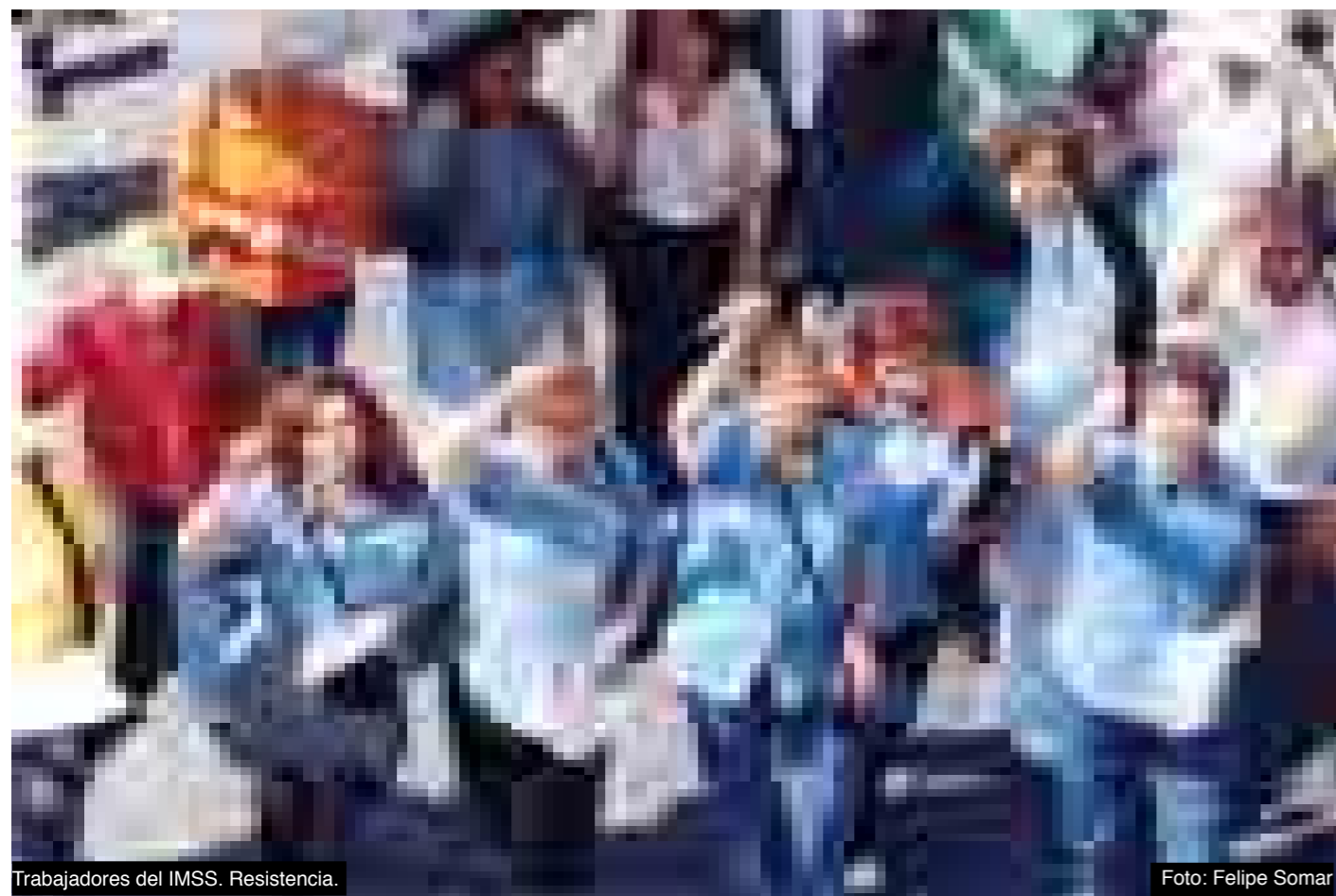
Trabajadores del IMSS. Resistencia.