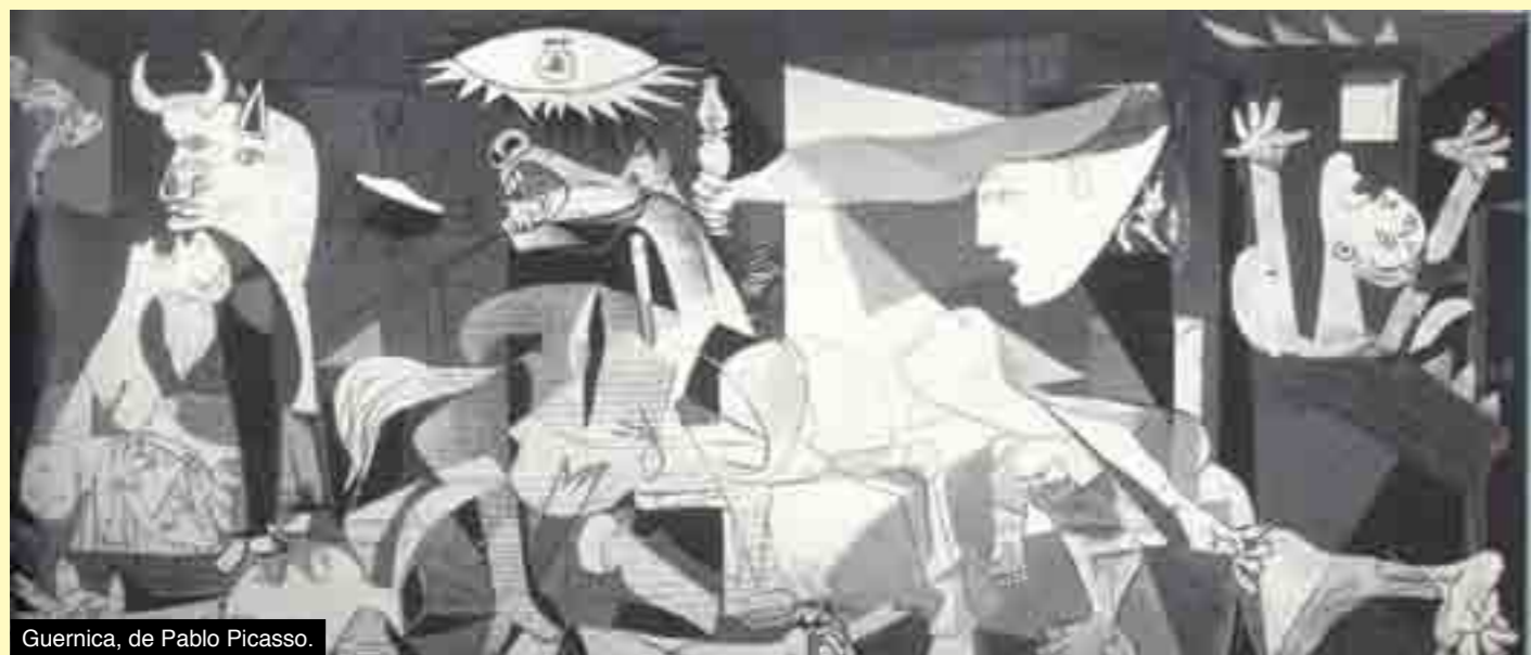
Guernica, de Pablo Picasso.

Maestro, ¿cómo le hizo Mozart, para poder escribir su primera sinfonía cuando apenas tenía siete años? le preguntó alguna vez un estudiante al maestro y célebre chelista Pablo Casals, quien después de pensar unos segundos le respondió: Jamás preguntó cómo hacerla.