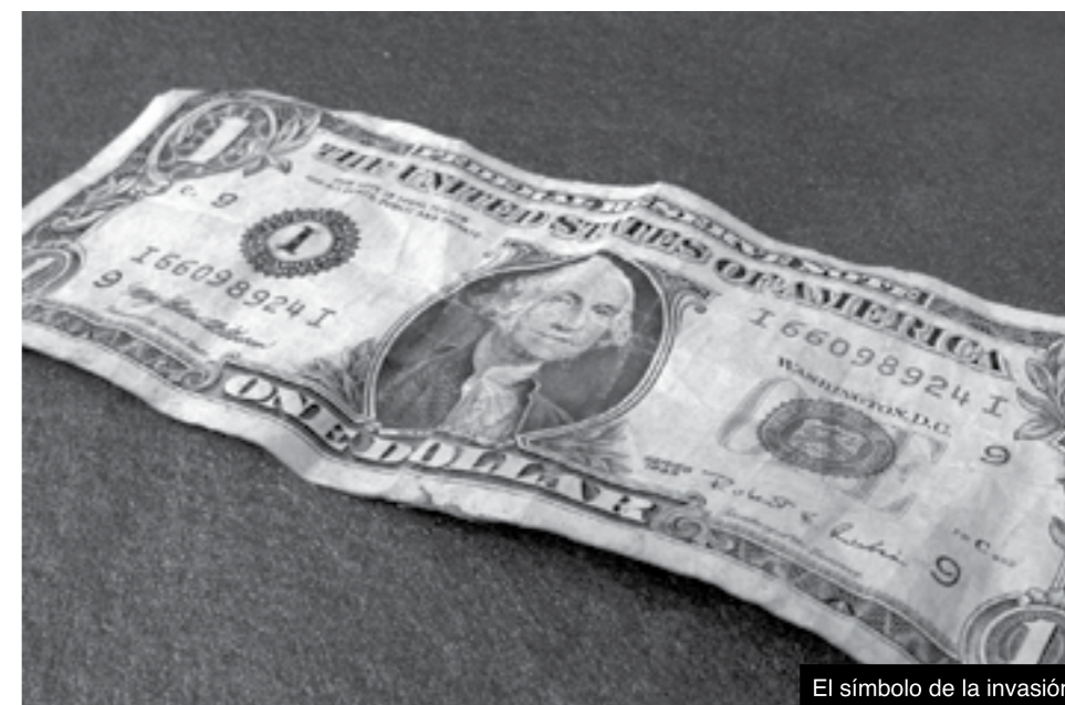
El símbolo de la invasión.

Sin ocuparnos de las patrañas de las armas de destrucción masiva, limitémonos a recordar que los Estados Unidos y sus aliados siempre dijeron que Saddam Hussein era un tirano desalmado que mantenía a su pueblo en el más profundo de los sufrimientos. A lo mejor sí, no anduve por Bagdad en esos tiempos. Pero hago una pregunta: ¿Quién cree usted que tenga mayor capacidad de fuego para reprimir inconformidades, el ejército de Saddam Hussein, con todo y lo desalmado que