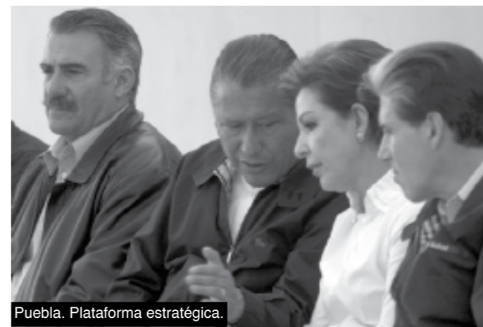
Puebla. Plataforma estratégica.