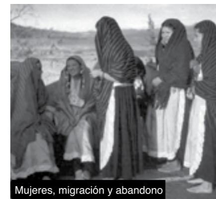
Mujeres, migración y abandono

Sin embargo, la miseria obliga a los michoacanos a seguir los pasos de aquéllos que ahora ya están muertos y que alguna vez quisieron alcanzar lo que su tierra no les dio: una vida digna. ■