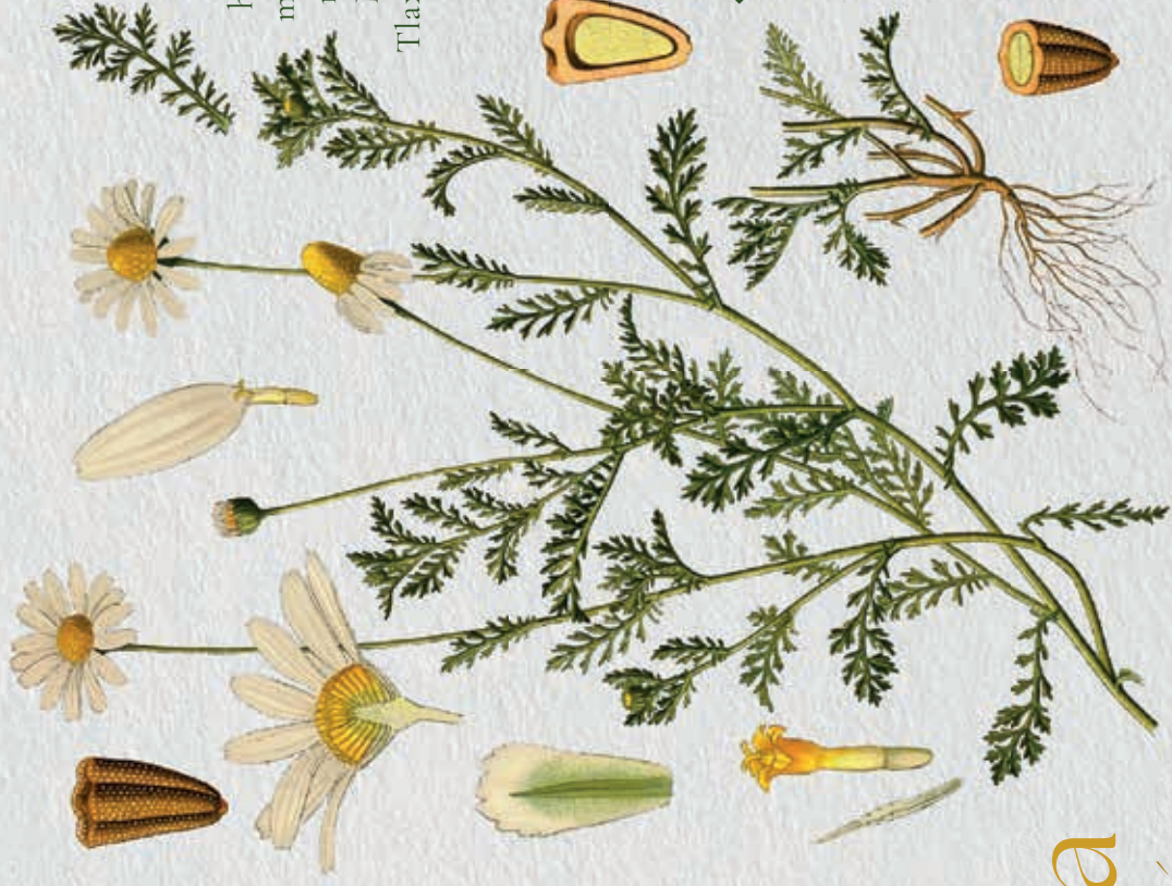
Manzanilla Tanacetum parthenium