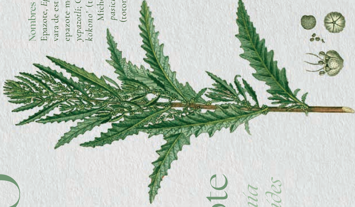
Epazote Dysphania ambrosioides