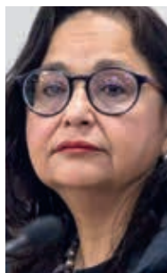
Norma Lucía Piña Hernández