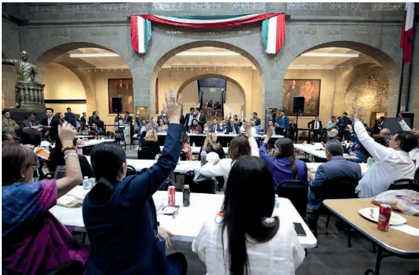
La iniciativa desechada había sido previamente aprobada en Fast Track , “sin cambiarle una sola coma” y sin la participación de legisladores de la oposición por los legisladores de Morena, del PT y PVEM en el Congreso de la Ciudad de México.

“Parecería que, desde ese momento, los ataques han sido incesantes y han ido incrementándose, y eso está constatado. Había tomado posesión la ministra Piña y al tercer día ya había señalamientos de que el Poder Judicial era corrupto, de que los Jueces liberan criminales y a partir de ahí hubo una serie de señalamientos cada vez más graves en donde terminan siendo condenados por un par de resoluciones que resultaron bastante incómodas para el Ejecutivo”, detalló.