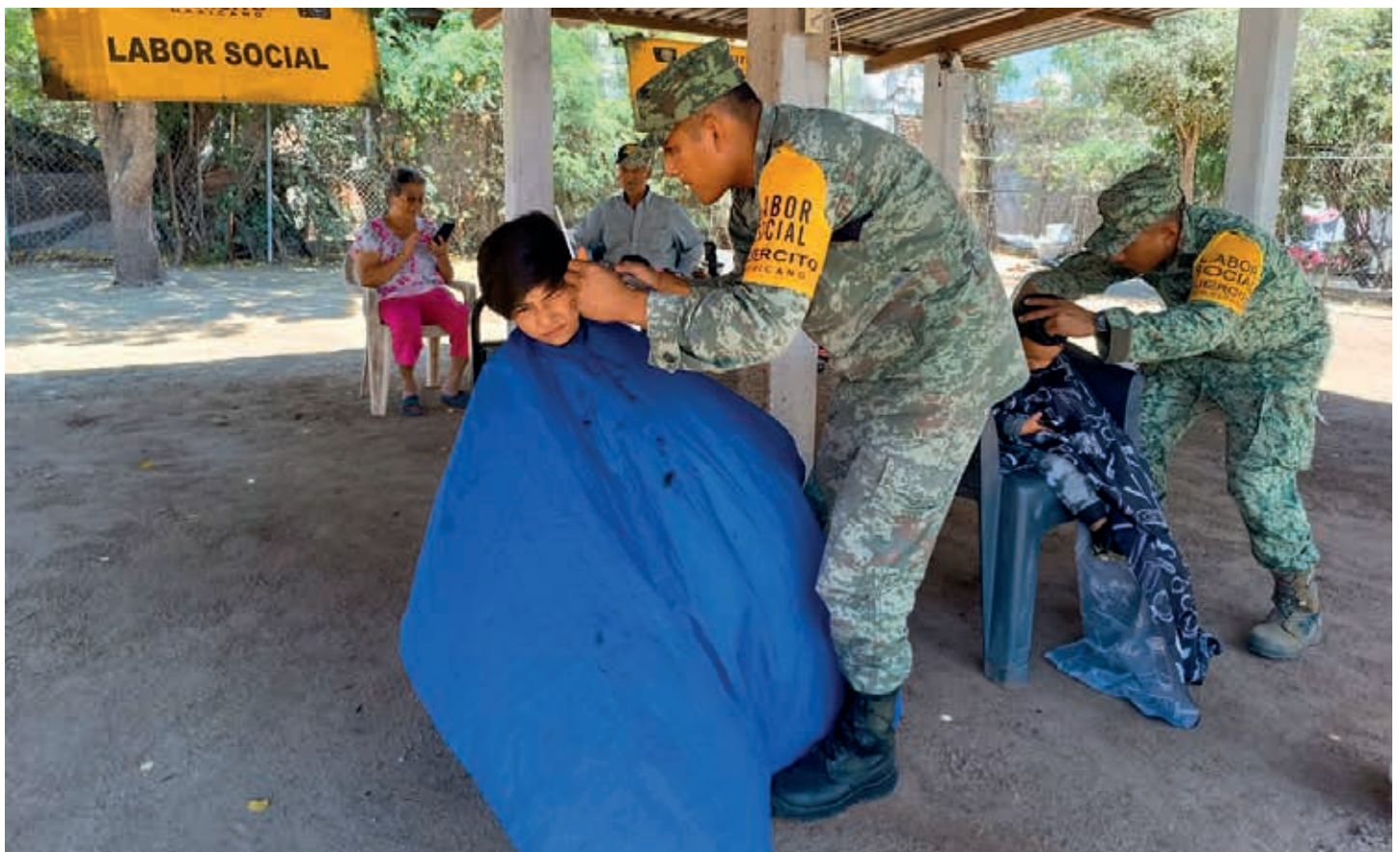
La extrema confianza del Presidente en las fuerzas armadas se evidencia en las tareas civiles que ahora desempeñan, adicionales a la de seguridad nacional.

➤ Esta iniciativa, así como las labores que las fuerzas armadas realizan hoy en otros ámbitos del orden civil, contravienen el Artículo 129° de la Constitución General de los Estados Unidos Mexicanos, que claramente establece: “en tiempo de paz, ninguna autoridad militar puede ejercer más funciones que las que tengan exacta conexión con la disciplina militar”.