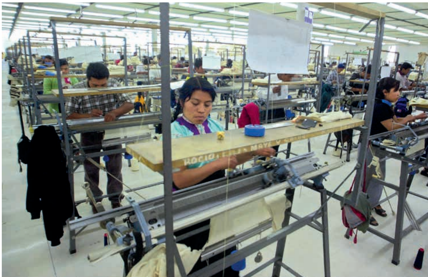
El ingreso per cápita de Coahuila es de 170 mil pesos anuales, el sexto más alto en la nación. En 2022, la economía de Coahuila aportó 901 mil 801 mdp al PIB. Coahuila es, sorprendentemente, el estado que menos presupuesto destina a seguridad pública en la región noreste.