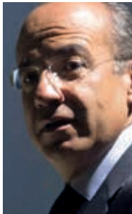
Felipe Calderón Hinojosa

Felipe Ángeles. La discrecionalidad que tienen las fuerzas armadas para manejar presupuestos y que, sin duda alguna, porque las fuerzas armadas no son impolutas, pueden llevar a procesos de corrupción”, advierten los investigadores del CIDE.