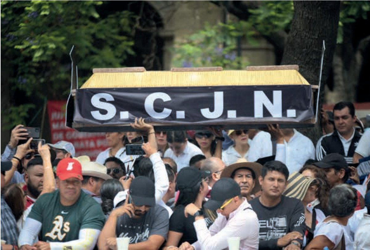
El sábado 20 de mayo en un acto macabro y meritorio de una investigación ministerial: diputados de Morena en Veracruz pasearon frente al edificio de la SCJN féretros con las fotografías de los ministros Piña y Pérez Dayan marcados con la frase “Descansen en paz”.