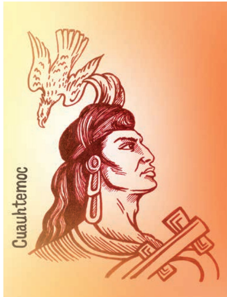
Ilustración: Carlos Mejía

Existe la versión de que Ce Acatl Topiltzin fue en realidad un vikingo de Groenlandia (obviamente de piel blanca, rubio y barbado) que naufragó en la costa oriental de Norteamérica, que ésta lo llevó a Tampico, que de este puerto navegó por las aguas de los ríos Pánuco, Moctezuma y Tula hasta llegar a la capital de los toltecas. La versión mítica de su “vuelta” se vio reforzada a partir de 1492, cuando los españoles llegaron al Caribe (Bahamas, Puerto Rico, Santo Domingo, Cuba y Jamaica) y su tez blanca generó “presagios” sobre el