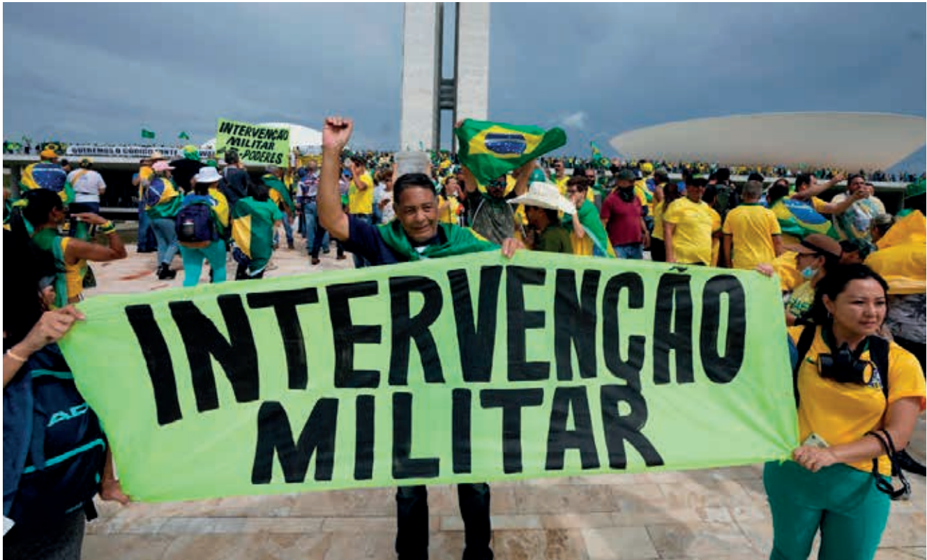
La tentación del militarismo siempre ha estado presente en el país más grande de América Latina.

la misma forma que la economía chilena fue elogiada durante la dictadura del general Augusto Pinochet.