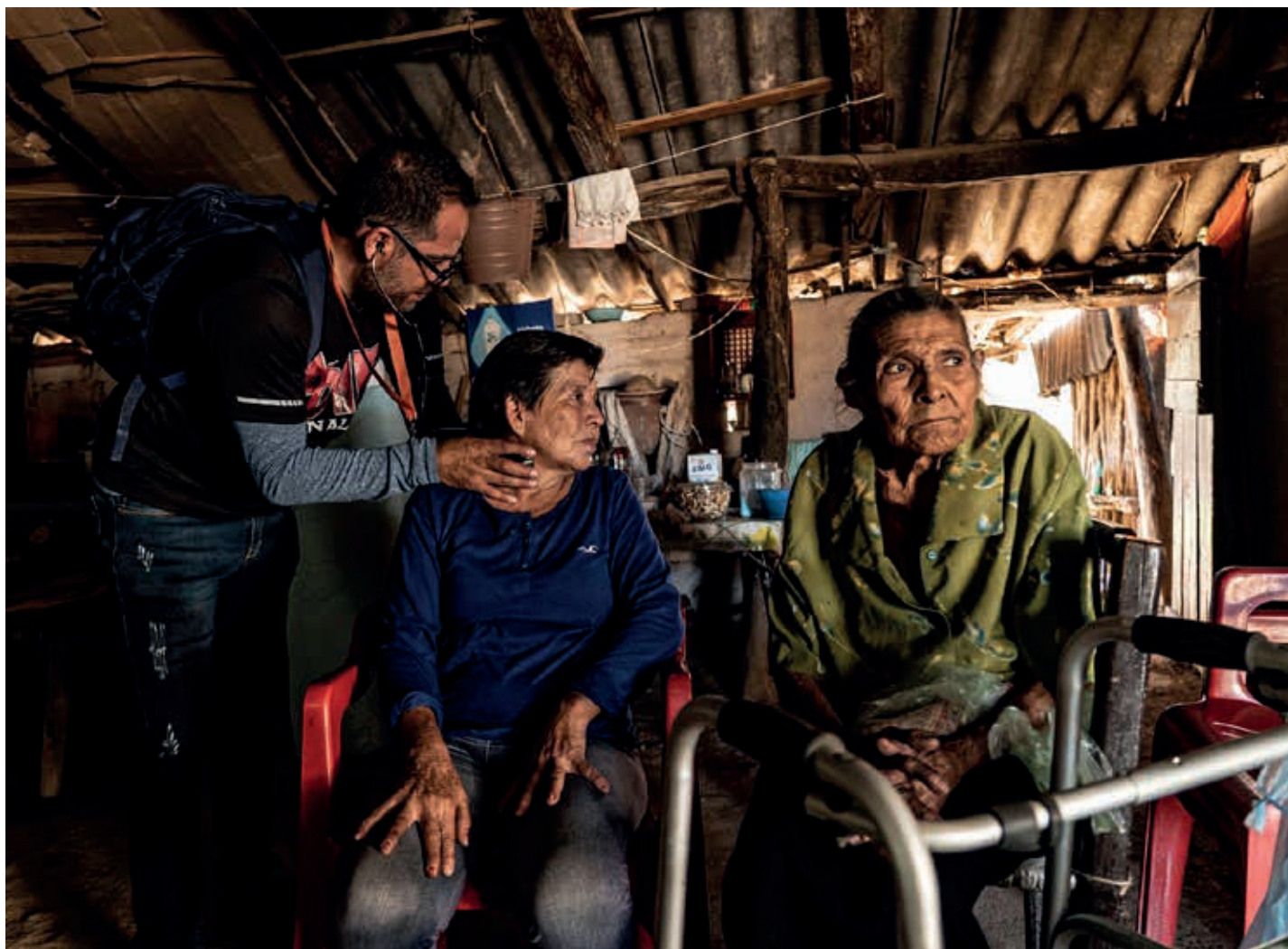
Mujeres del poblado de Jesús María reciben atención médica al interior de su casa luego de sufrir episodios de crisis nerviosas por lo sucedido en el pueblo.

➤ vehículos que ingresaban o salían de Jesús María, lo que provocó una fila enorme de automóviles particulares.