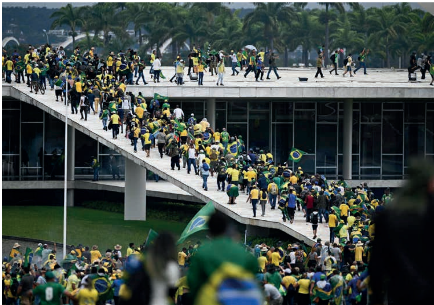
Decenas de mujeres y hombres con playeras del característico verde-amarela brasileño, asaltaron el ocho de enero las instituciones de Estado más relevantes de Brasil.

estrategia del Lawfare (con la farsa del juicio por el caso Lava Jato y sus secuelas) para dismantlar los logros en 13 años de gobiernos del Partido de los Trabajadores (PT) como intento de superar 500 años de autoritarismo reaccionario.