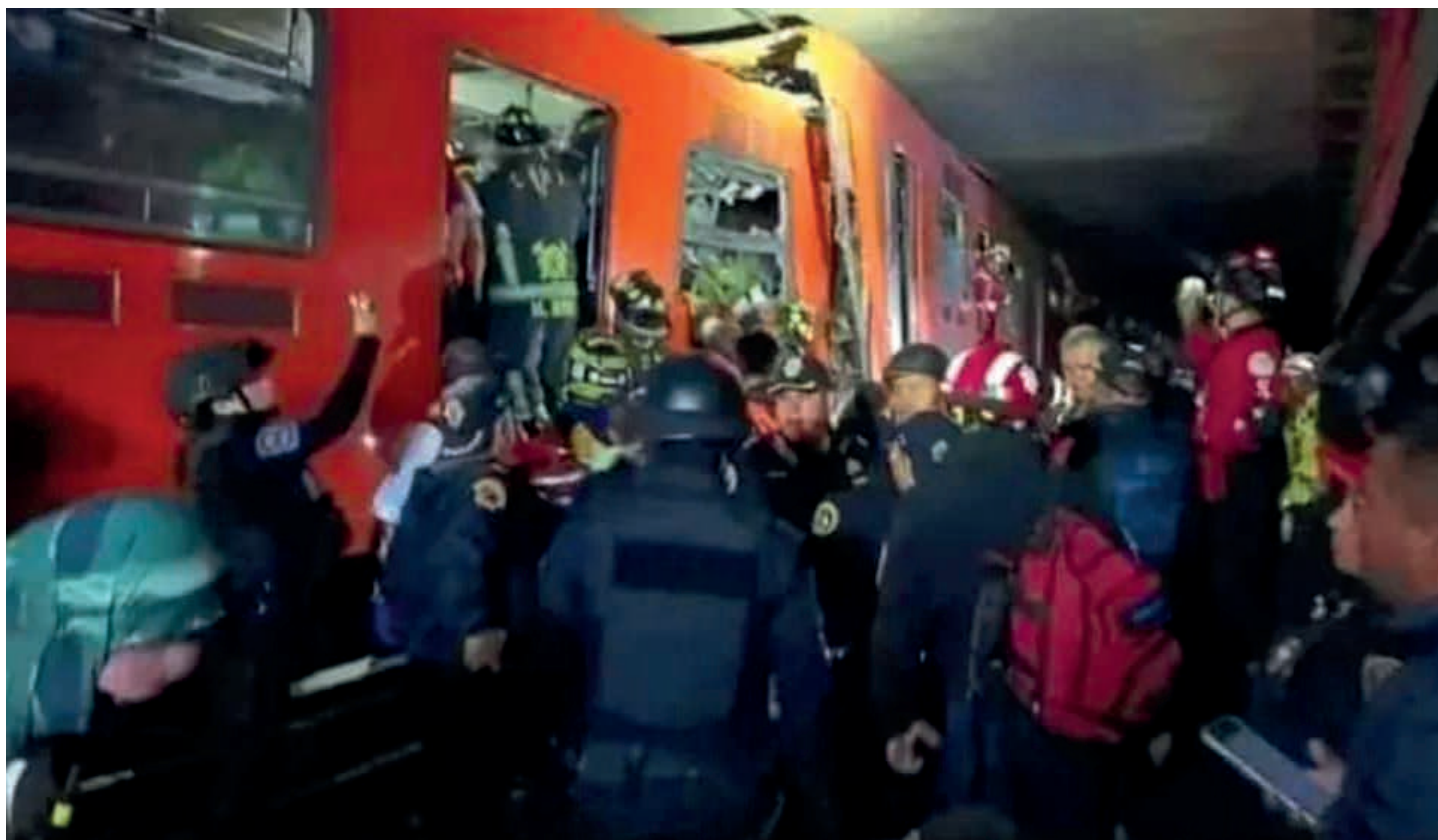
La propia jefa de Gobierno ha intentado responsabilizar a las anteriores administraciones por los incidentes y tragedias ocurridas en el Metro.

año. Difícilmente se logrará cumplir el plan anual”.