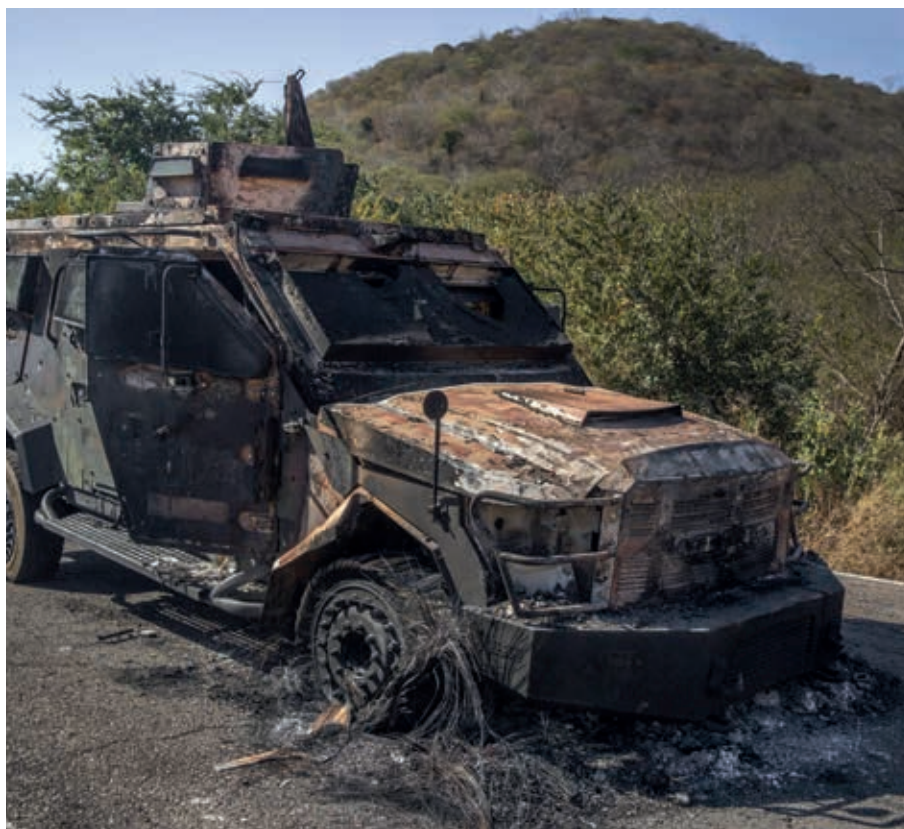
Las unidades calcinadas quedaron como testimonio macabro de la jornada violenta, que cobró la vida de 30 personas (10 militares, 19 presuntos integrantes del grupo delictivo y un Policía Estatal Preventivo).