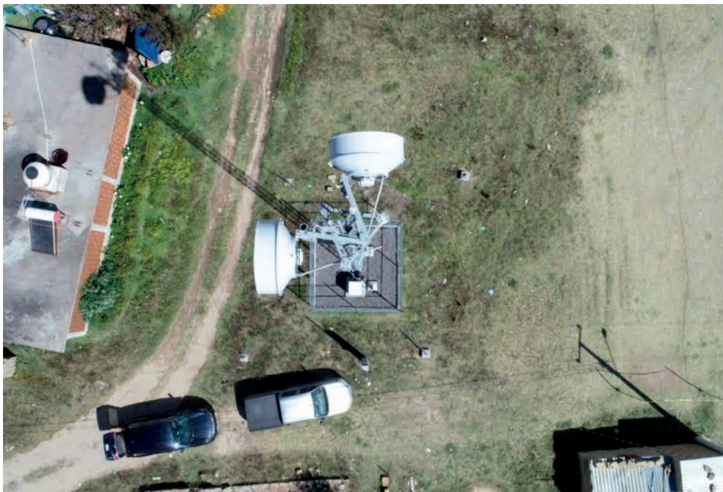
La organización civil Telecomunicaciones Indígenas Comunitarias, Asociación Civil. (TIC-AC) trabaja en comunidades indígenas donde promueve la construcción, gestión y operación de sus propias redes de comunicación.

que no es sustentable pensar que las redes de última milla (se refiere a la entrega del servicio al consumidor final), en contextos sobre todo rurales, van a poder ser administradas por las grandes empresas o por el gobierno.