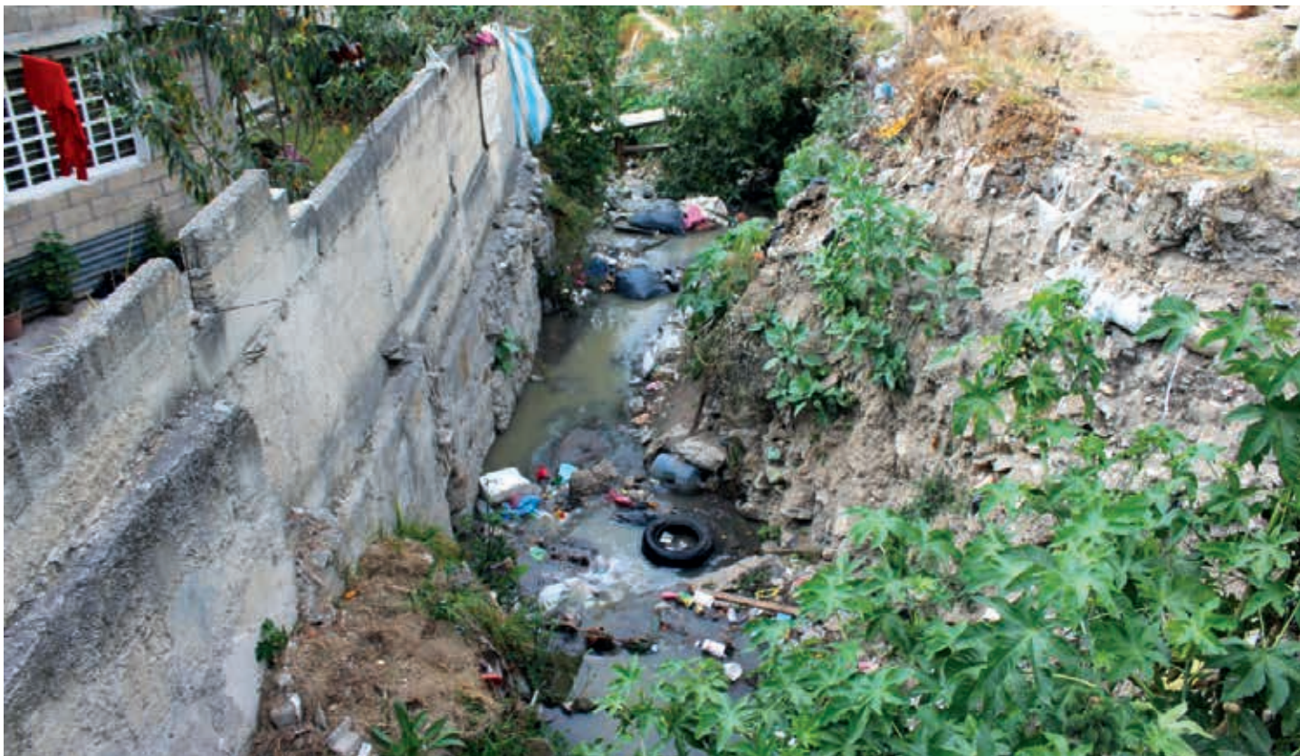
Familias de las colonias Vicente Guerrero Primera sección, La Y griega, Libertad, Ampliación libertad, Jiménez Cantú, Aquiles Córdova, Wenceslao Victoria Soto, Espartaco, San Isidro La Paz, Bosques de la Colmena, Juárez Barrón, Magú, El Vidrio, San Juan Tlihuaca, Balcones de Santa Ana y Granjas Guadalupe han solicitado el entubamiento de los ríos aguas negras que cruzan por sus comunidades y les provocan enfermedades gastrointestinales, de la piel y ojos, inclusive la muerte.