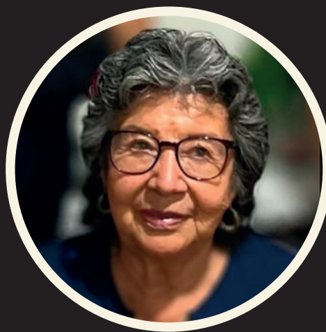
Ilustración Carlos Adrián Mejía Soto Luy

El equipo editorial de la revista buzos de la noticia , lamenta el sensible fallecimiento de la señora