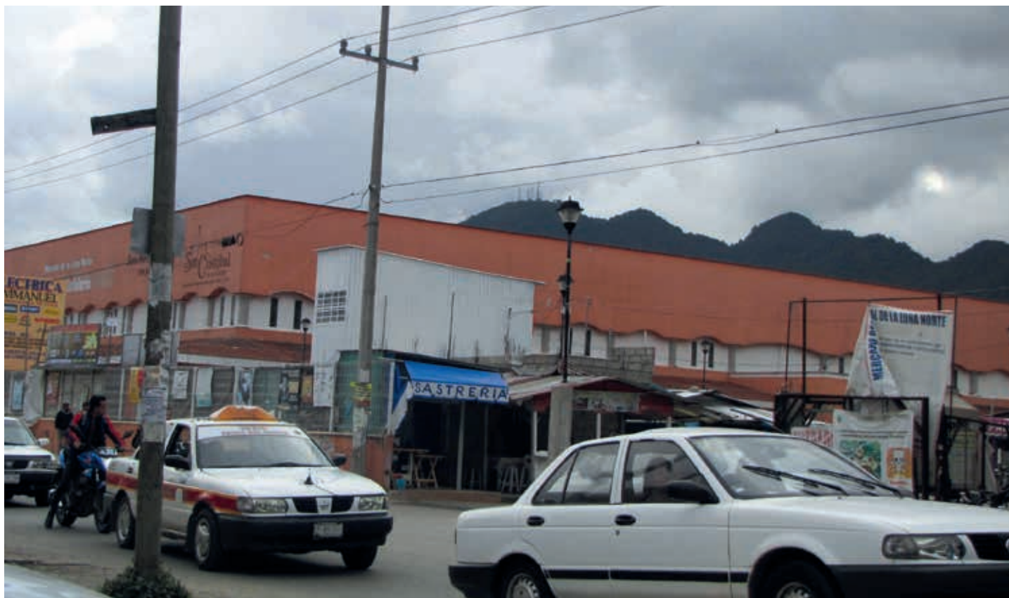
En San Cristóbal, las autoridades viven arrodilladas ante el poder de los grupos violentos y los microcárteles del crimen organizado que se esconden detrás de ellos. Fueron demonios que durante años se subestimaron de cara a complicidades e intereses políticos y que ahora están por encima de la capacidad de la acción gubernamental.