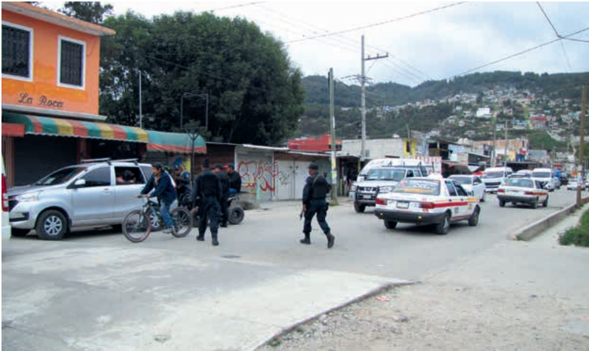
Las personas aterradas pedían la presencia de elementos policiacos y del Ejército para que restablecieran el orden; y algunas denunciaron que les arrebataron sus pertenencias.

tienen el control de la administración del mercado y que, “gracias” a la GN y al Ejército, se “restableció el orden”, que solo hubo un muerto después de varias horas de balacera y que no había detenidos.