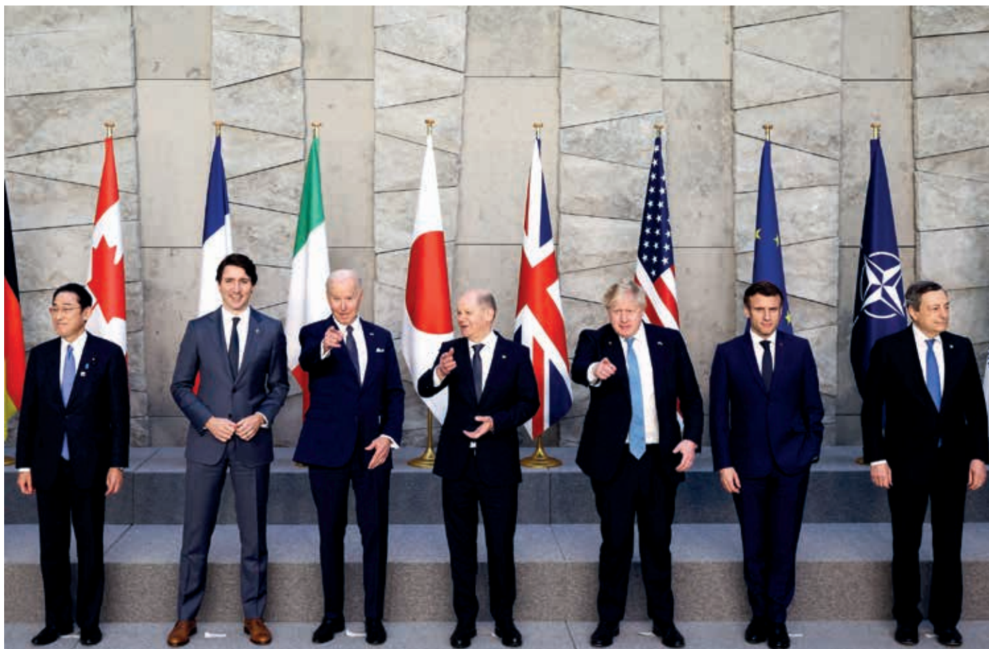
Reunido en los Alpes Bávicos a finales de junio, el mutilado G8 (G7 sin Rusia) propuso reubicarse para evitar adhesiones masivas de países decepcionados con su propia gestión.

La idea se sometió a prueba el 23 de junio en Beijing durante la XIV cumbre de los BRICS, donde se escenificó el estira y afloja entre intereses geopolíticos de las superpotencias y las economías subordinadas. Los BRICS Plus presagieron un “punto de reinicio”, sostiene Javier Vadell, de la Universidad Católica de Minas Gerais, Brasil