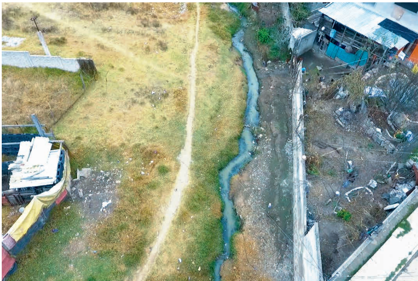
El drenaje a cielo abierto afecta al 90 por ciento del medio ambiente natural y social de la población de Nicolás Romero.

arroyos y ríos como el Xinté, San Idelfonso, Sitio 217, Grande, San Pedro y San Juan Tlihuaca.