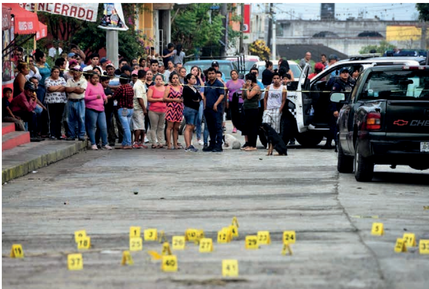
Las personas saben vivir con miedo en los lugares donde está sucediendo la violencia. Rebasamos ya 100 mil personas desaparecidas en los últimos años y no tenemos estas respuestas aún. Quiere decir que no estamos comprendiendo las dinámicas que van impulsando estos fenómenos delictivos.