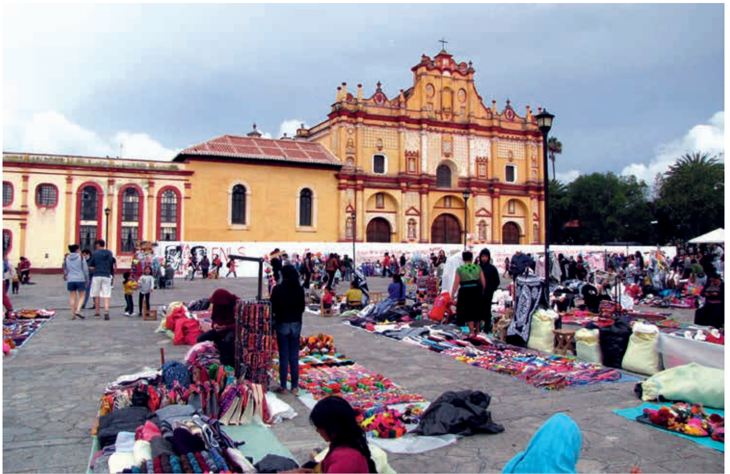
El pasado 14 de junio, la más conocida de las ciudades coloniales de Chiapas fue presa del terror cuando dos grupos armados antagónicos se enfrentaron a balazos durante varias horas