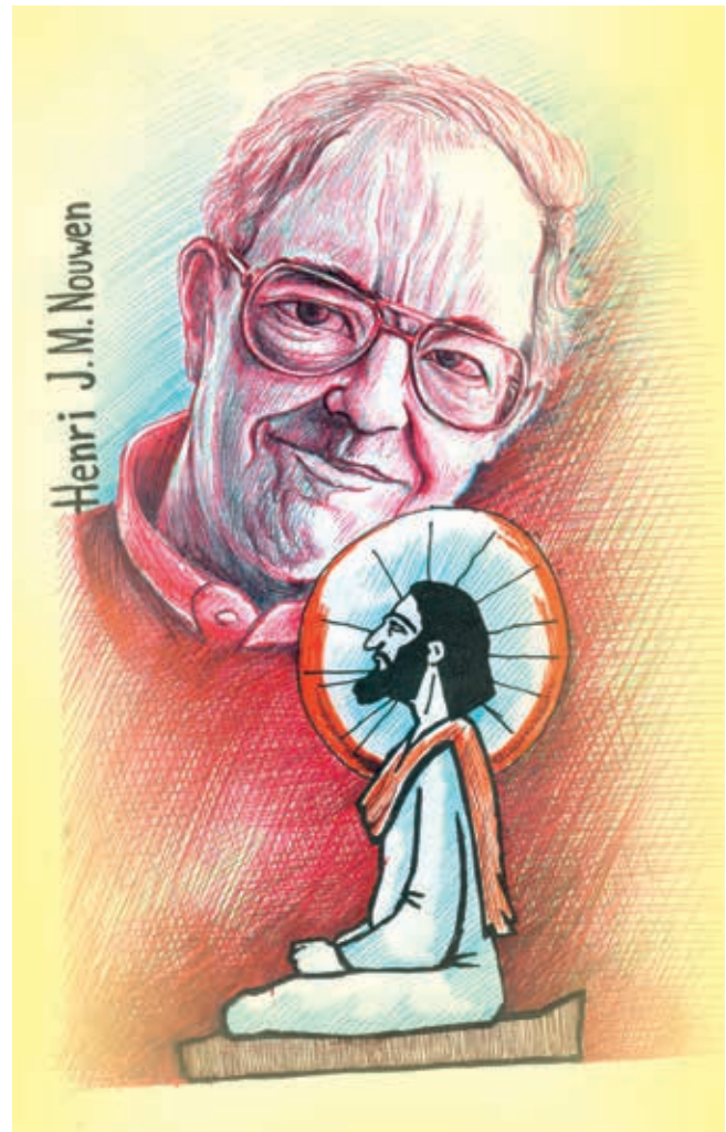
Ilustración: Carlos Mejía

En su prólogo, Nouwen alude también al paralelismo ideológico que hay entre las doctrinas de Cristo y Buda; entre el ascetismo de los ermitaños cristianos primitivos y el aislamiento de los budistas; entre la búsqueda de purificación espiritual por vía de la oración de los primeros y la meditación de los segundos; y entre la inmovilidad de los ascetas cristianos del desierto y la inmovilidad corporal de los budistas bajo un árbol. En ambas actitudes había (hay) –al igual que en todas las creencias religiosas modernas– una tentativa de evasión a