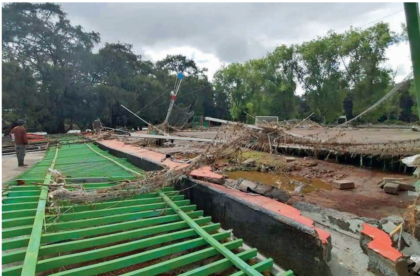
Al menos 31 mil viviendas resultaron afectadas, así como mil 700 negocios comerciales, tres mil 600 hectáreas de cultivo y más de 70 mil personas damnificadas.

agosto de 2021, las fuertes tormentas tropicales que cada año agobian a gran parte del país, en la CDMX y el Edomex provocaron una afluencia mayor de aguas pluviales que, sumadas a las aguas negras del Valle de México, desbordaron el cauce del río Tula.