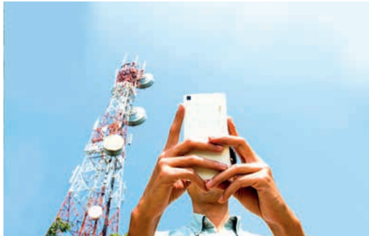
El Presidente anunció con bombos y platillos la compra en 100 mdd de la compañía Altán Redes, firma dedicada a brindar servicios de telecomunicación digital y que enfrenta deudas por mil 500 mdd, es decir 30 mil 600 millones de pesos.

De acuerdo con la Ley de Concursos Mercantiles, Altán podía ser adquirida solo hasta que saneara sus finanzas mediante el pago de mil 500 mdd que debe a varios acreedores, lo que de