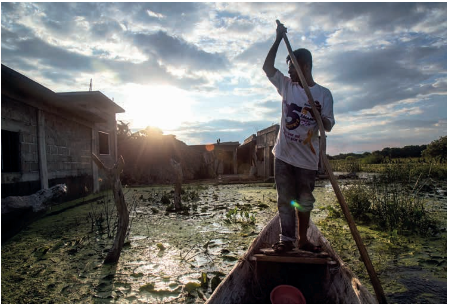
En 2019, el sector pesquero de Oaxaca daba trabajo a más 12 mil pescadores de San Mateo del Mar, Huilotepec, Álvaro Obregón, Playa Vicente, Juchitán, Unión Hidalgo, San Dionisio del Mar y Santa María Xadani, aunque sus ingresos apenas alcanzaban para cubrir sus necesidades básicas.

E n ese periodo, Salina Cruz, el principal productor marítimo de Oaxaca, ya no figura en la lista de los puertos pesqueros más importantes del Pacífico mexicano; y de las 120 embarcaciones que tenía, ahora solo le quedan 50 naves, de las cuales únicamente 35 están en condiciones de zarpar.