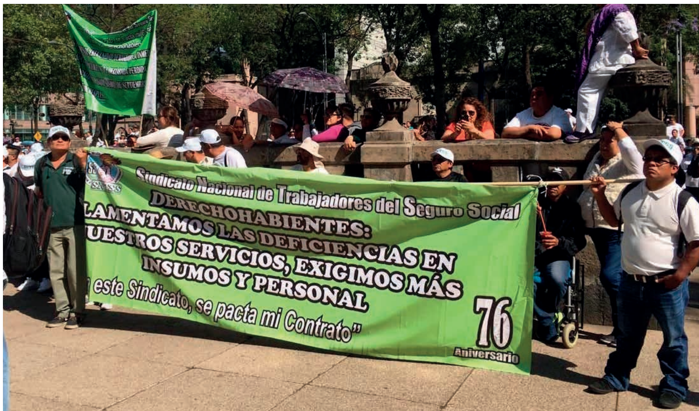
El IMSS-Coplamar, hoy IMSS-Bienestar, desde su creación, ha funcionado con presupuesto insuficiente, de tal forma que ahora solo cuenta con instalaciones sanitarias en mil 328 de los dos mil 456 municipios de 19 de los 32 estados de la República.

por ejemplo, una baja proporción de personal de enfermería con respecto a médicos: 1.2 versus 2.7, que es el promedio de la OCDE”, expone el análisis.