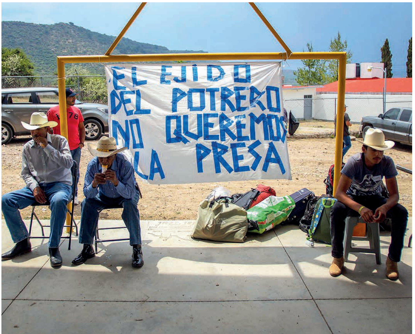
La población se encuentra dividida, ya que unas personas se pronuncian a favor de la presa y otras en contra. Este conflicto llegó a las amenazas de muerte; y en el caso de los campesinos, a la invalidación de las actas de las asambleas ejidales.