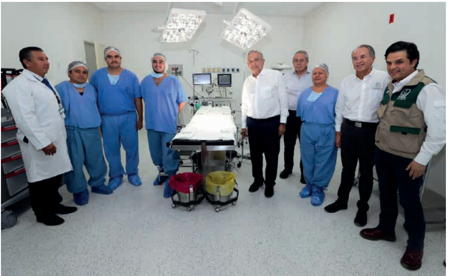
La administración de AMLO pretende ampliar sus servicios y cobertura mediante convenios con los gobiernos estatales que implicarían, además de aportaciones financieras locales, la absorción de sus institutos de salud por cuenta del Gobierno Federal en un esquema centralizado e infructuoso como el del fallido Insabi.

I MSS-Bienestar es el nuevo nombre del Instituto Mexicano del Seguro Social-Coordinación General del Plan Nacional de Zonas Deprimidas y Grupos Marginados (IMSS-Coplamar), que fue creado en 1977 para extender los servicios del IMSS a personas sin filiación laboral fija. Este programa, sin embargo, desde hace 45 años carece de infraestructura y personal suficiente, su atención médica es solo de primer y segundo nivel; y llega únicamente a 11.6 millones de personas en 19 de las 32 entidades de la República.