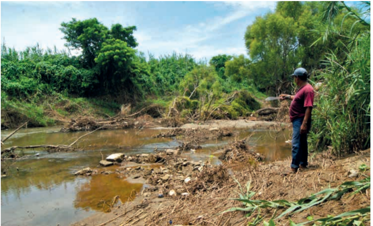
La población se encuentra dividida, ya que unas personas se pronuncian a favor de la presa y otras en contra. Este conflicto llegó a las amenazas de muerte; y en el caso de los campesinos, a la invalidación de las actas de las asambleas ejidales.

gran parte de la población se dedica a la pesca.