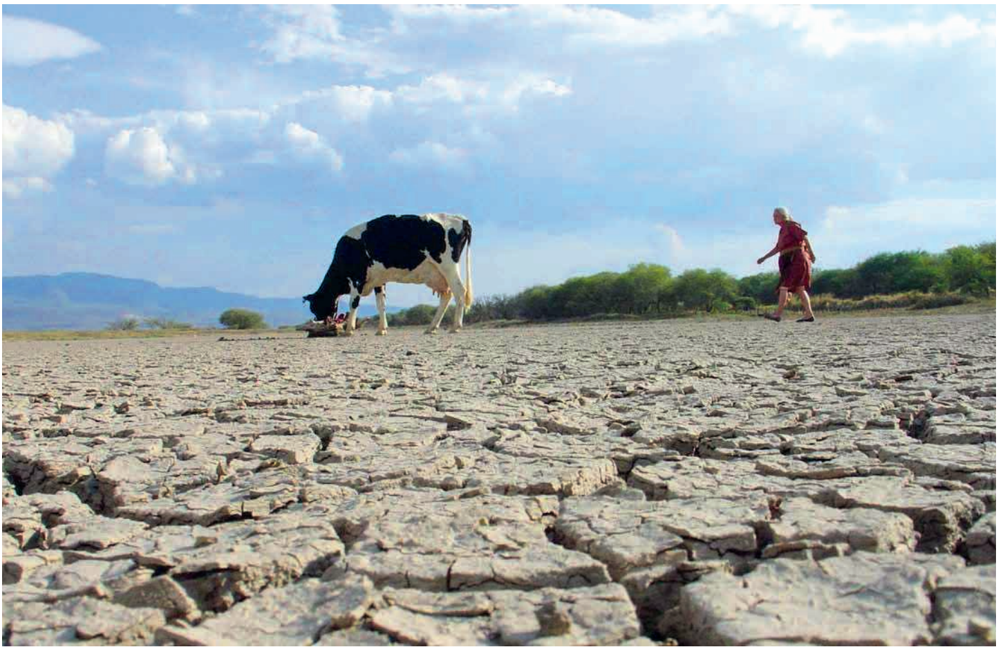
Las regiones Media y Huasteca son las que hoy enfrentan los mayores riesgos generados por el estiaje.