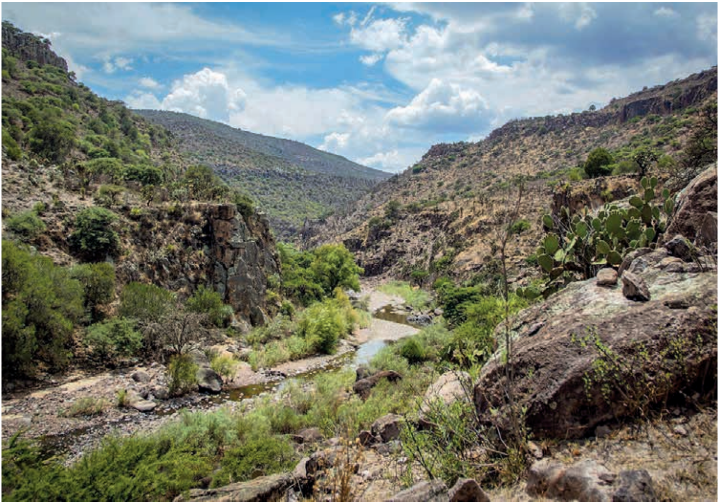
El Programa Nacional Hídrico 2020-2024 clasificó a Zacatecas como una de las regiones del país con mayor agotamiento de sus reservas acuíferas subterráneas y afectación por sequía.

L as autoridades han propuesto una solución posible al problema, pero se halla a 200 kilómetros de distancia de la zona conurbada de la capital: en los ejidos del municipio de Jiménez del Teúl, donde se construiría una presa con capacidad para albergar 67 millones de metros cúbicos de agua, la cual sería suficiente para superar el desabasto que padecen cuatro de cada 10 zacatecanos.