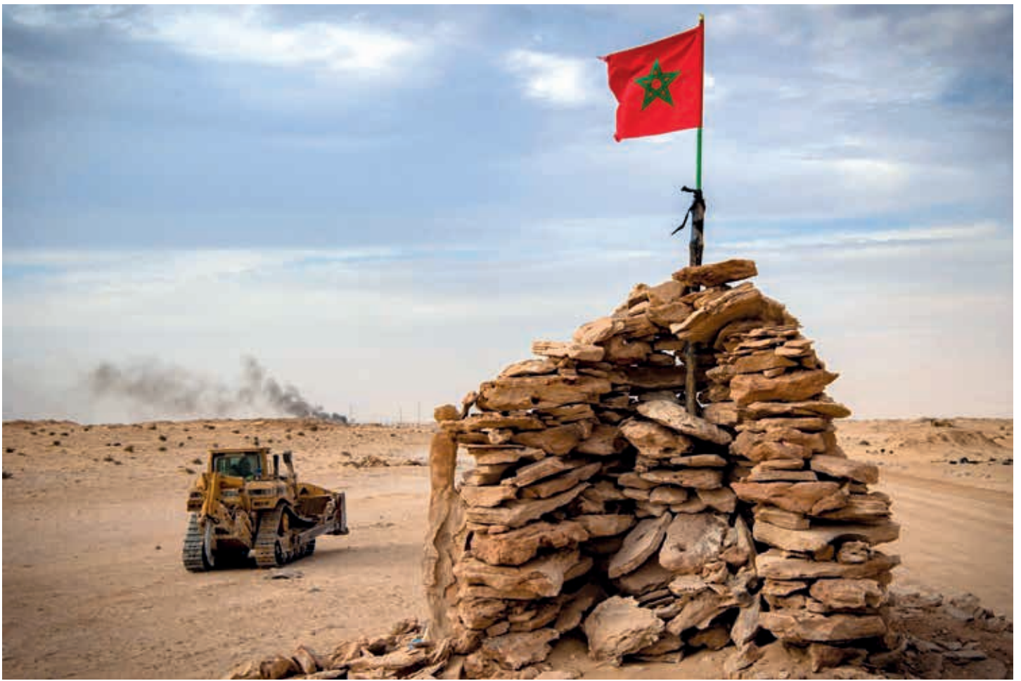
El pueblo saharahuí padece hoy, en su territorio, el voraz saqueo de recursos minerales por parte del reino marroquí.

E n el Siglo XXI sigue vivo el espíritu colonial concretado en las corporaciones. Hoy la economía mundial está dominada por la codicia de las empresas mineras, petroleras, farmacéuticas y agroindustriales. Este fenómeno multifacético se mantiene en África, Asia y América Latina, como el que hoy padece el pueblo saharahuí con el voraz saqueo de recursos minerales que el reino marroquí realiza en su territorio, que ocupa desde hace más de 42 años.