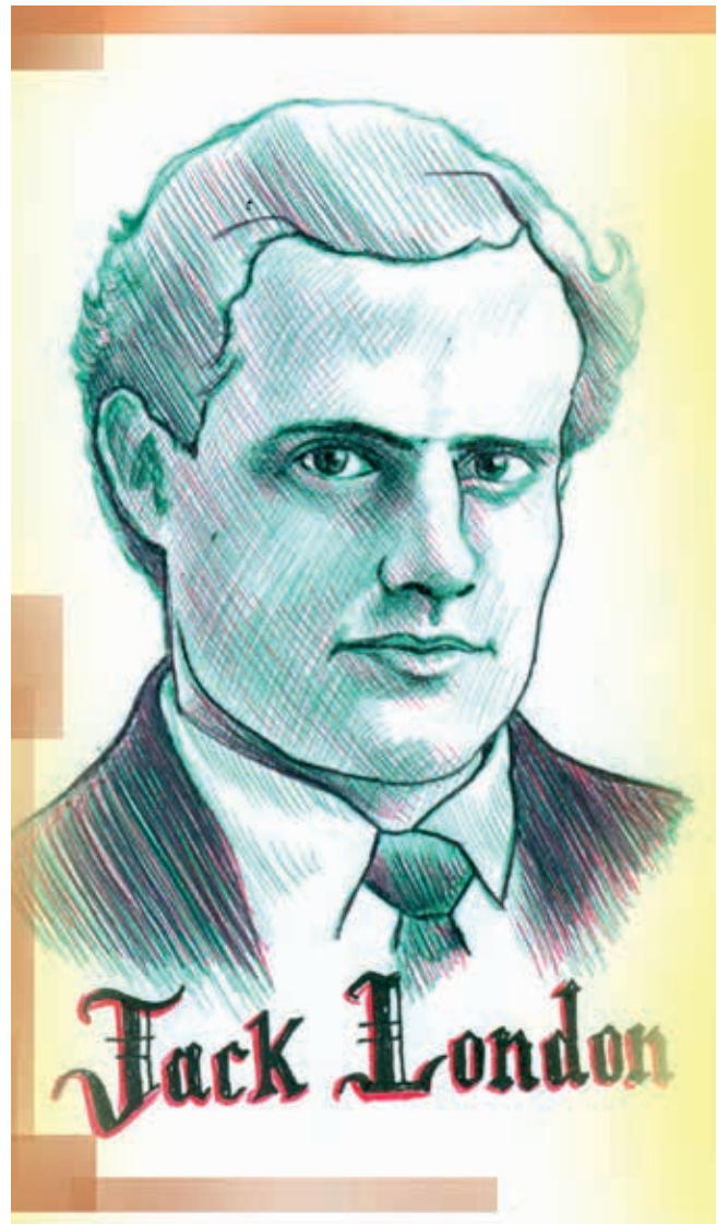
Ilustración: Carlos Mejía

“A menudo me pregunto algo acerca de mi línea de descendencia. Yo, el moderno yo, soy indiscutiblemente hombre, pero yo, Diente Largo, el primitivo yo, no soy sin embargo hombre. Estos dos componentes de mi doble personalidad deben encontrarse en alguna parte y por mi línea directa de descendencia, ¿no estaría La Horda, en el momento de ser destruida, recorriendo el proceso de su humanización? ¿No habríamos llevado a cabo, nosotros, yo y los míos, este