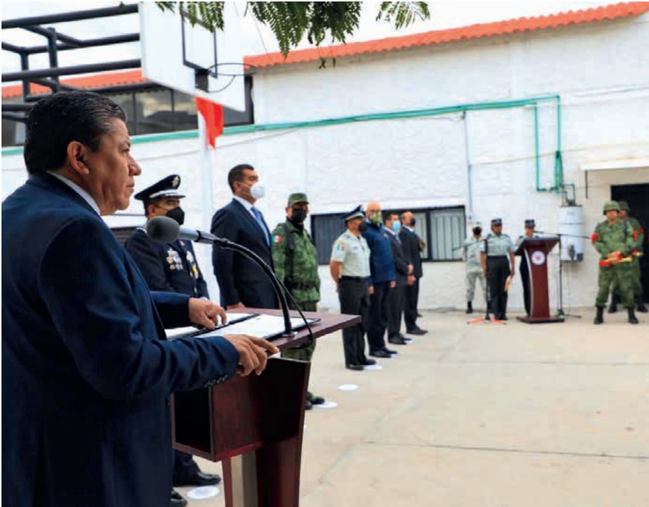
Los gobiernos Federal y estatal no han logrado convencer a los ejidatarios de aprobar la construcción de la presa; éste será uno de los retos de Monreal Ávila quien, a pesar de ser morenista, la considera una opción viable; ya que está incluida en la cartera de proyectos de la SHCP.

de la votación) y su periodo será del 12 de septiembre de 2021 al 11 de septiembre de 2027.