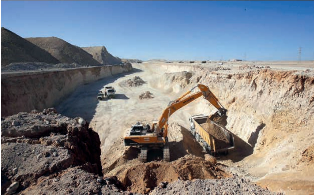
La lógica del saqueo que las transnacionales de EE. UU. y Europa ejercen sobre el Sáhara Occidental se corresponde al aval que dan a la ocupación de Marruecos sobre el territorio de esta nación.

una solución política mediante un referendo, al que por décadas se ha opuesto Marruecos.