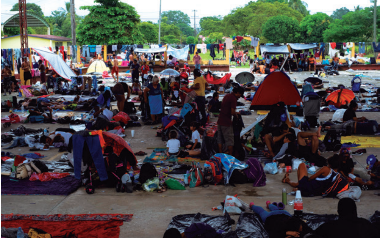
Los testimonios visuales y orales ampliamente difundidos en redes sociales desmienten la política migratoria “humanitaria” del Gobierno Federal.

año hubo 29 mil 800 solicitudes; en 2019 llegamos a 70 mil 400, un incremento notable; y en 2020, en el primer tercio, seguía un incremento del 34 por ciento con respecto al primer trimestre de 2019, el pronóstico es que íbamos a rebasar las 80 mil solicitudes”, especificó el funcionario.