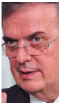
Marcelo Ebrard Casaubón

Un año después de asumir la Presidencia de México, AMLO informó, a través de las secretarías de Relaciones Exteriores (SRE) y Gobernación (Segob), que su política migratoria se regiría basándose en la protección de los derechos humanos de los indocumentados y en el desarrollo económico de la región sur del país y de Centroamérica.