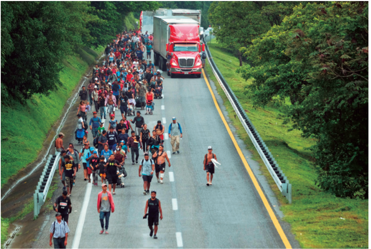
Pueblos Sin Fronteras destacó, una vez más, que las personas migrantes son desplazadas por “el hambre, la violencia y la muerte” y que “caminan juntas en busca de una vida digna”.

➤ Tan solo en estos meses fueron deportados más de 20 mil migrantes; pero “van, llegan a la frontera, los deportan y se regresan, y sigue la cuestión y no están buscando una solución. Lo que proponemos es que a la gente se le dé documentación, lo necesita, para que pueda trabajar, integrarse por un tiempo a la sociedad; el que quiera, va a migrar, que la migración no duela tanto, que sea menos fuerte, y que se dé la oportunidad de dar de comer a sus familias, que no estén en las calles, que no estén en hacinamiento en los albergues”.