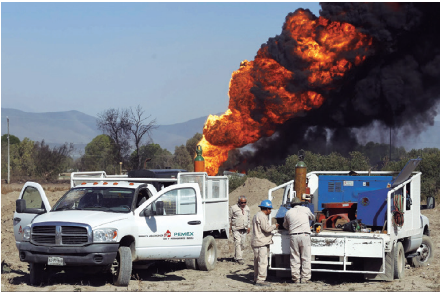
Barbosa Huerta afirmó que el huachicol había disminuido 40 por ciento, mentira con la que intentó destacar la eficiencia de su administración estatal en el combate a este delito ya que, en 2018, Puebla había superado el pico más alto de este ilícito en el rubro nacional, con un promedio de 172 tomas ilegales por mes.

E n esa misma ocasión, el titular de la Sedena reveló que el número de tomas clandestinas en Puebla representaba un aumento del siete por ciento con respecto al año anterior; y que, en el combate al robo de combustibles, el Ejército había capturado a 202 personas en lo que iba de la administración federal de AMLO.