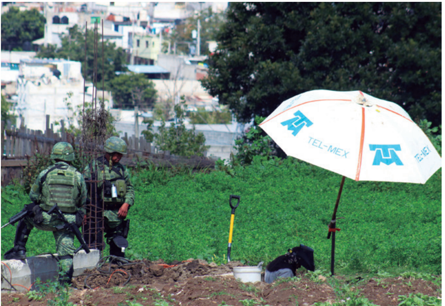
En los primeros meses de este año, nueve de los 10 municipios con más tomas clandestinas de gas LP se ubicaban en Puebla.

➤ centro coordinador de investigación en la Zona Militar XXV de la Sedena.