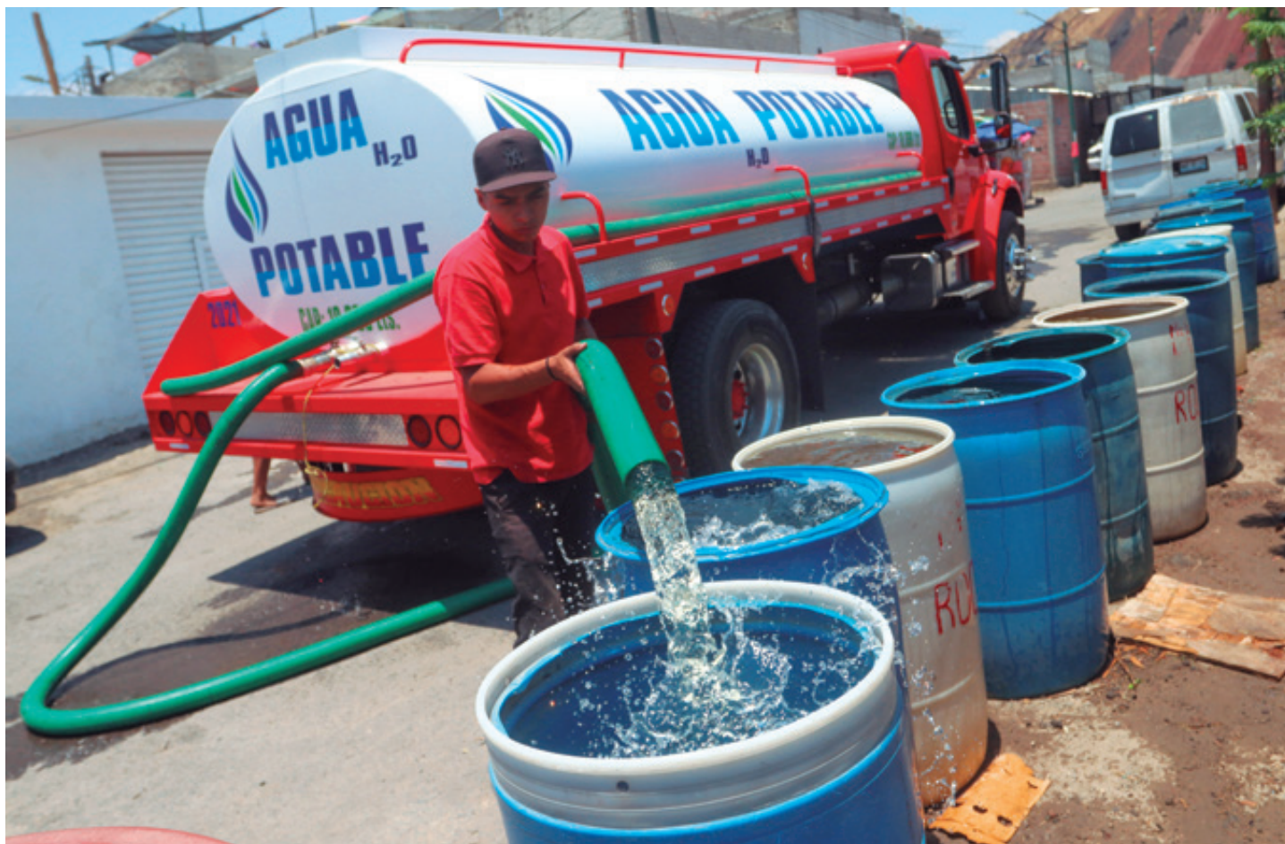
Hubo un periodo en el que no llegó agua a la mayoría de colonias y fue necesario llevarla en pipas para dotar a las familias, así como a gran parte de las escuelas públicas.

Cuauhtémoc Cárdenas cuando ocupó la jefatura de Gobierno de la CDMX en el periodo 1997-2000. La siguiente administración, a cargo del PRD (2000-2006), estuvo en manos de Andrés Manuel López Obrador (AMLO), y tampoco se dio continuidad a la obra.