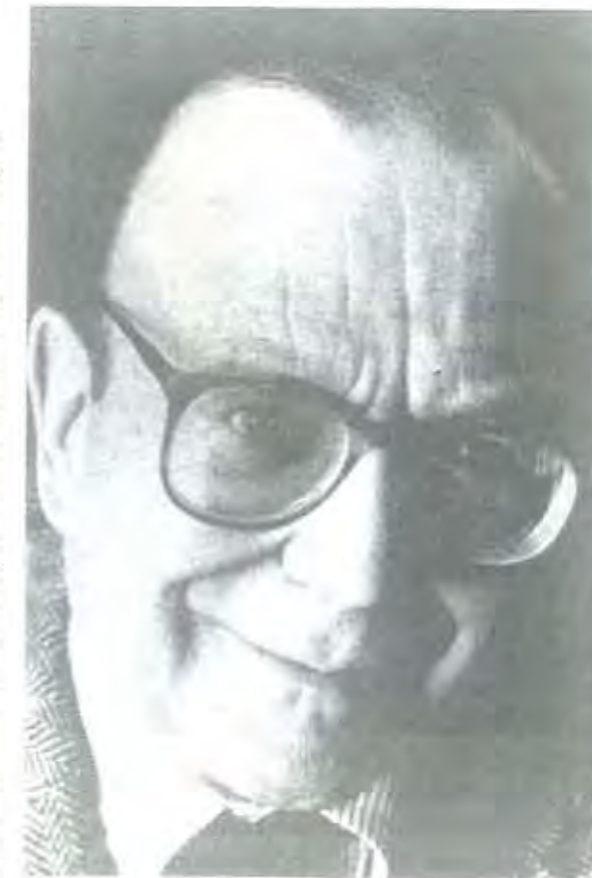
ROBER L. HEILBRONER

Heilbroner y Thurow han propuesto tres razones fundamentales del crecimiento corporativo y concentración de la industria: el desarrollo tecnológico, las fusiones y el ciclo de negocios. El primero permite la producción masiva de bienes a costos decrecientes. Esto da lugar a lo que se denomina economías de escala, es decir, que el costo de producir cada unidad adicional se incrementa en forma menos que proporcional, por lo que el costo promedio se reduce al elevar la producción, lo cual incentiva el crecimiento de las empresas, pues al producir más, mayor será la utilidad obtenida. Así, las empresas que desarrollan tecnología alcanzan ventajas competitivas que también estimulan el crecimiento. Como lo apuntamos antes, la intensidad en el uso de tecnología es uno de los factores que determinan el grado diferente de concentración de las industrias. A mayor intensidad tecnológica mayor concentración y a mayor crecimiento de las empresas corresponde una mayor generación de tecnología. En el mismo