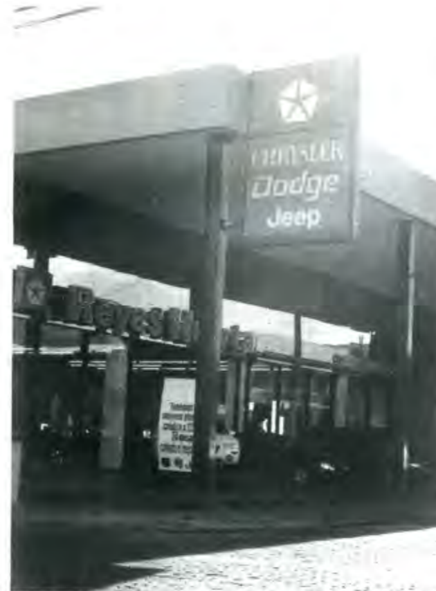
LA ELIMINACIÓN DEL IMPUESTO SOBRE AUTOMÓVILES NUEVOS, ES UNA FORMA EFICAZ PARA AUMENTAR LA RIQUEZA DE LAS CLASES DEL DINERO

No hace mucho tiempo, veinte días a lo sumo, embriagado aún por los efectos de la victoria electoral del dos de julio pasado, que el presidente electo Vicente Fox Quesada destacaba, con gran despliegue propagandístico, las promesas de su campaña y los propósitos de su plan de gobierno. Entre las propuestas económicas más importantes se señala-