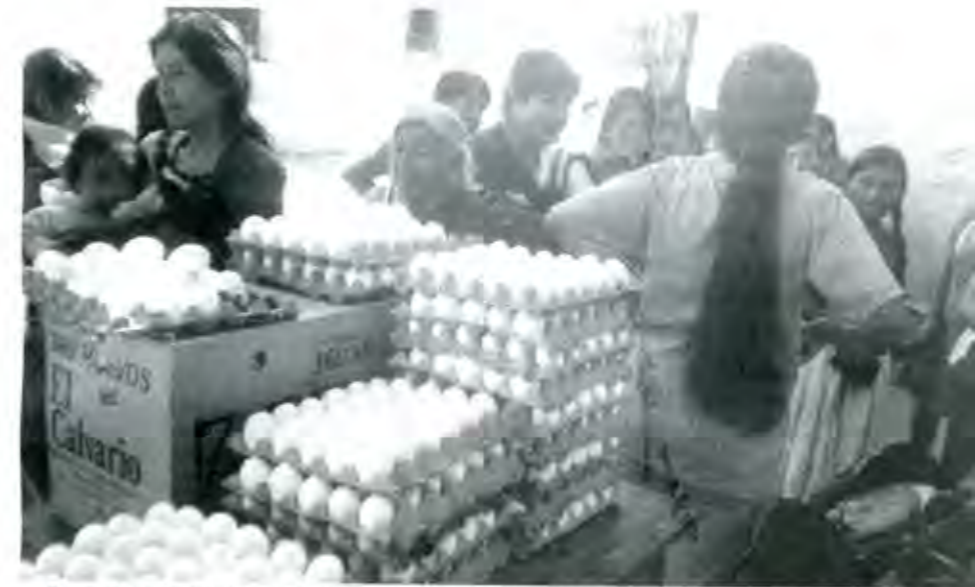
LA IMPOSICIÓN DEL IVA A LOS ALIMENTOS Y MEDICINAS ES UNA MANERA DE AUMENTAR LA POBREZA DE LAS CLASES POPULARES

El presidente electo Vicente Fox Quesada ya tiene su primer rechazo del pueblo de México.