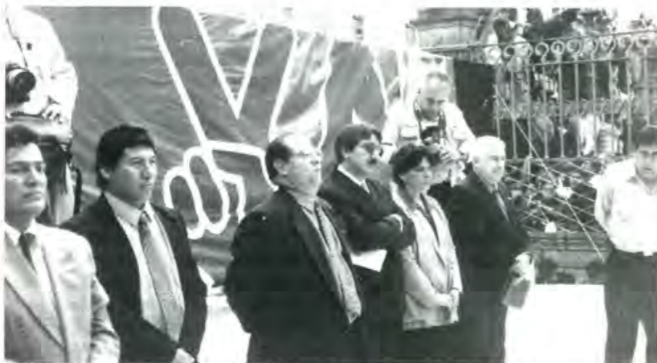
EL PAN NUNCA SE CARACTERIZÓ POR ENCABEZAR LAS DEMANDAS Y CARENCIAS DE LA GENTE POBRE

Es cierto que no siempre utilizan de inmediato y desde el primer encuentro el argumento de fondo. Muchas veces alegan una "agenda muy cargada" del funcionario en cuestión, recurren al diferimiento reiterado de la audiencia con el claro propósito de que los solicitantes se aburran y renuncien a sus pretensiones o, simplemente, los envían a "dialogar" con alguien de ínfimo nivel que, de entrada, advierte a los peticionarios que no tiene ninguna facultad