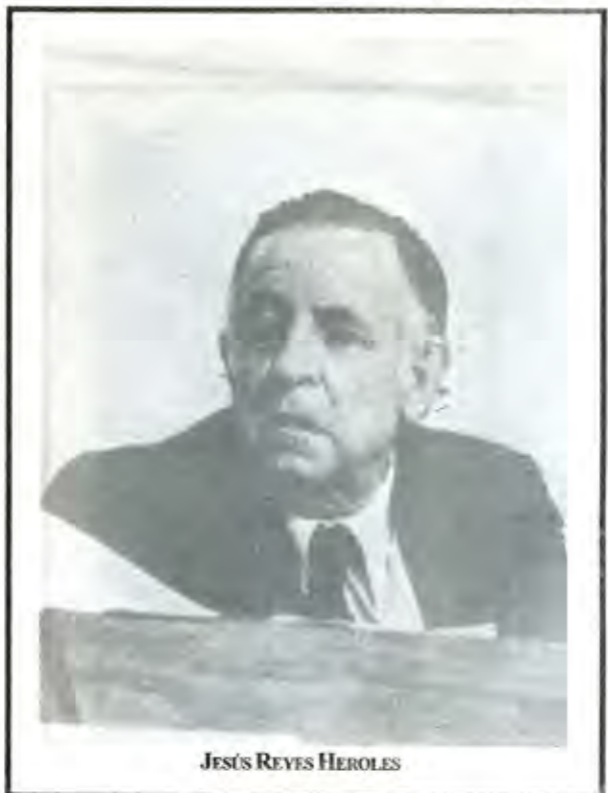
JESÚS REYES HERÓLES

diatizar el descontento popular por la vía de cooptar a los líderes con una simple diputación, si no hubiera sido porque, como queda dicho páginas atrás, la crisis económica no solamente no amainó, sino que creció y se profundizó durante el sexenio de López Portillo y también durante el régimen de Miguel de la Madrid Hurtado. Debido a ello, justamente al final de este último, como también ya dijimos, la clase política se dividió. El bando partidario de retornar al modelo neokeynesiano, a su vez, se dividió en dos grupos: uno radical, que sostenía que no quedaba ya más remedio que enfrentar