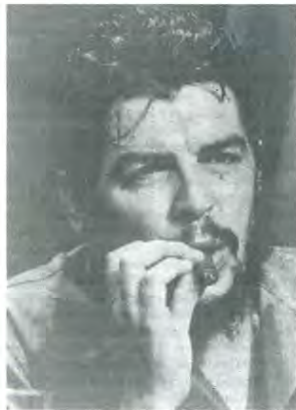
ERNESTO CHE GUEVARA

De entrada, podemos afirmar, sin caer en la temeridad, que el actual crecimiento que ostenta la oposición, de izquierda y de derecha, es una consecuencia directa del fracaso económico del modelo keynesiano que hemos descrito más arriba. En efecto, hasta antes de la década de los setentas, dicha oposición había tenido una vida vegetativa que le permitía sobrevivir en una grisura permanente con destellos muy esporádicos de reavivamiento coyuntural. Ahora bien, según la mayoría de opiniones, el acto fundacional de lo que pudiéramos llamar la nueva