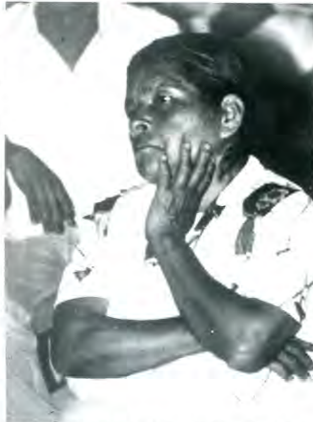
EL NUEVO GOBIERNO SE PROPONE CRECER ECONÓMICAMENTE A COSTA DE ESQUILMAR, AÚN MÁS, A LAS CLASES POPULARES Y MARGINADAS DEL PAÍS

Ciertamente que todo lo declarado por el equipo de transición del nuevo gobierno panista no tiene todavía fuerza de ley, puesto que su plan no lo han aprobado las Cámaras Legislativas. Pero el tanteo es un intento serio de corresponder a las clases del dinero que los llevaron al poder. A los empresarios transformados en gobernantes no les faltan ganas ni temple para esquilmar, ahora mediante el impuesto, a las clases más necesitadas