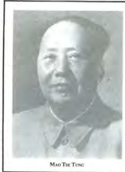
MAO TSE TUNG

Como todos recordamos, el primero en tomar conciencia del peligro no fue Luis Echeverría o algún alto funcionario de su gobierno, sino el Secretario de Gobernación de José López Portillo, el distinguido intelectual orgánico del sistema