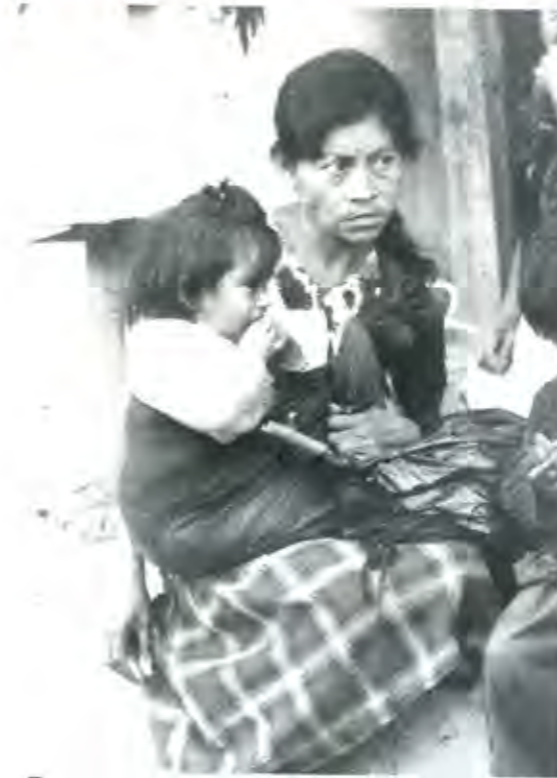
EL PRI PERDIÓ PORQUE LOS FUNCIONARIOS SALIDOS DE SUS FILAS SE OLVIDARON DE ATENDER Y RESOLVER LOS PROBLEMAS DE LA GENTE.

decisiones en una persona o en un pequeño grupo de personas que luego las dan a conocer y llaman a que se las acepte y cumpla. Los miembros del CPN ya sufrieron la afrenta de haber sido citados en dos ocasiones, mismas en las que no sesionaron porque -por toda y respetuosa explicación- un empleado en la puerta del auditorio les dijo que la reunión se posponía