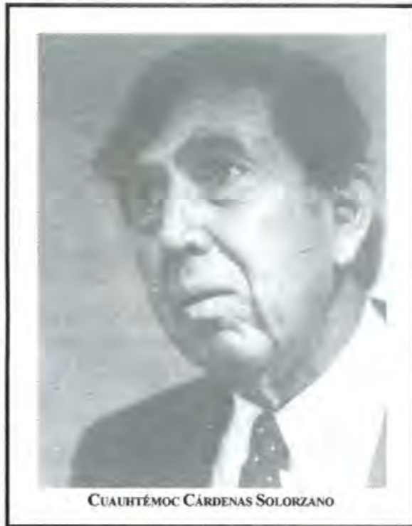
CUAUHTÉMOC CÁRDENAS SOLÓRZANO

En conclusión, pues, la situación nacional actual, que es la que hemos venido queriendo dibujar desde varias páginas atrás, se caracteriza, en el terreno económico, por el abandono del viejo modelo "nacido de la Revolución Mexicana", o neokeynesianismo, y su sustitución por la moderna teoría del capitalismo mundial o imperialista, conocida con los nombres de neoliberalismo y globalización, misma que no acaba de implantarse con la integralidad, profundidad y pertinencia