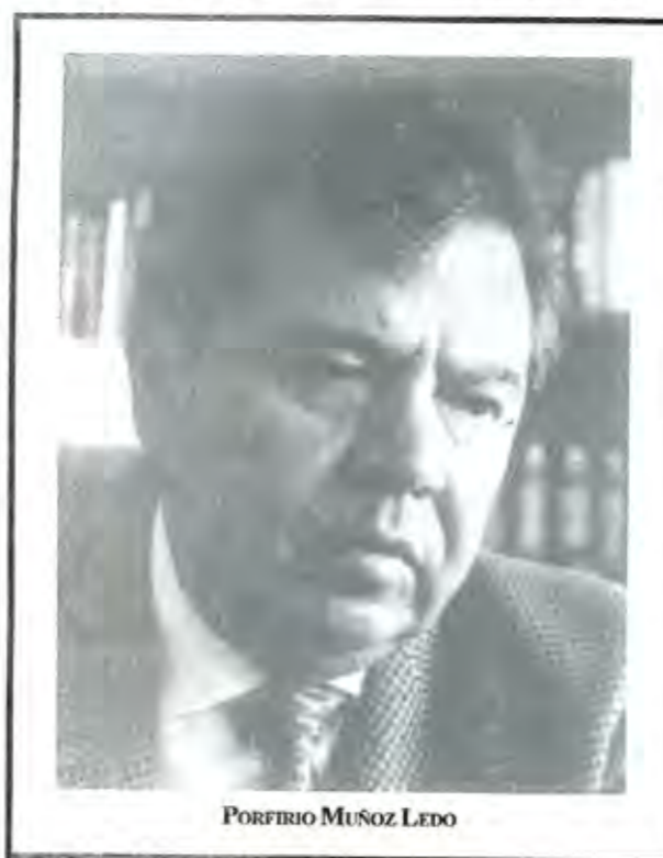
PORFIRIO MUÑOZ LEDO

Ayunos de marxismo-leninismo, puesto que los "líderes históricos" de la izquierda oficial renunciaron a toda la doctrina en su conjunto, sin esforzarse por distinguir lo verdadero de lo falso, lo correcto de lo erróneo, es decir, puesto que arrojaron al niño junto con el agua sucia de la bañera, hoy el P.R.D. y sus principales ideólogos se ven en la vergonzosa situación de tener que pedir prestados a los neokeynesianos, ar-