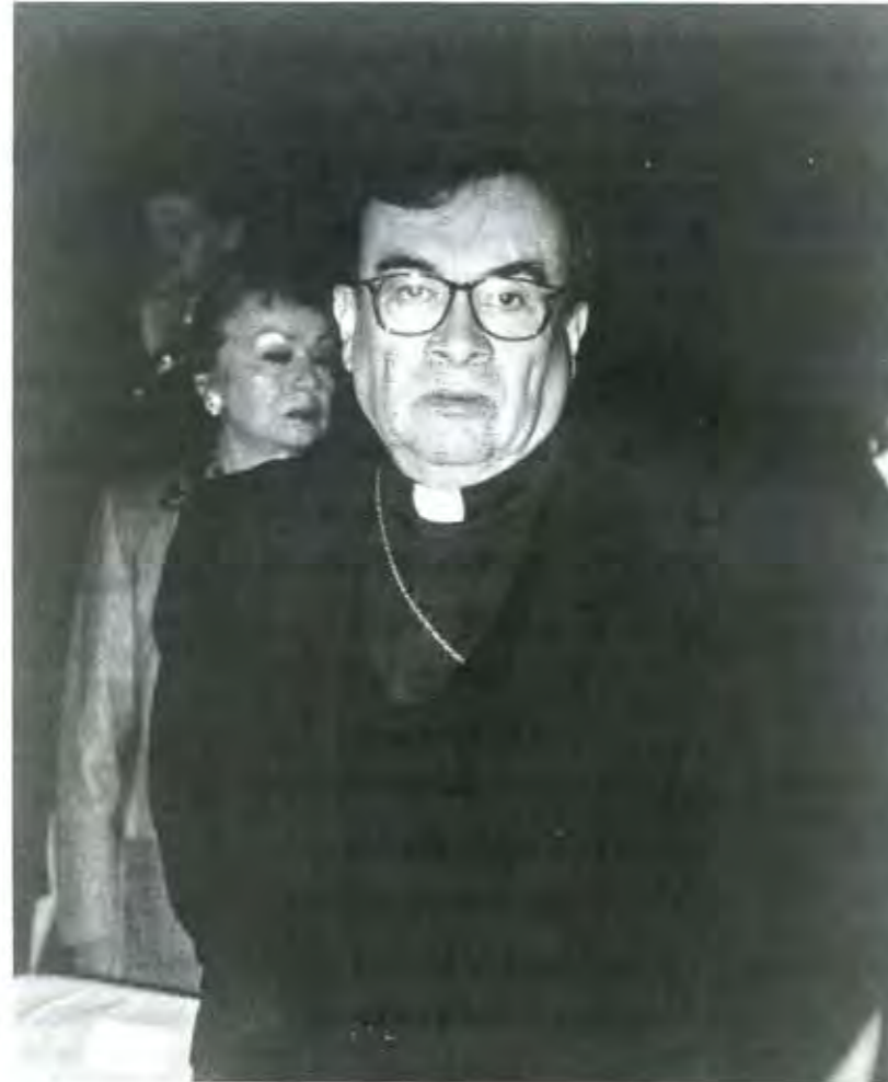
LA ALTA GERARQUÍA DE LA IGLESIA CATÓLICA HIZO LLAMADOS DISIMULADOS A VOTAR POR EL PAN

Las declaraciones hechas el primer mes del año por el obispo de Saltillo, Raúl Vera, en torno a que para dar solución al problema de Chiapas era necesaria la caída del